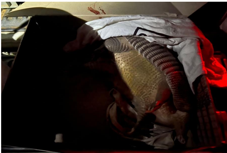
(43964) - Tatu-galinha.