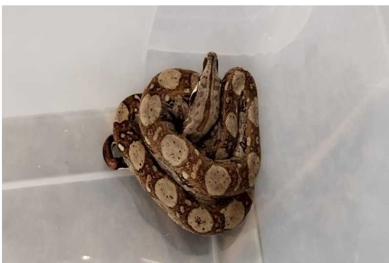
(43875) – Jiboia.