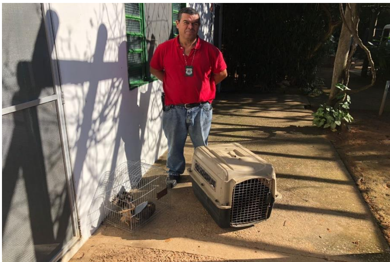
(43911) - Gavião-carijó, com queimadura em asa direita com exposição óssea; e (43912) – Gambá-de-orelha-branca, encontrado em fábrica, hígido. Entregues pela Prefeitura de Indaiatuba no dia 02-06-2023.