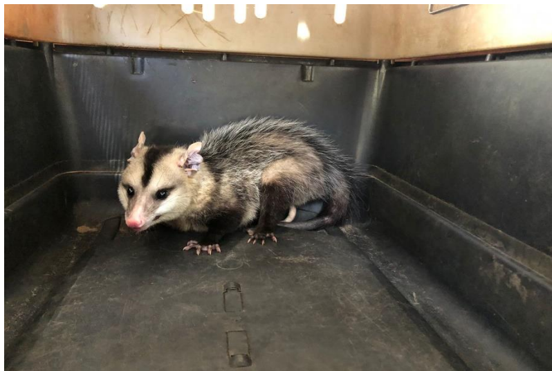
(43912) – Gambá-de-orelha-branca.