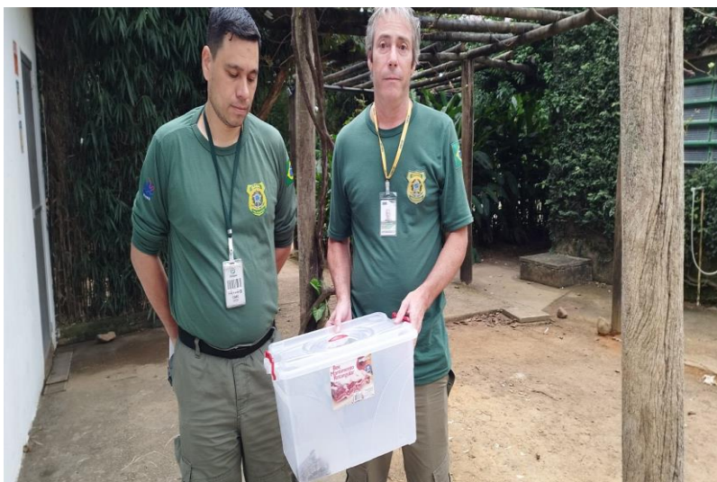
(43875) - Jiboia, filhote, apreendido dentro de caixa de correio em Indaiatuba. Entregue pelo IBAMA no dia 25-05-2023.