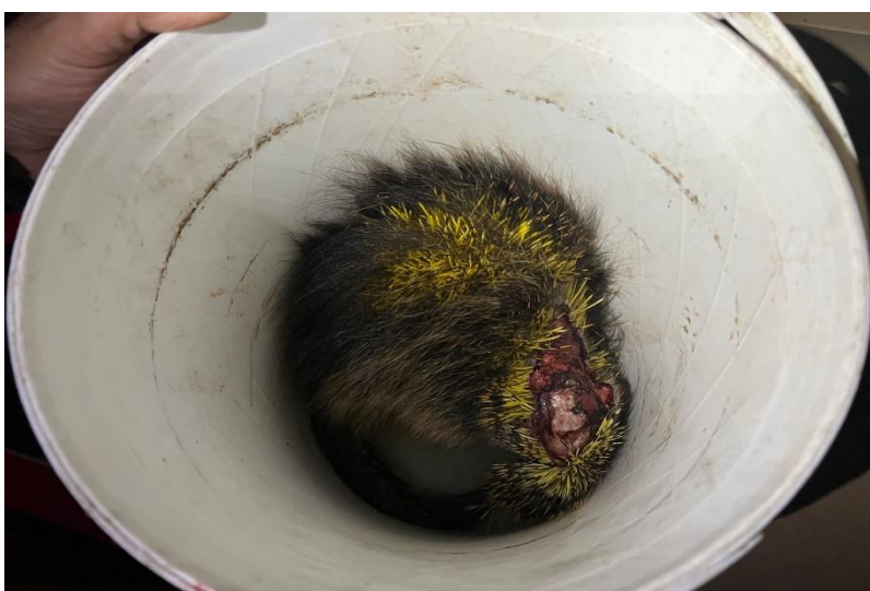
(43965) - Ouriço-cacheiro.