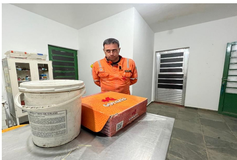
(43964) - Tatu-galinha, atropelado, chegou em óbito; e (43965) - Ouriço-cacheiro, encontrado em chácara, apresenta exposição da calota craniana. Entregues pela Defesa Civil de Indaiatuba no dia 09-06-2023.