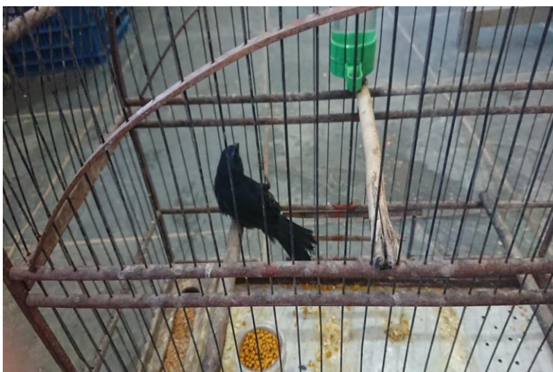
(44451) – Azulão.