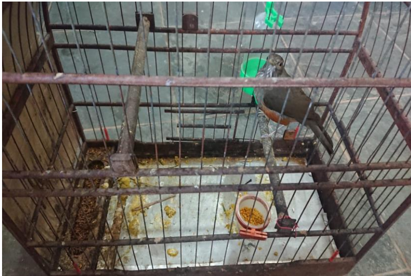
(44446) - Sabiá-laranjeira.