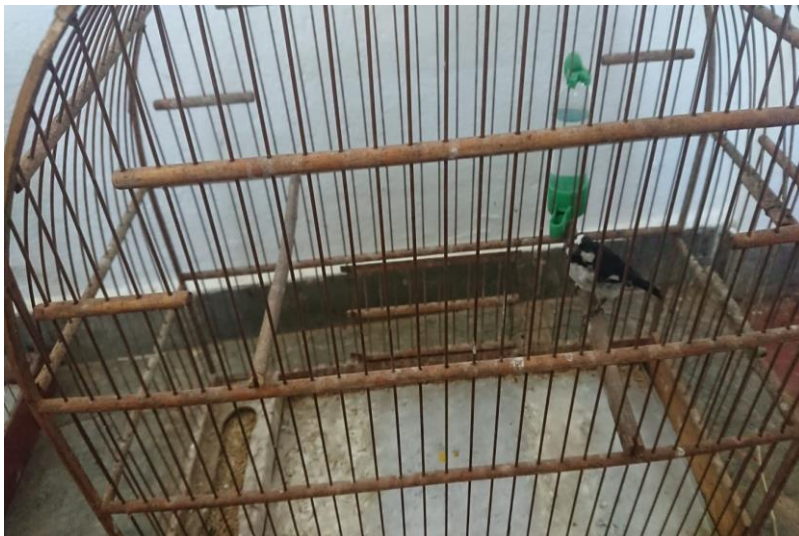
(44447) – Bigodinho.