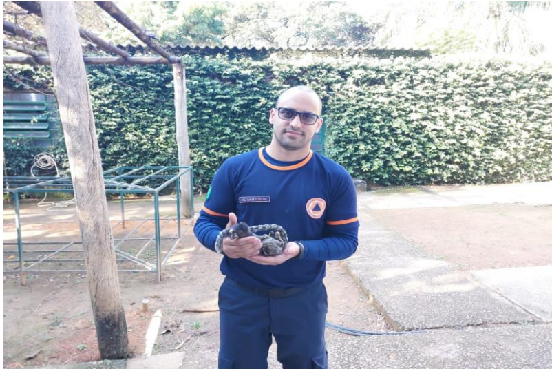
(44351) – Sagui-híbrido, macho, atropelado, apresenta nistagmo, chegou convulsionando. Entregue pela Defesa Civil de Campo Limpo Paulista no dia 11-07-2023.