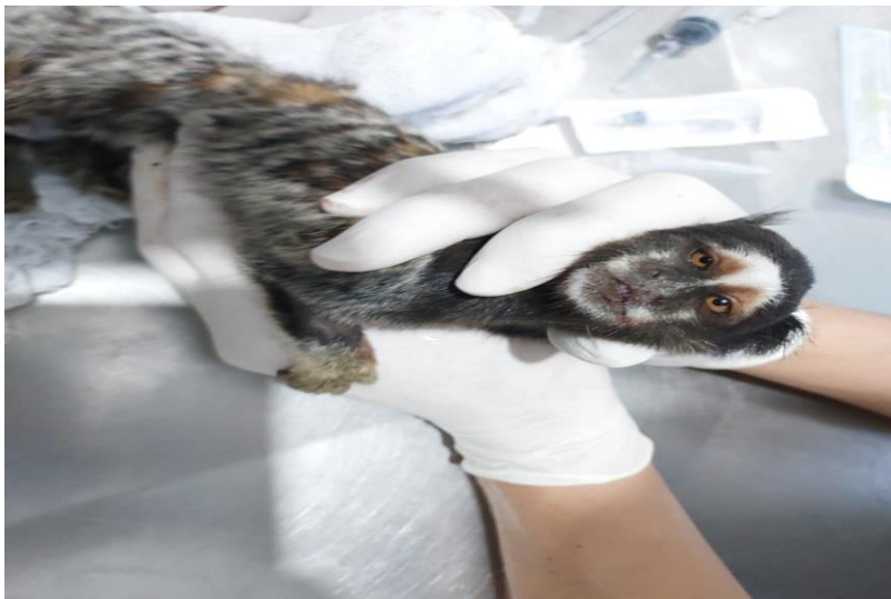
(44351) – Sagui-híbrido.