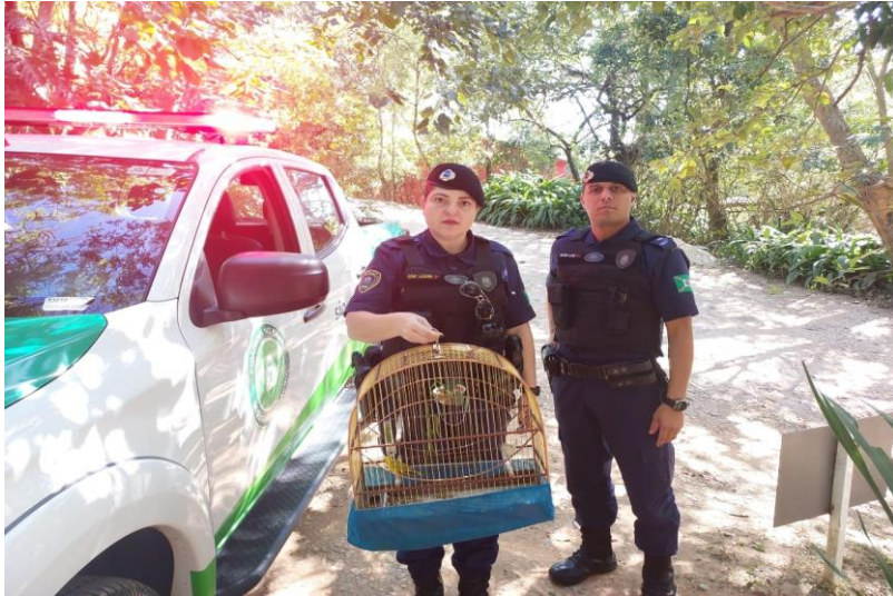
(44415) – Canário-da-terra, apreendido em feira sendo negociado em troca de peça de automóvel. Entregue pela Guarda Municipal de Campo Limpo Paulista no dia 23-07-2023.