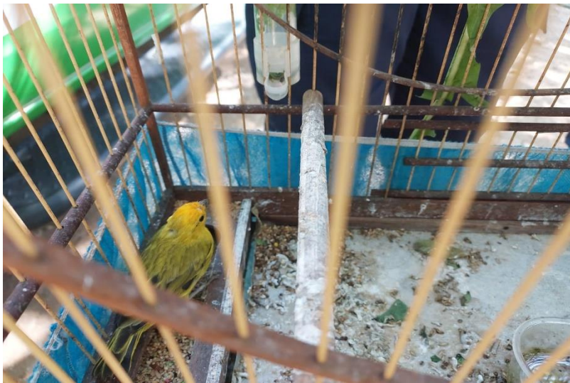
(44415) – Canário-da-terra.