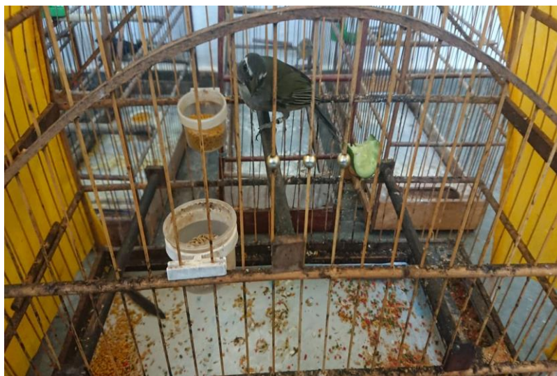
(44452) - Trinca-ferro.