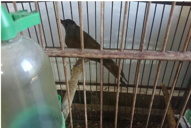
(44445) - Sabiá-barranco.

(44445) - Sabiá-barranco; (44446) - Sabiá-laranjeira; (44447) – Bigodinho; (44448) – Canário-da-terra; (44449 e 44450) – Coleirinhos; (44451) – Azulão; (44452 a 44454) - Trinca-ferros. Todos apreendidos e entregues pela Guarda Municipal de Campo Limpo Paulista no dia 31-07-2023.