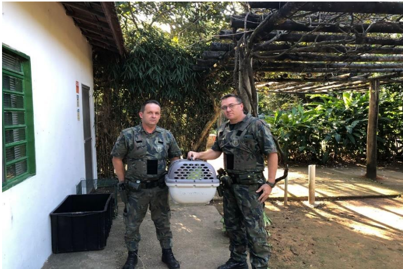
(44262) - Papagaio-verdadeiro, entregue voluntariamente, obeso. Entregue pela Guarda Municipal de Cajamar no dia 22-06-2023.