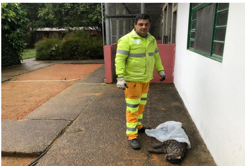
(44015) - Jaguaririca, encontrada em beira de avenida em Cajamar, chegou em óbito. Entregue pela CCR Autoban no dia 16-06-2023.