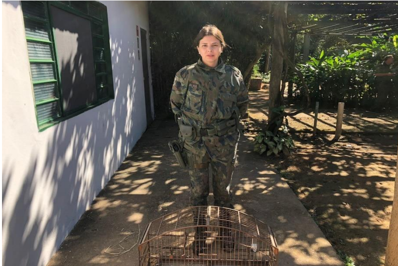
(44280) - Trinca-ferro, apreensão, com deformidade em bico. Entregue pela Guarda Municipal de Cajamar no dia 25-06-2023.