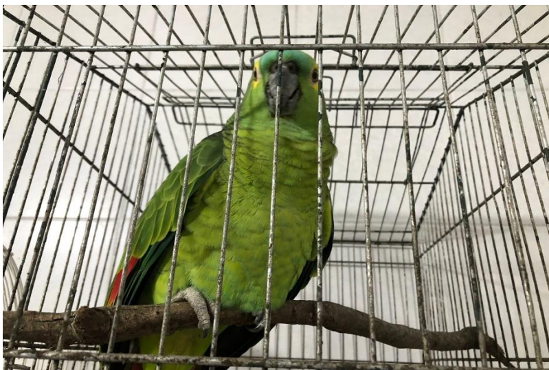
(44262) - Papagaio-verdadeiro.