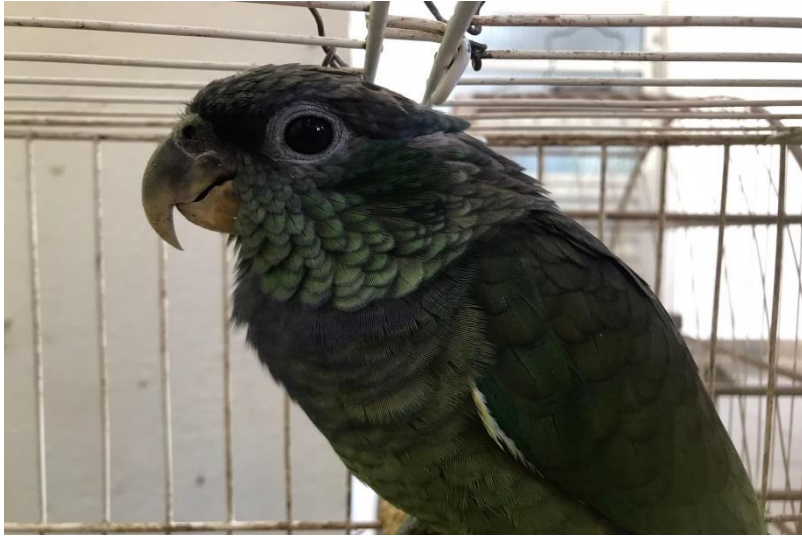
(43921) - Maitaca-verde.