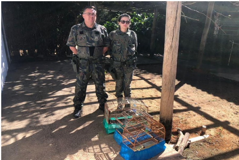
(43971 e 43972) – Coleirinho; e (43973) – Galo-da-campina. Todos vindos de apreensão e entregues pela Guarda Municipal de Cajamar no dia 11-06-2023.