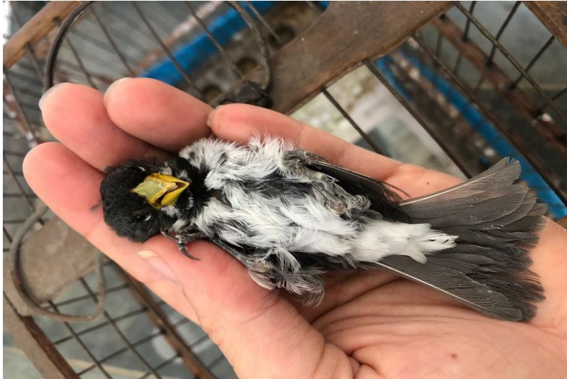
(43971) – Coleirinho.