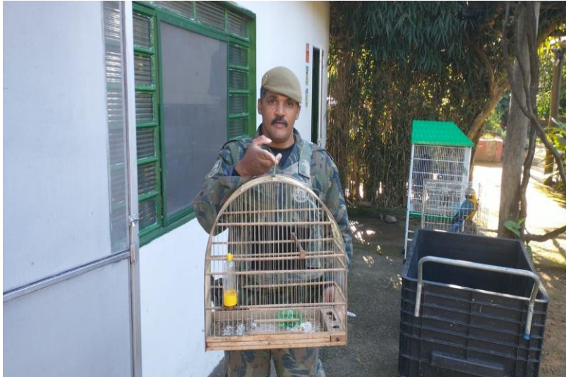
(44028) - Coleirinho, apreensão. Entregue pela Guarda Municipal de Cajamar no dia 18-06-2023.