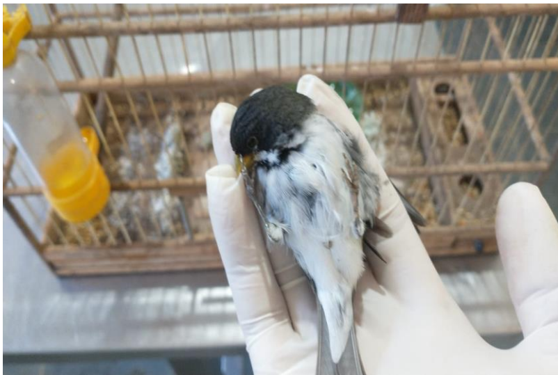
(44028) – Coleirinho.