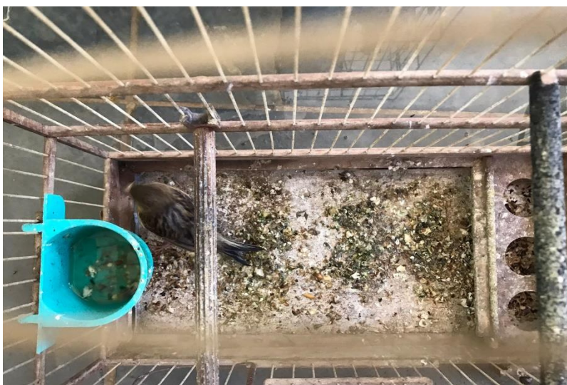
(43920) - Canário-belga.