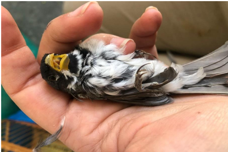
(43972) – Coleirinho.