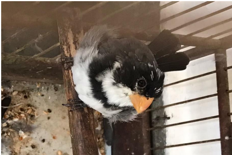
(43922) – Coleirinho.