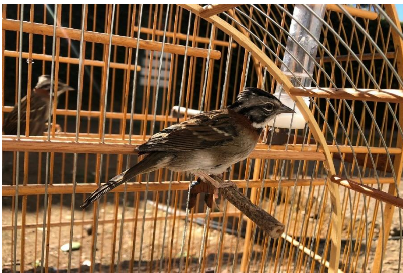
(44277 e 44278) - Tico-tico.