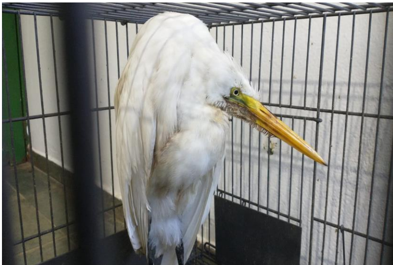
(44027) - Garça-branca-grande.