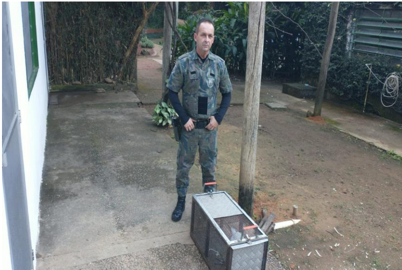
(44027) - Garça-branca-grande, encontrado em garagem de condomínio, magro e prostrado. Entregue pela Guarda Municipal de Cajamar no dia 17-06-2023.