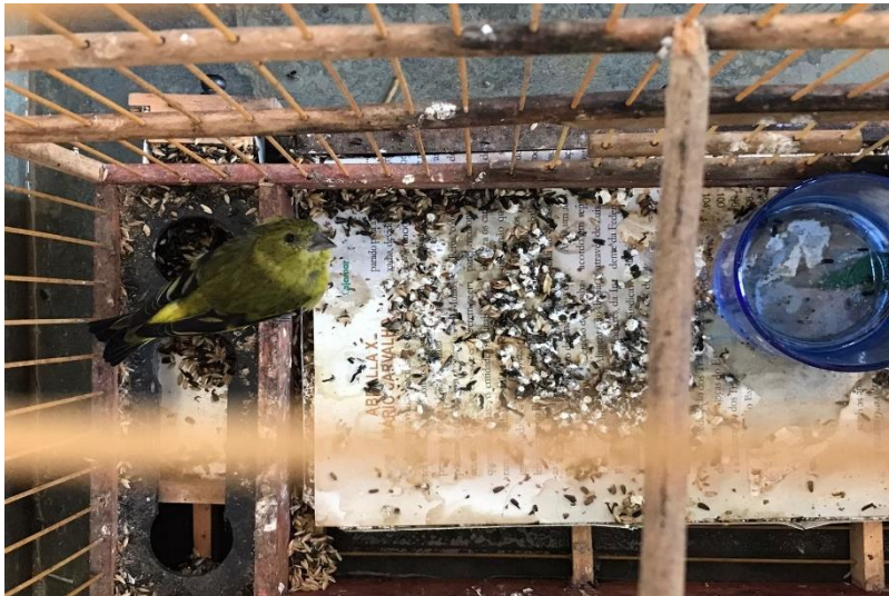
(43923) – Pintassilgo.