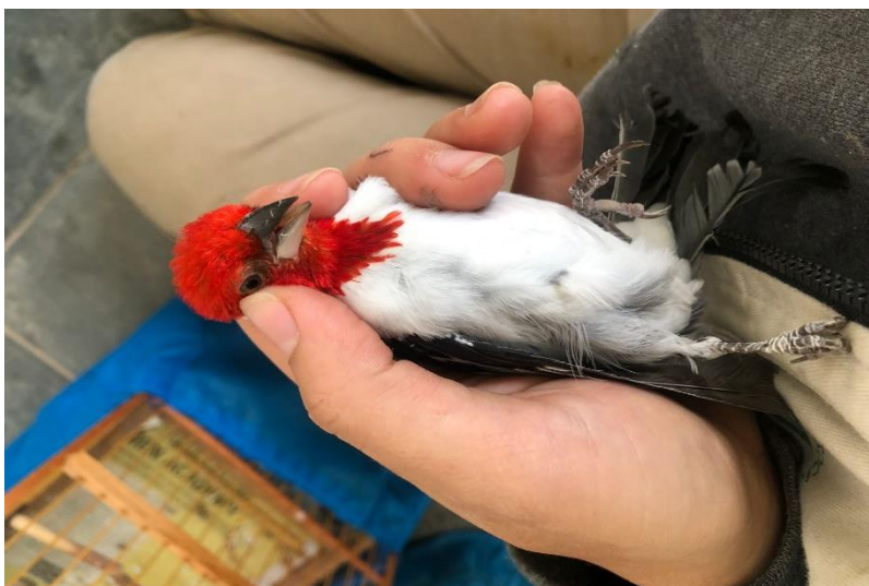
(43971) – Galo-da-campina.