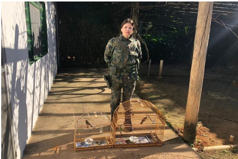
(44277 e 44278) - Tico-tico, apreensão. Entregue pela Guarda Municipal de Cajamar no dia 25-06-2023.