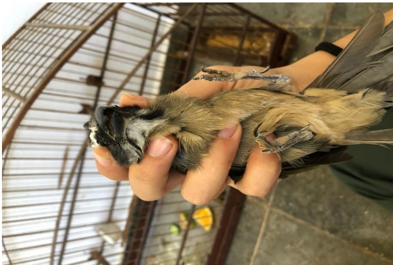
(44280) - Trinca-ferro.