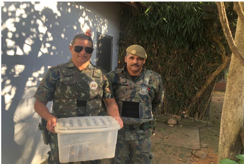
(44353) – Gambá-de-orelha-preta, capturado junto a mãe e irmãos, mas não acompanhou a família na soltura. Entregue pela Guarda Municipal de Cajamar no dia 12-07-2023.