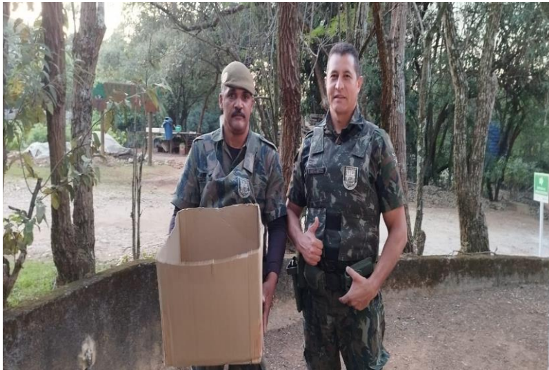
(44413) – Sagui-de-tufo-preto, macho, filhote, encontrado sendo arrastado por cão. Entregue pela Guarda Municipal de Cajamar no dia 21-07-2023.