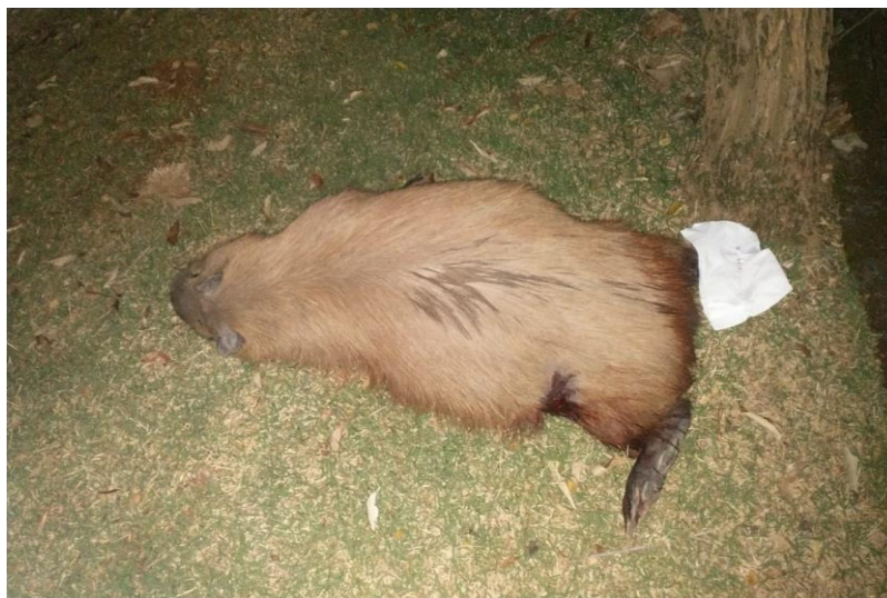
(44441) – Capivara.