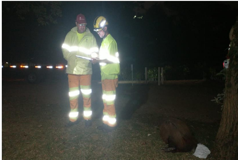
(44441) - Capivara, atropelada no km 31 N Anhanguera em Cajamar, chegou em óbito. Entregue pela CCR Autoban no dia 30-07-2023.