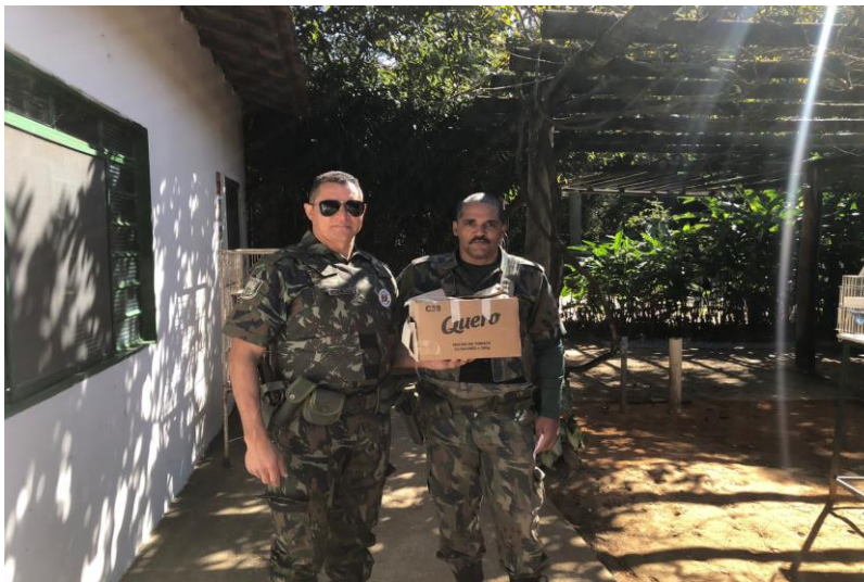
(44336) – Gambá-de-orelha-preta, apresenta incoordenação, ausência de movimentação de membro pélvico esquerdo. Entregue pela Guarda Municipal de Cajamar no dia 07-07-2023.