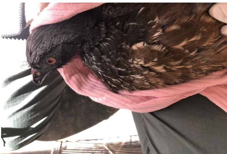
(44316) – Jacu.