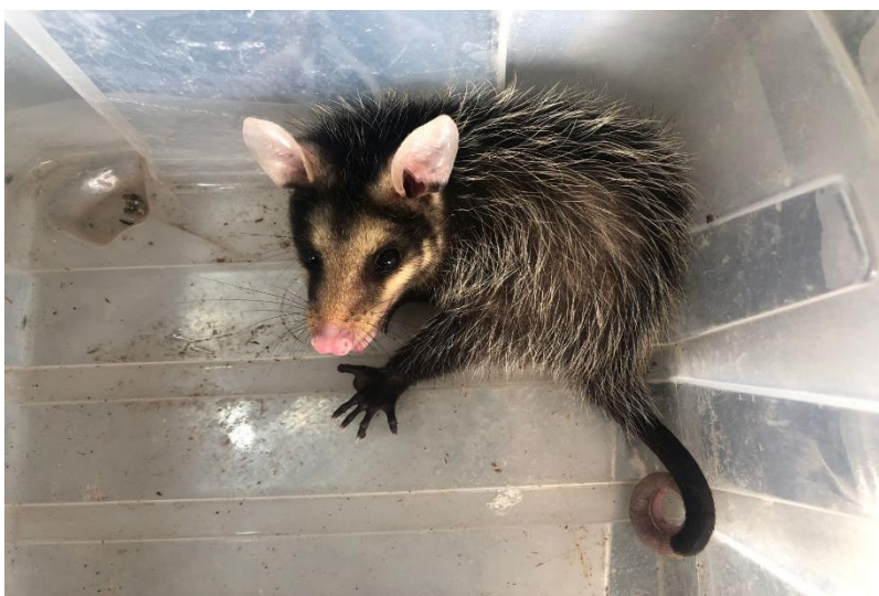
(44353) – Gambá-de-orelha-preta.