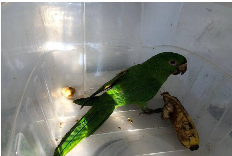
(44332) – Maritaca.