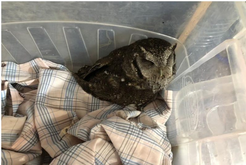
(44314) - Corujinha-do-mato.