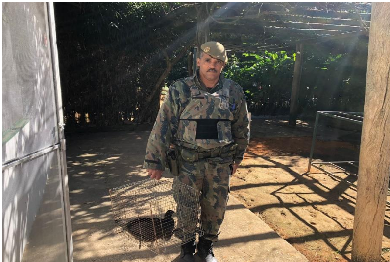
(44316) - Jacu, com lesões em bico e membros pélvicos, corte de penas de asa esquerda. Entregue pela Guarda Municipal de Cajamar no dia 04-07-2023.