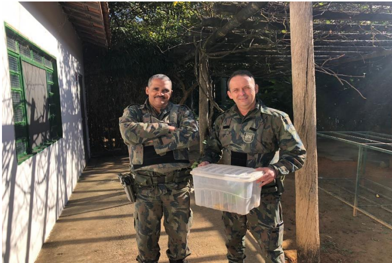
(44332) - Maritaca, encontrado em escola, magro e desidratado. Entregue pela Guarda Municipal de Cajamar no dia 06-07-2023.