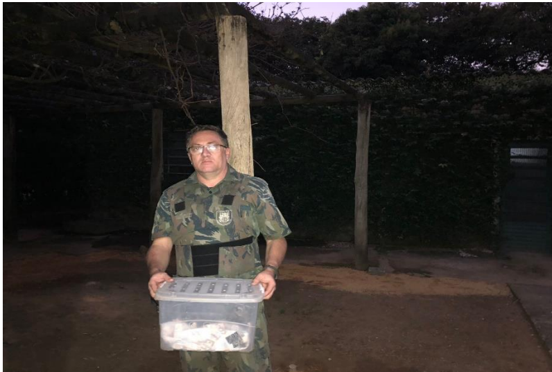
(44314) - Corujinha-do-mato, encontrado enrolado em linha. Entregue pela Guarda Municipal de Cajamar no dia 03-07-2023.