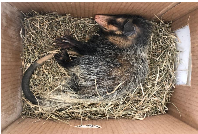
(44336) – Gambá-de-orelha-preta.