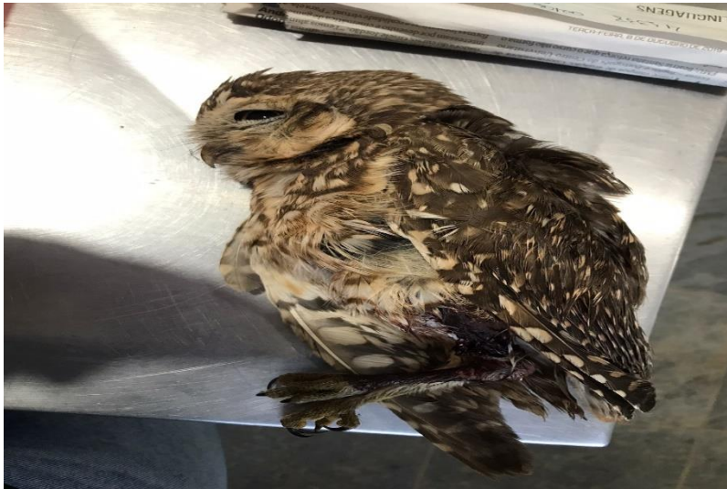
(43933) - Coruja-buraqueira, encontrado preso em arame farpado, com fratura em membro posterior esquerdo e perfurações. Vindo de Bragança Paulista no dia 04-06-2023.