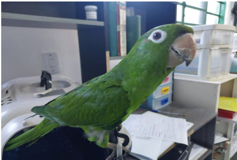
(44290) - Maritaca, manso, com penas cortadas. Vindo de Bragança Paulista no dia 27-06-2023.