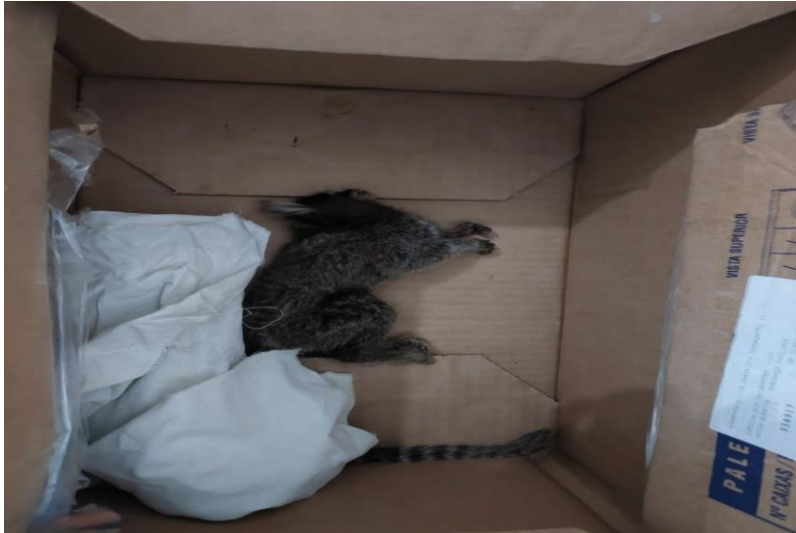
(44008) – Sagui-de-tufo-preto, fêmea, jovem, prostrado, com miíase em região inguinal. Vindo de Bragança Paulista no dia 14-06-2023.