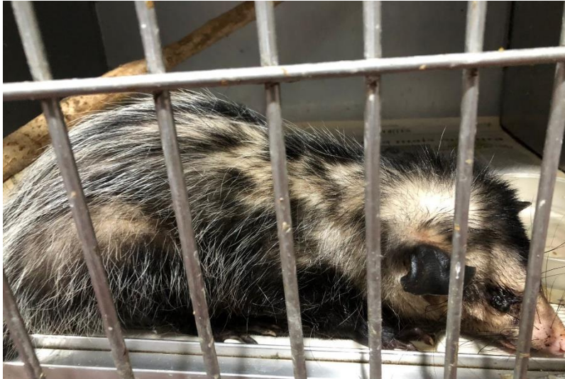
(44276) – Gambá-de-orelha-preta, com cegueira em olho esquerdo e enucleação de olho direito, com fratura em mandíbula. Vindo de Bragança Paulista no dia 24-06-2023.