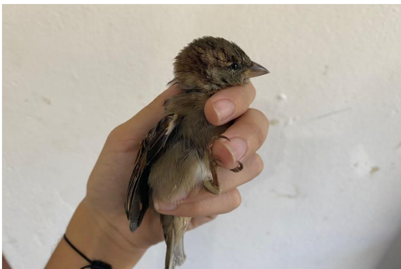
(43985) - Pardal, com necrose e exposição de úmero direito. Vindo de Bragança Paulista no dia 12-06-2023.