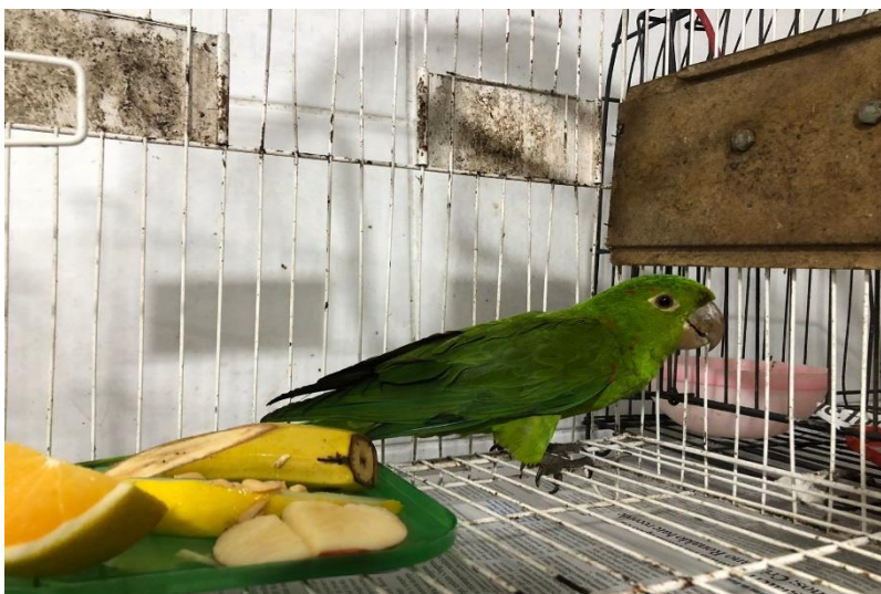
(44330) - Maritaca, caiu em quintal, está magro e com descamação em bico. Vindo de Bragança Paulista no dia 05-07-2023.