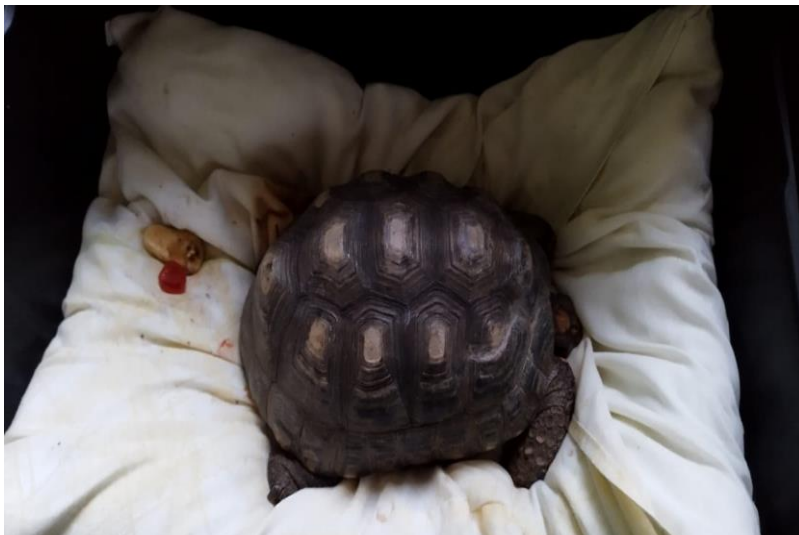
(44458) - Jabuti, macho, com sangramento ativo nos membros pélvicos. Vindo de Bragança Paulista no dia 31-07-2023.