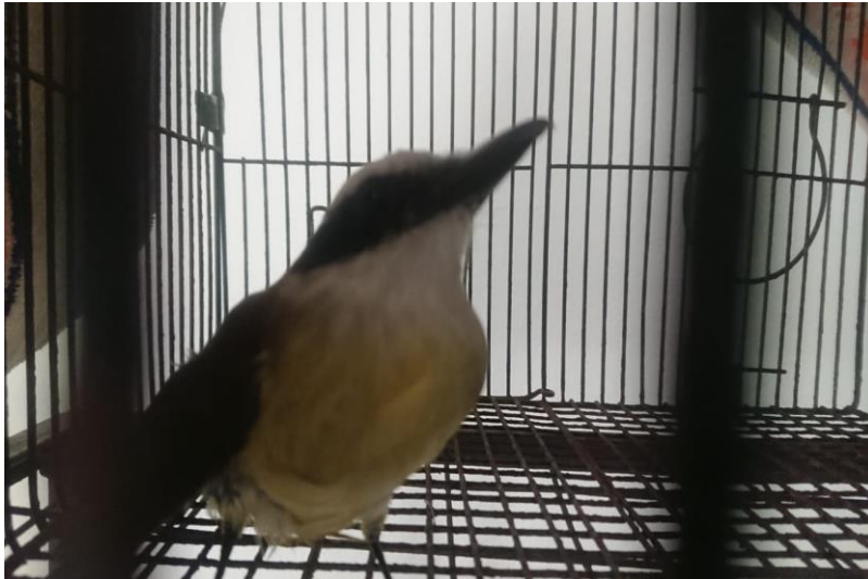
(44430) - Bem-te-vi. Vindo de Bragança Paulista no dia 26-07-2023.