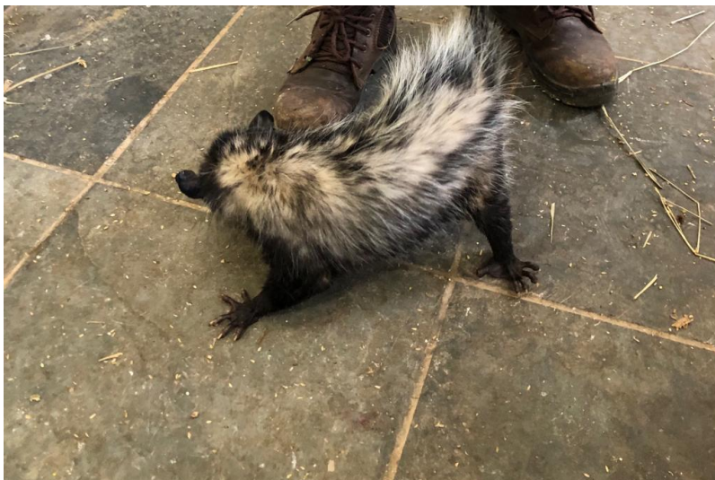
(44363) – Gambá-de-orelha-preta, apresenta protrusão ocular, fratura de mandíbula, palato mole, e sangramento em narinas. Vindo de Bragança Paulista no dia 13-07-2023.