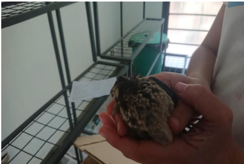
(44409) – Columbiforme, sem ID, filhote. Vindo de Bragança Paulista no dia 21-07-2023.