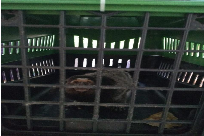
(44401) – Sagui-de-tufo-preto, macho, era PET. Vindo de Bragança Paulista no dia 18-07-2023.