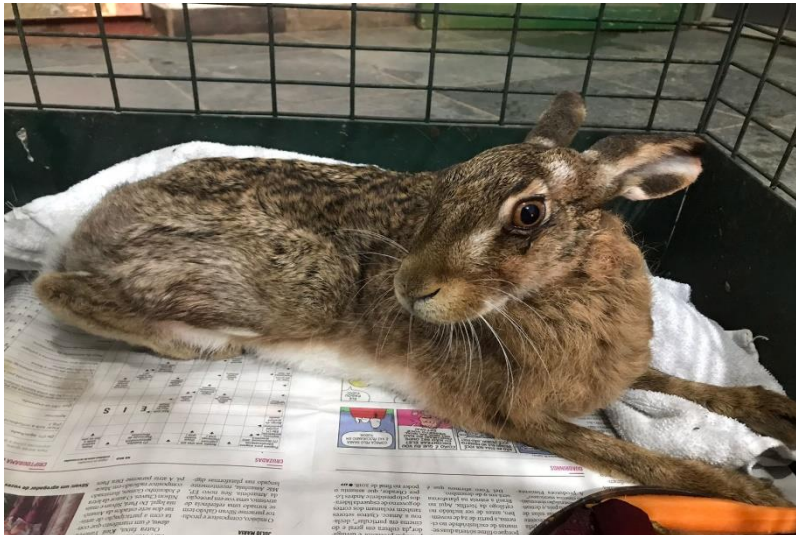
(44326) - Lebre, com fratura em coluna e escoriação no membro pélvico esquerdo. Vindo de Bragança Paulista no dia 04-07-2023.