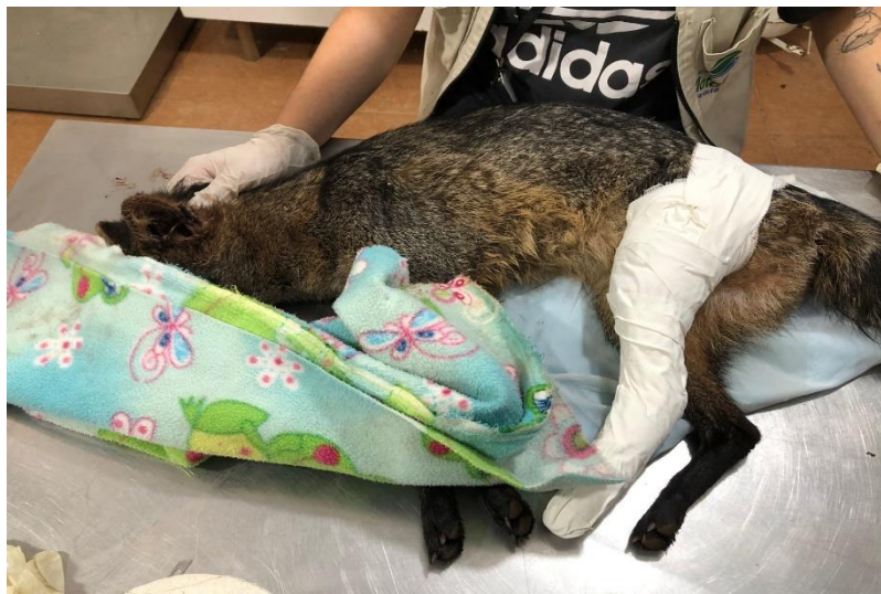
(44411) - Cachorro-do-mato, atropelado, com nistagmo bilateral horizontal e nível de consciência reduzido. Vindo de Bragança Paulista no dia 21-07-2023.