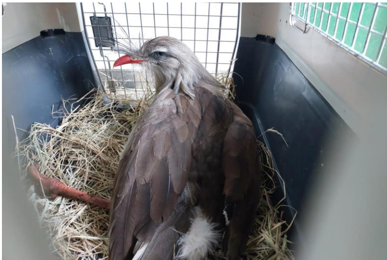
(44350) - Seriema, com fratura em tibiotarso esquerdo. Vindo de Bragança Paulista no dia 11-07-2023.