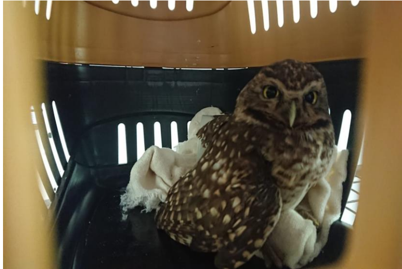
(44410) - Coruja-buraqueira. Vindo de Bragança Paulista no dia 21-07-2023.