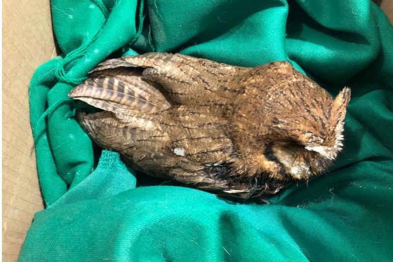
(44425) - Corujinha-do-mato, apresenta avulsão de pele em asa direita, com exposição óssea e tendinea. Vindo de Bragança Paulista no dia 25-07-2023.