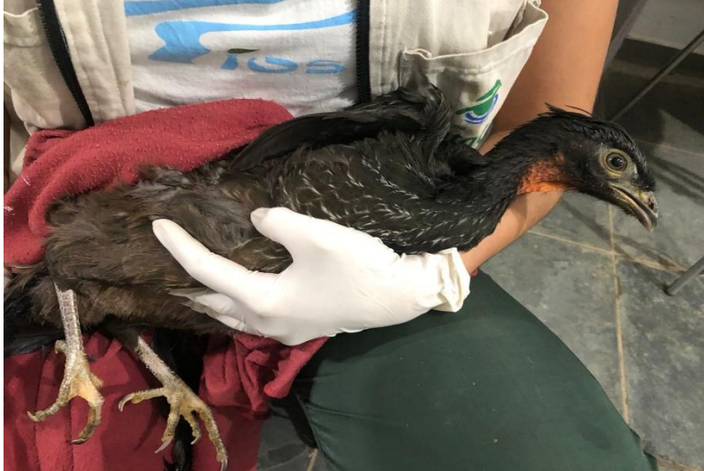
(44331) - Jacu, entrega voluntária, apresenta arrancamento de penas primárias em asa esquerda. Vindo de Bragança Paulista no dia 05-07-2023.