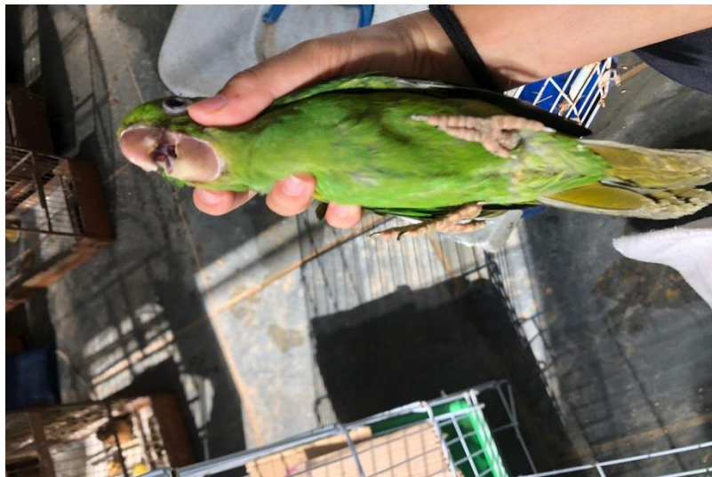
(43019) – Maritaca.