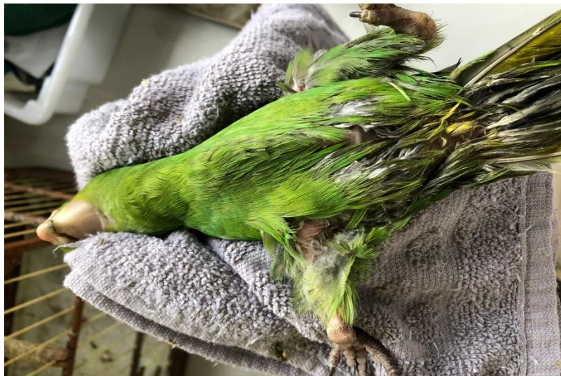
(42895) – Maritaca.