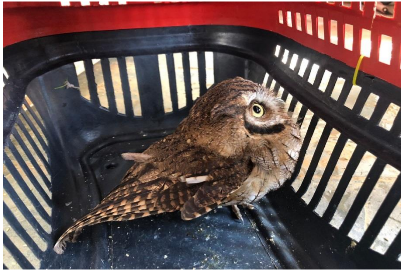
(43020) – Corujinha-do-mato.