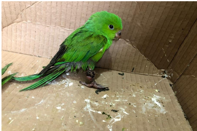
(42861) - Periquito-rico.