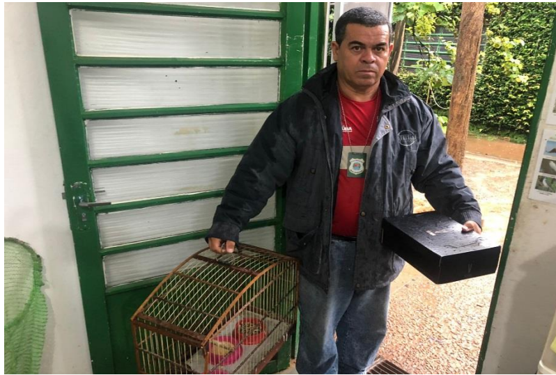
(43168) – Gambá-de-orelha-preta; e (43169) – Sabiá-do-barranco. Entregues pela Prefeitura de Indaiatuba no dia 10-03-2023.