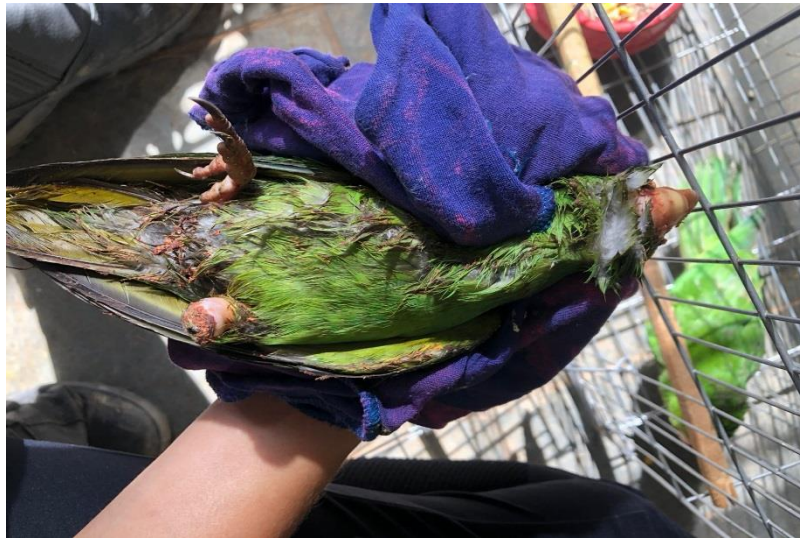
(43269) – Maritaca.