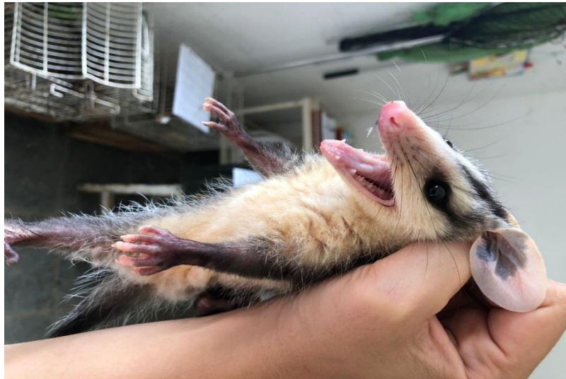
(43271) – Gambá-de-orelha-preta.