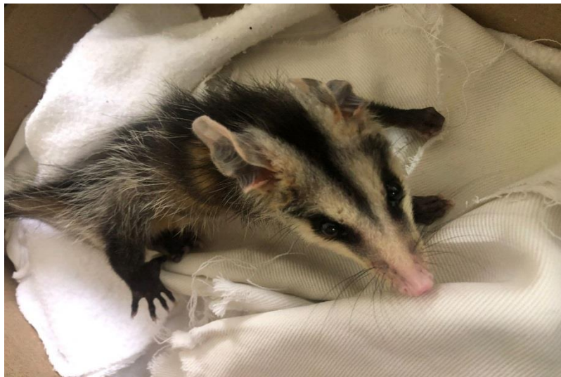
(43168) – Gambá-de-orelha-preta.