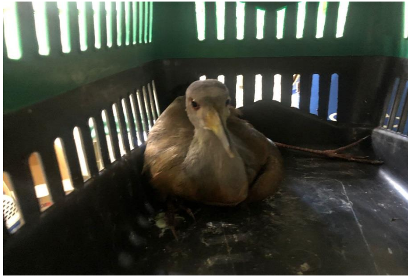
(42828) – Saracura.