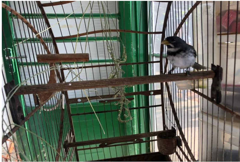
(43022) – Coleirinho.