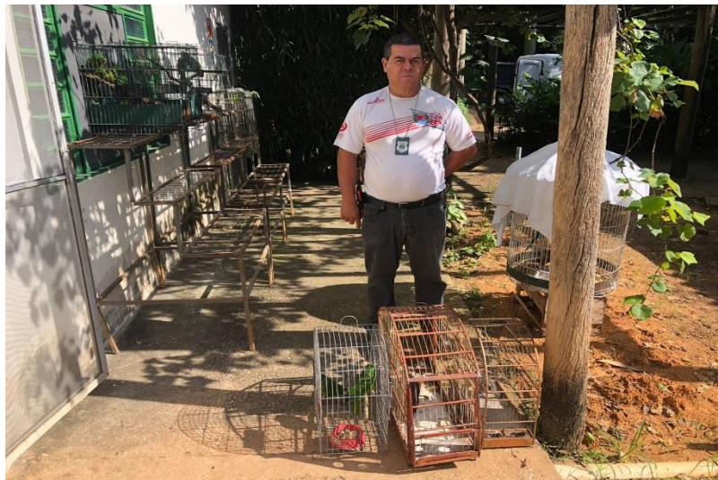
(43269 e 43270) – Maritacas, encontradas em telhado de residência com membro pélvico amputado; (43271) – Gambá-de-orelha-preta, filhote, encontrado em quintal; (43272) – Gavião-carijó, encontrado caído apresentando lesão em olho direito, com edemaciação e queimadura em membro posterior direito. Entregues pela Prefeitura de Indaiatuba no dia 17-03-2023.