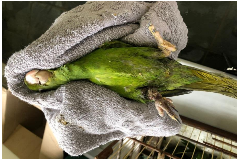
(42894) – Maritaca.