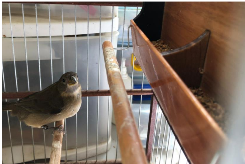
(43023) – Coleirinho.