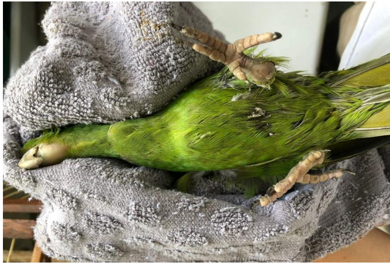
(42896) – Maritaca.