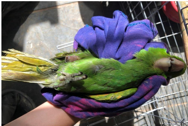
(43270) – Maritaca.