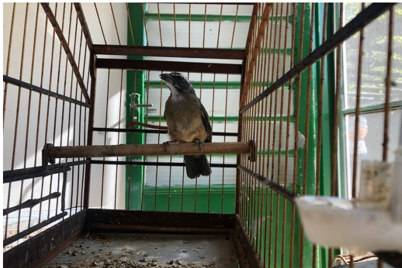
(43021) – Trinca-ferro.