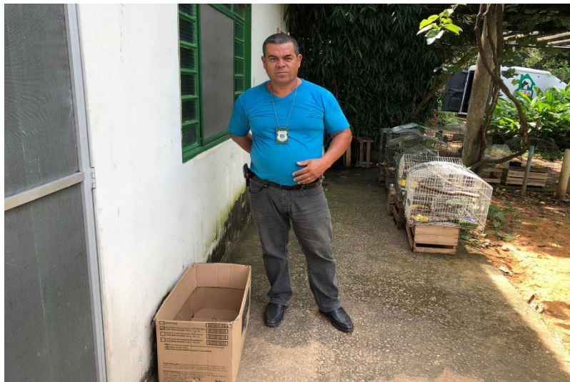
(42857 a 42860) - Maritacas, com amputação traumática de membro pélvico, encontrados no forro; e (42861) - Periquito-rico, apresenta splay leg e garroteamento de membro pélvico direito. Entregues pela Secretaria do Meio Ambiente de Indaiatuba no dia 24-02-2023.