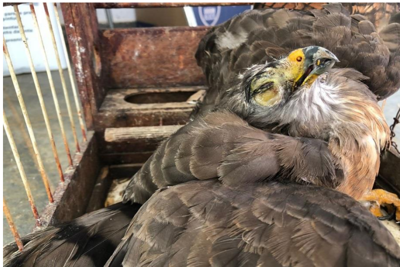
(43272) – Gavião-carijó.