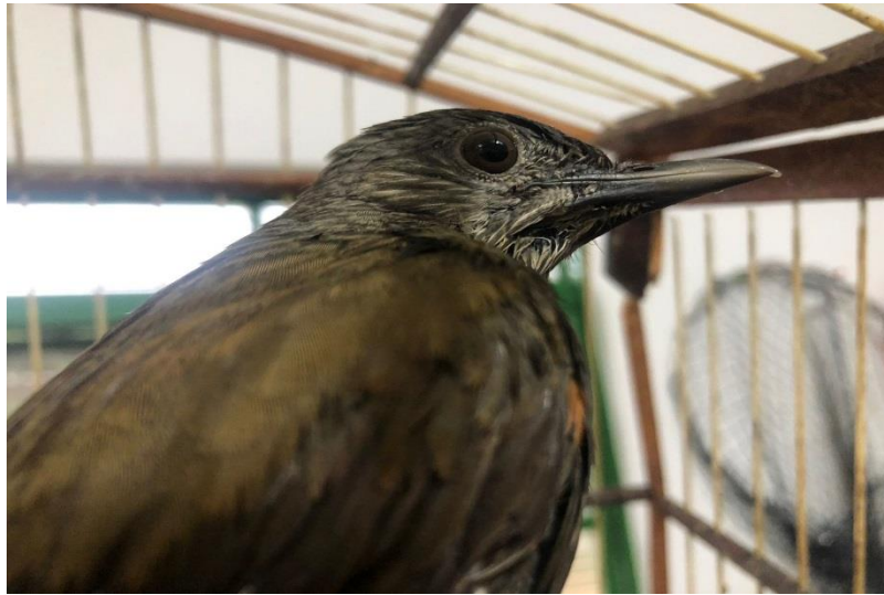
(43169) – Sabiá-do-barranco.