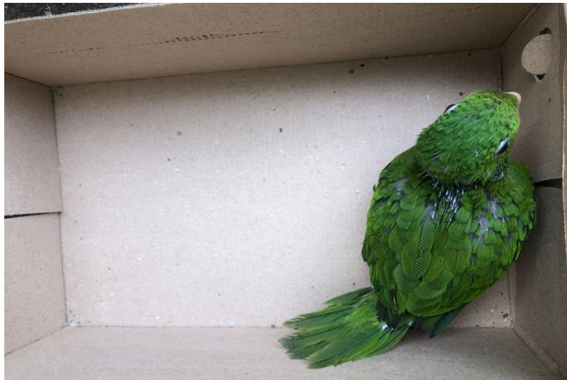
(42827) – Maritaca.

(42827) - Maritaca, filhote, encontrado em residência; e (42828) - Saracura, magra, com fratura completa em fêmur esquerdo. Entregues pela Prefeitura de Indaiatuba no dia 22-02-2023.