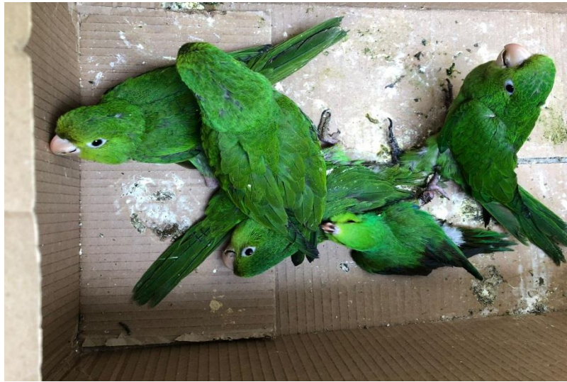
(42857 a 42860) – Maritacas.