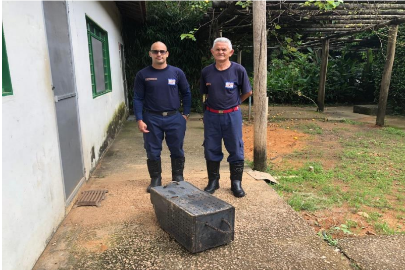
(42549) - Agapornis, encontrado em residência, com corte de penas. Entregue pela Defesa Civil de Campo Limpo Paulista no dia 07-02-2023.