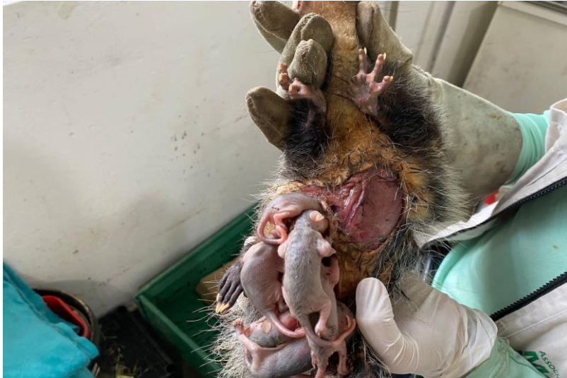
(42775 a 42781) – Gambás-de-orelha-preta.