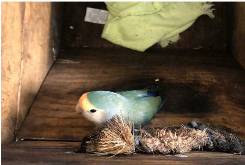
(42549) – Agapornis.