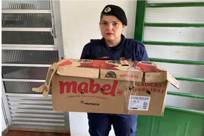
(42836) - Papagaio-verdadeiro, entrega voluntária, obeso e manso. Entregue pela Guarda Municipal de Campo Limpo Paulista no dia 23-02-2023.