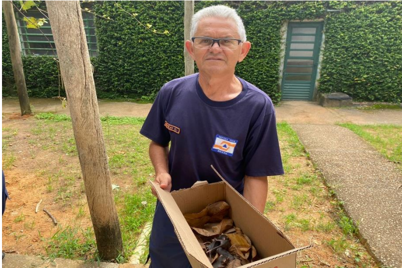
(42611 a 42614) - Gambás, filhotes, encontrados em frente à prefeitura. Entregues pela Defesa Civil de Campo Limpo Paulista no dia 10-02-2023.