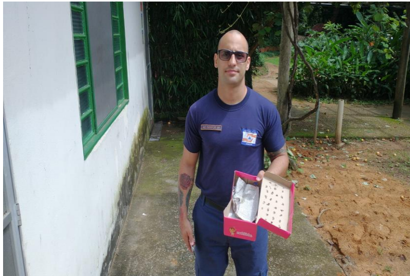
(42531) - Pardal, encontrado caído em residência com risco de ser atacado por cão. Entregue pela Defesa Civil de Campo Limpo Paulista no dia 05-02-2023.