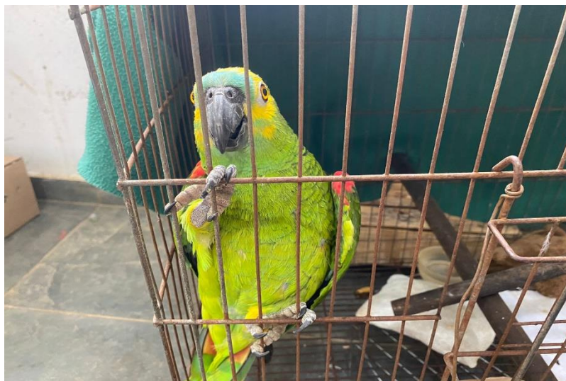
(42836) - Papagaio-verdadeiro.