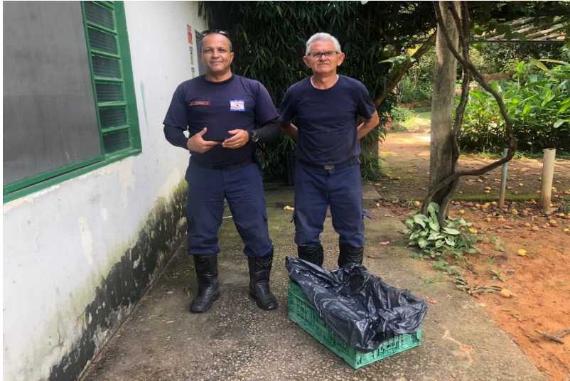
(42775 a 42781) – Gambás-de-orelha-preta, mãe com filhotes em marsúpio, vítimas de ataque de cão, sendo que a mãe apresenta lesão em região ventral. Entregues pela Defesa Civil de Campo Limpo Paulista no dia 17-02-2023.