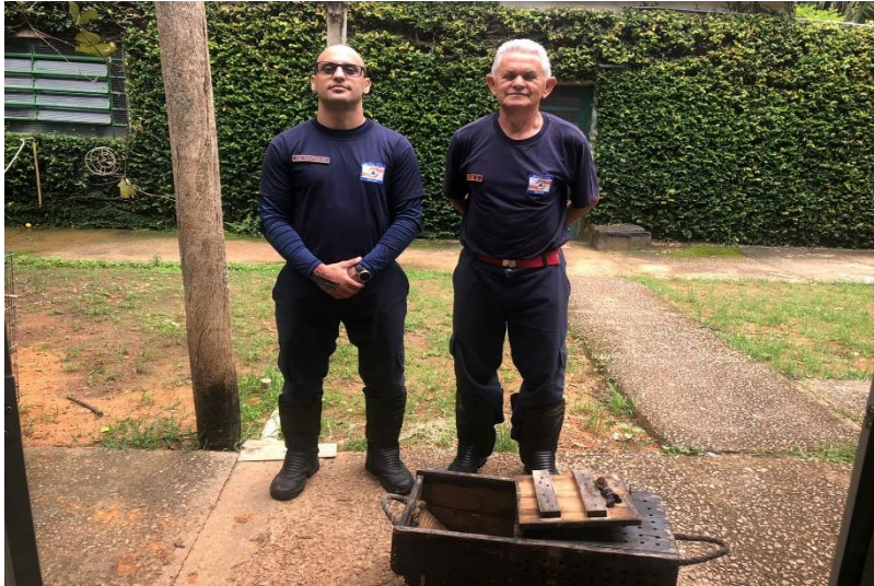
(42554 a 42556) – Gambás-de-orelha-preta, filhotes, encontrados em escola. Entregues pela Defesa Civil de Campo Limpo Paulista no dia 07-02-2023.