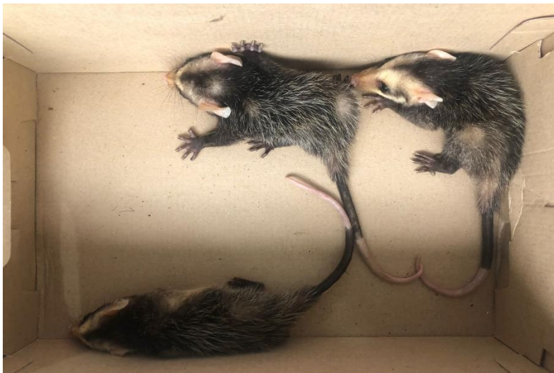
(42554 a 42556) – Gambás-de-orelha-preta.