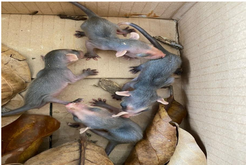
(42611 a 42614) – Gambás.