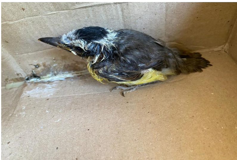
(42702) - Bem-te-vi.