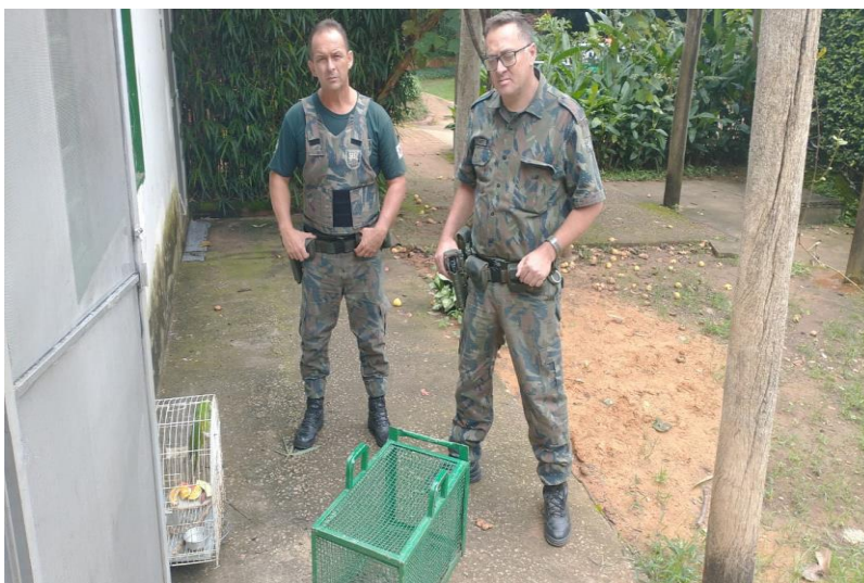
(42628) – Gambá-de-orelha-preta, encontrado em portaria de condomínio, não movimenta membro pélvico. Entregue pela Guarda Municipal de Cajamar no dia 11-02-2023.