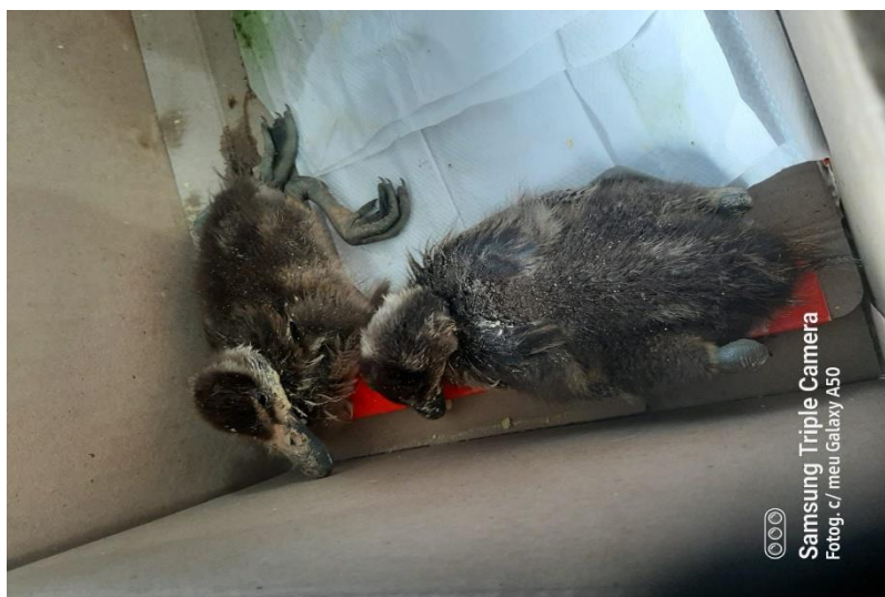
(42805 e 42806) – Marrecos.