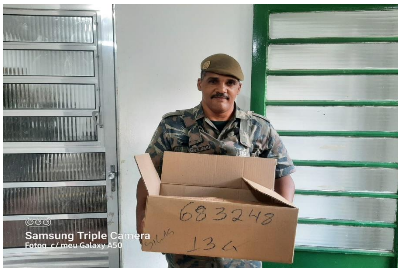
(42805 e 42806) - Marrecos, encontrados próximo a riacho, prostrados. Entrega pela Guarda Municipal de Cajamar no dia 20-02-2023.