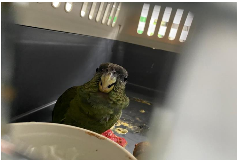
(42627) – Maitaca.