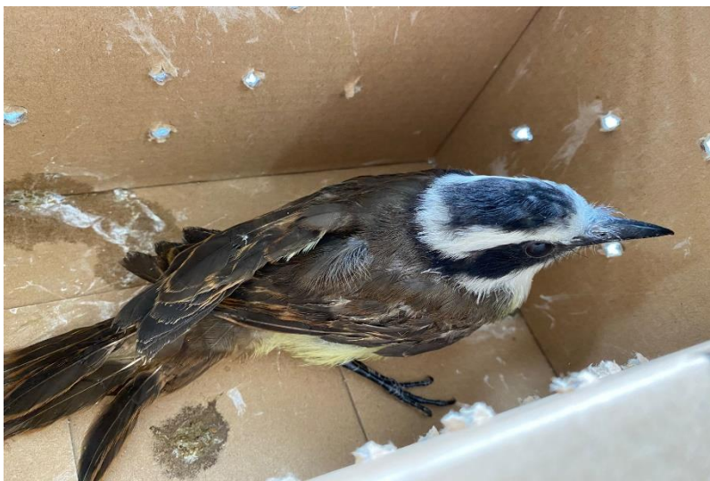
(42879) - Bem-te-vi.