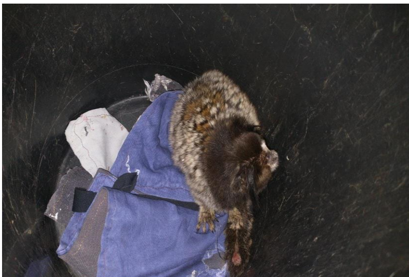
(42668) – Sagui-de-tufo-preto.