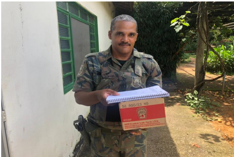
(42743) - Rolinha-roxa, colidiu com vidro. Entregue pela Guarda Municipal de Cajamar no dia 16-02-2023.