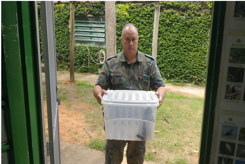
(42668) – Sagui-de-tufo-preto, atropelado, com lesão antiga em cauda. Entregue pela Guarda Municipal de Cajamar no dia 12-02-2023.