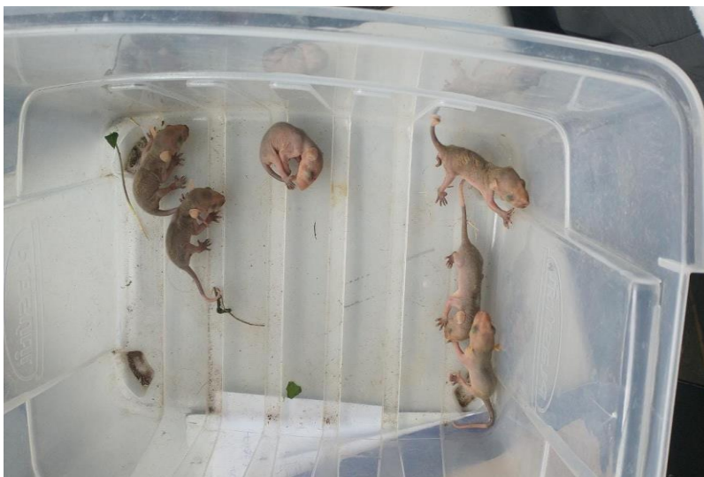
(42746 a 42751) – Gambás.