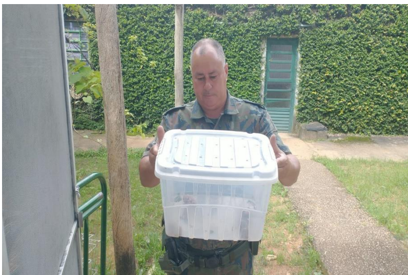
(42746 a 42751) - Gambás, filhotes, órfãos após mãe ser atacada por cão. Entregues pela Guarda Municipal de Cajamar no dia 16-02-2023.