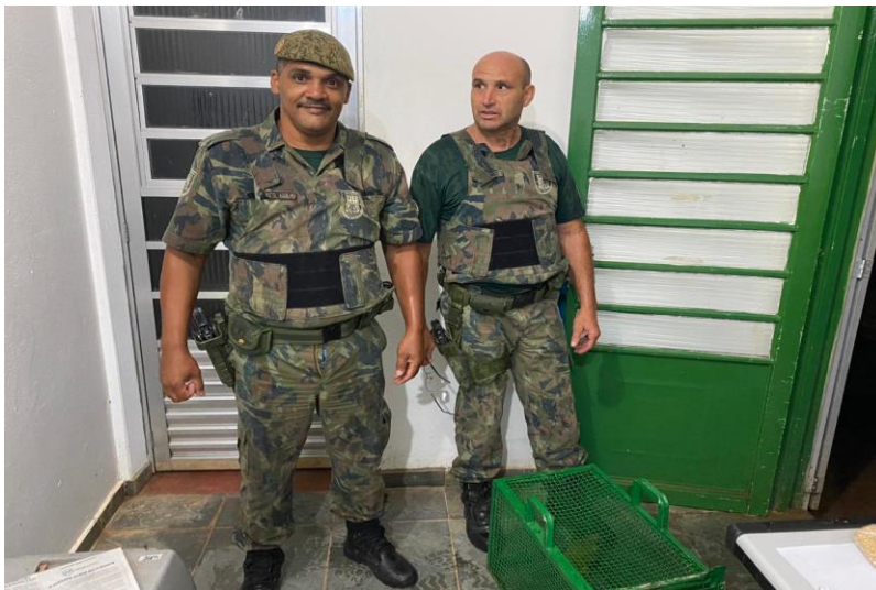
(42627) - Maitaca, jovem, colidiu com vidraça. Entregue pela Guarda Municipal de Cajamar no dia 10-02-2023.