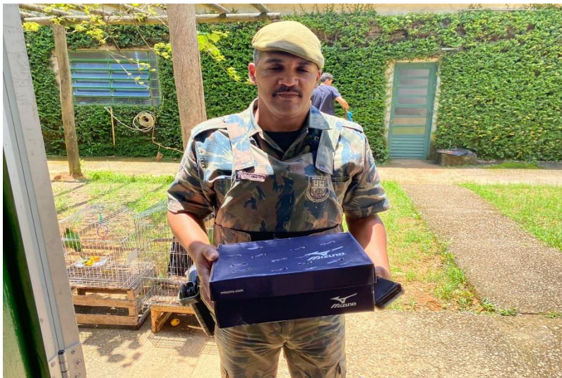
(42702) - Bem-te-vi, filhote. Entregue pela Guarda Municipal de Cajamar no dia 14-02-2023.