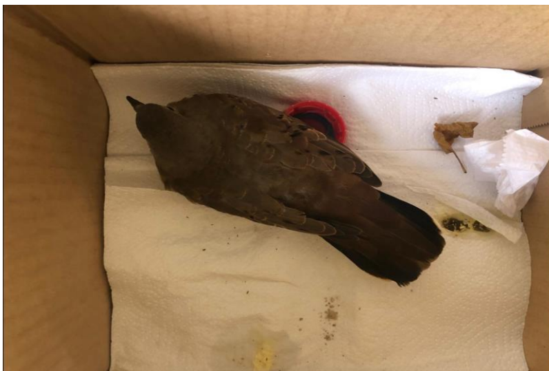
(42743) - Rolinha-roxa.