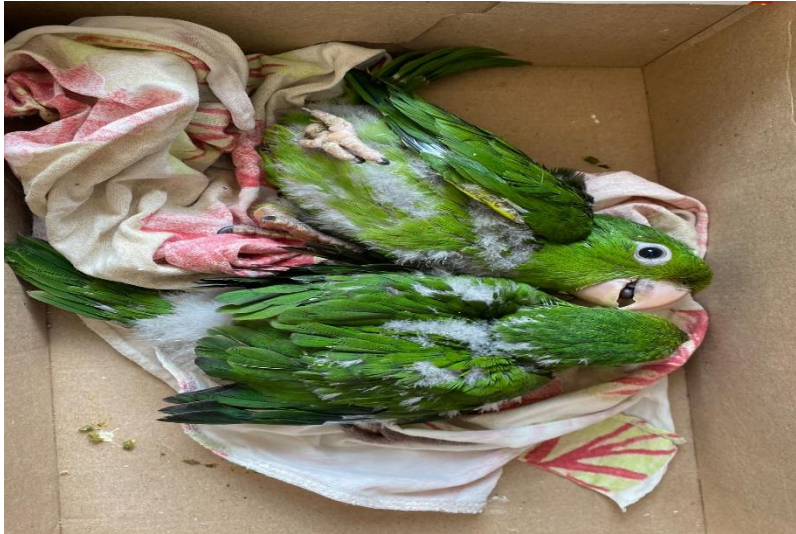
(42680 e 42681) – Maritacas.