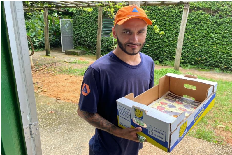
(42762 a 42764) - Maritacas, encontradas em via pública. Entregues pela Defesa Civil de Cabreúva no dia 17-02-2023.