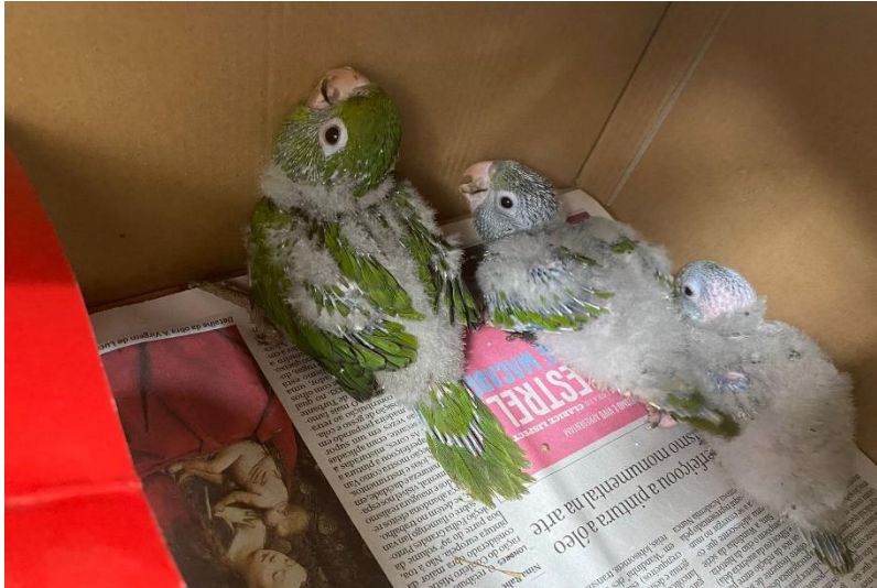
(42762 a 42764) – Maritacas.