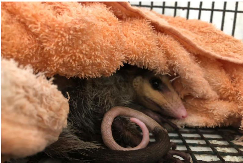
(43253) – Gambá-de-orelha-preta, apresenta sensibilidade reduzida em membro pélvico. Vindo de Bragança Paulista no dia 15-03-2023.