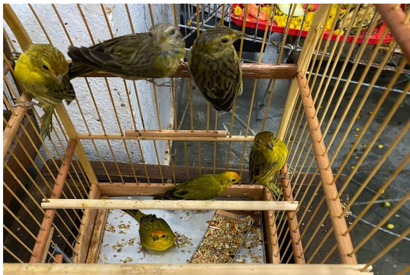
(43225 a 43230) – Canários-da-terra, entregues voluntariamente. Vindos de Bragança Paulista no dia 14-03-2023.