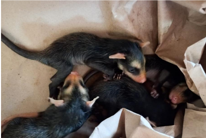
(43300 a 43304) – Gambás-de-orelhas-pretas, órfãos. Vindos de Bragança Paulista no dia 18-03-2023.