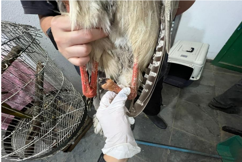
(43142) - Seriema, com fratura exposta e ausência de tarso metatarso esquerdo, e necrose ao redor da exposição óssea, caquética. Vindo de Bragança Paulista no dia 08-03-2023.