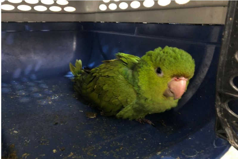
(43188) - Maritaca, jovem. Vindo de Bragança Paulista no dia 12-03-2023.