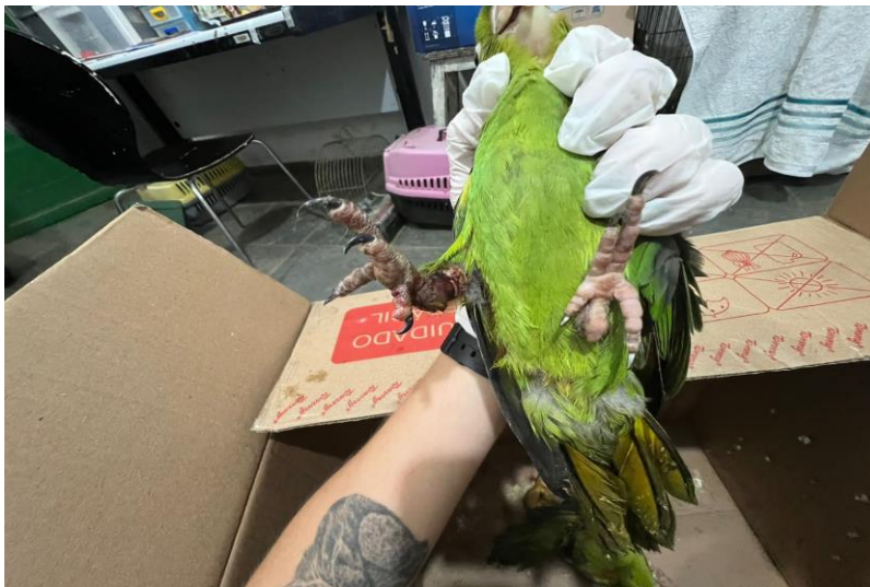
(43141) - Maritaca, apresenta membro garroteado, com necrose e odor pútrico. Vindo de Bragança Paulista no dia 08-03-2023.