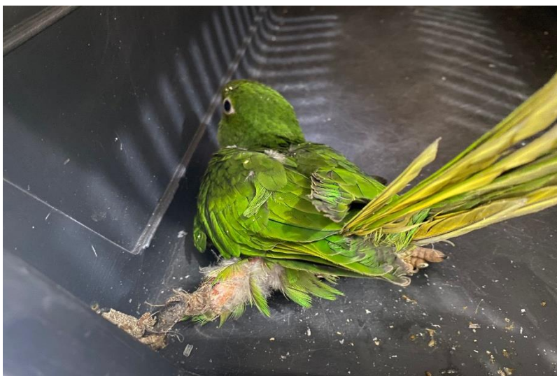
(43039) - Maritaca, jovem, caiu do forro, apresenta splay leg e garroteamento em ambos os membros pélvicos. Vindos de Bragança Paulista no dia 02-03-2023.