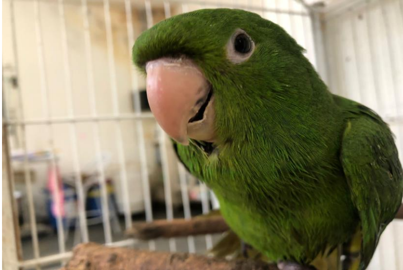
(43252) - Maritaca, caiu no quintal, apresenta mansidão. Vindo de Bragança Paulista no dia 15-03-2023.