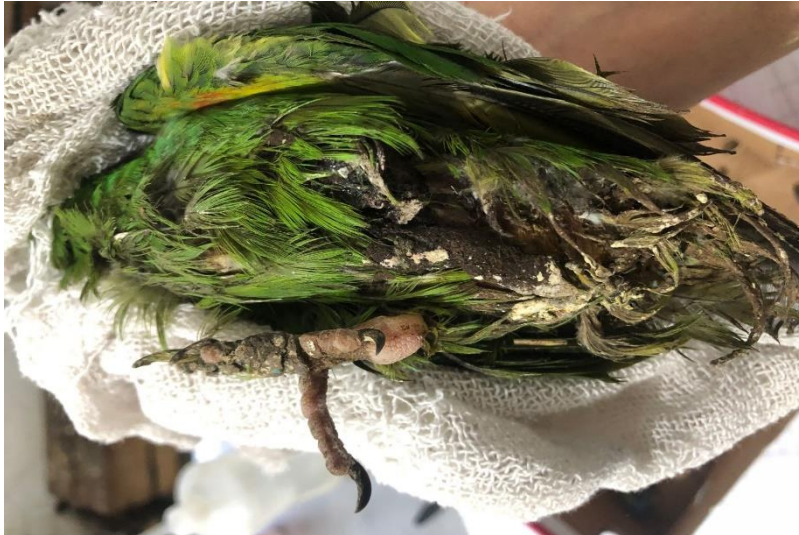
(43288) - Maritaca, apresenta membro pélvico direito amputado e crosta aderida ao ventre. Vindo de Bragança Paulista no dia 17-03-2023.