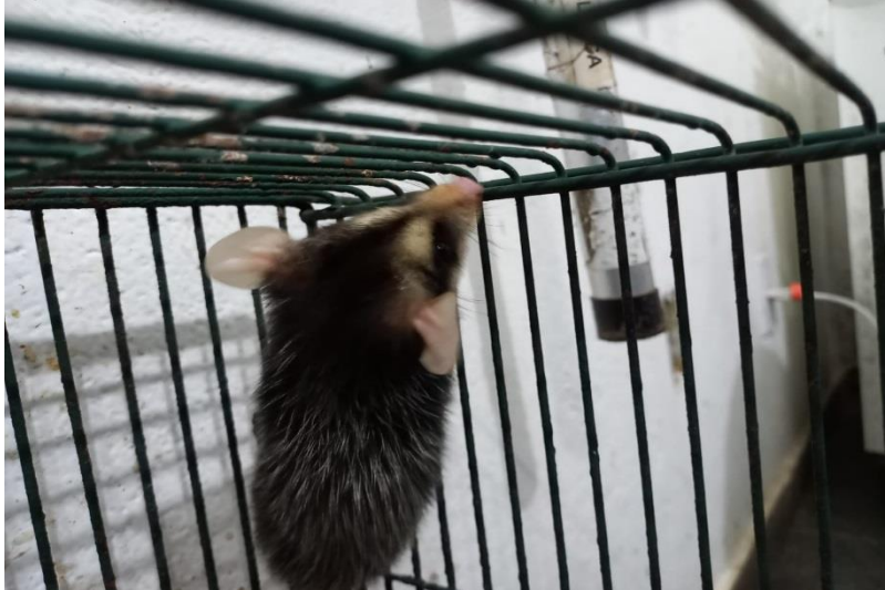
(43122) – Gambá-de-orelha-preta, fêmea, órfão. Vindo de Bragança Paulista no dia 07-03-2023.