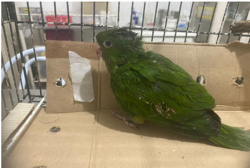
(43206) - Maritaca, jovem, encontrada caída no gramado de município. Vindo de Bragança Paulista no dia 13-03-2023.