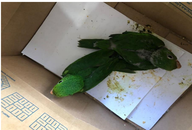
(43077 e 43078) - Maritacas, filhotes. Vindos de Bragança Paulista no dia 03-03-2023.