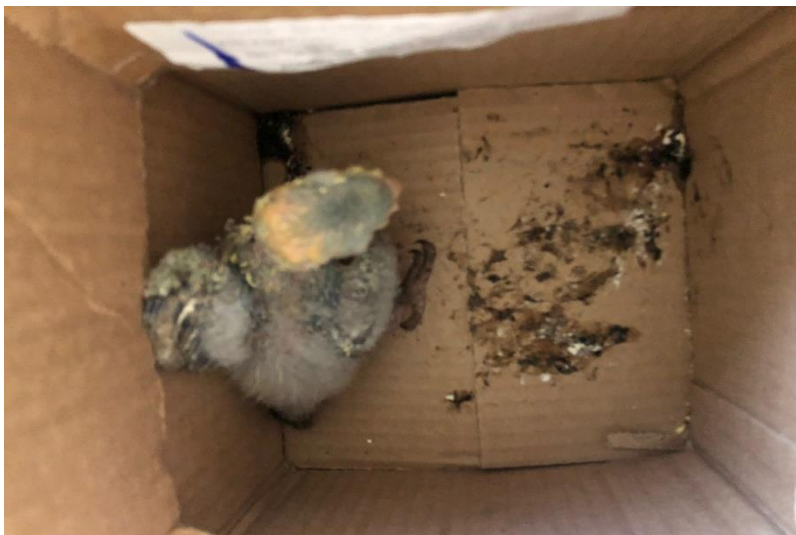
(43079) - Maritaca, filhote. Vindo de Bragança Paulista no dia 03-03-2023.