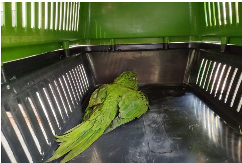
(43299) - Maritaca, apresentou convulsões logo após a entrada e veio a óbito. Vindo de Bragança Paulista no dia 18-03-2023.