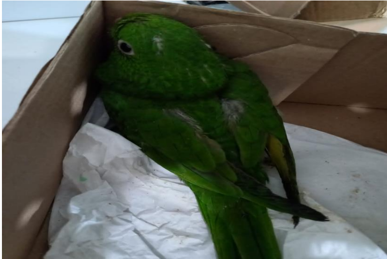
(43265) - Maritaca, apresenta linha de pipa nos pés causando garroteamento. Vindo de Bragança Paulista no dia 16-03-2023.