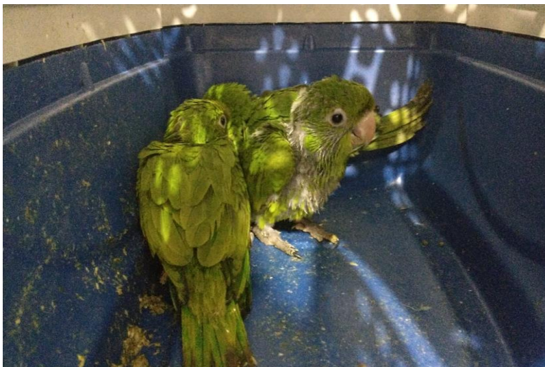
(43170 a 43172) - Maritacas, filhotes, órfãos. Vindo de Bragança Paulista no dia 10-03-2023.