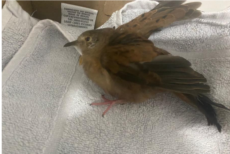
(43207) - Rolinha, jovem, magra e com ataxia. Vindo de Bragança Paulista no dia 13-03-2023.