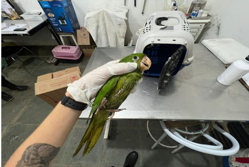
(43140) – Maritaca. Vindo de Bragança Paulista no dia 08-03-2023.