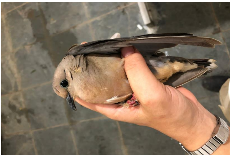
(43334) - Juriti-pupu, encontrada machucada em jardim público, apresenta fratura em úmero direito. Vindo de Bragança Paulista no dia 20-03-2023.