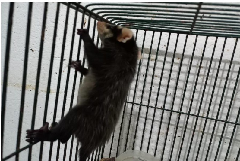
(43121) – Gambá-de-orelha-preta, macho, órfão. Vindo de Bragança Paulista no dia 07-03-2023.