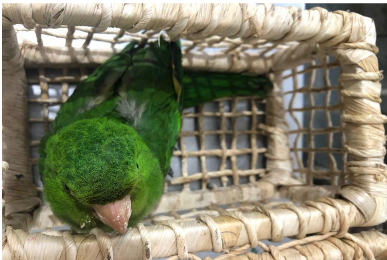
(43287) - Maritaca, apresenta membro pélvico esquerdo garroteado e edema. Vindo de Bragança Paulista no dia 17-03-2023.