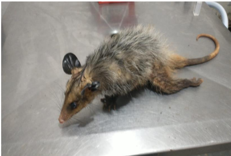
(42813) – Gambá-de-orelha-preta, com lesões características de ataque de cão, não movimentava membro pélvico. Vindo de Bragança Paulista no dia 20-02-2023.