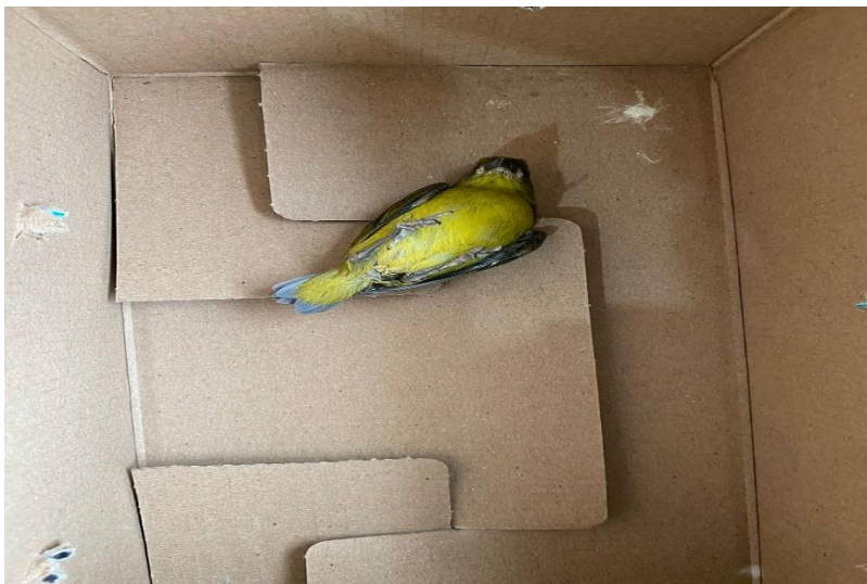
(42716) - Pintassilgo, chegou em óbito. Vindo de Bragança Paulista no dia 14-02-2023.