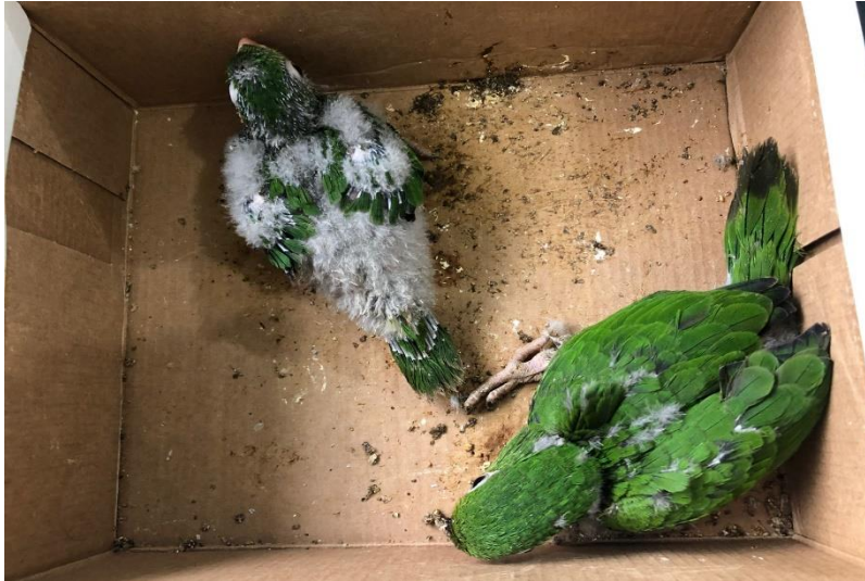
(42841 e 42842) - Maritacas, filhotes, encontrados em telhado. Vindos de Bragança Paulista no dia 23-02-2023.