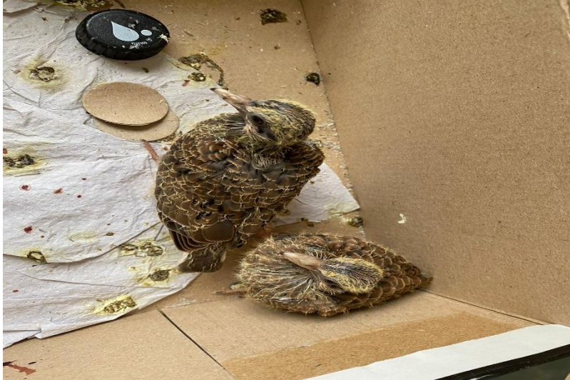
(42714 e 42715) - Avoantes, filhotes. Vindos de Bragança Paulista no dia 14-02-2023.