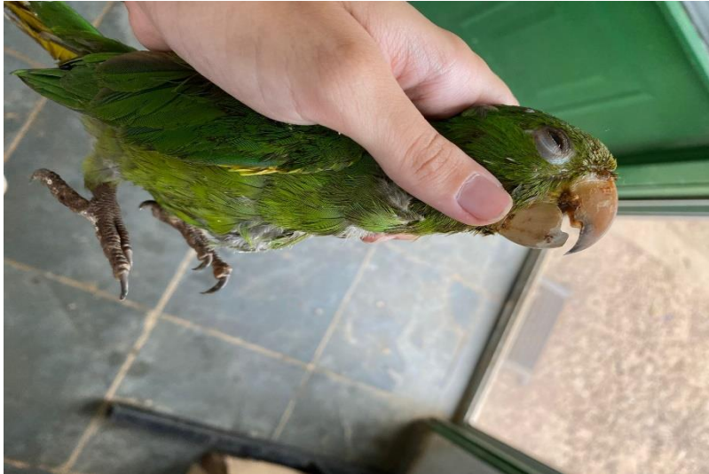
(42712) - Maritaca, atropelada, com retrizes sujas e desgastadas, e bico sujo. Vindo de Bragança Paulista no dia 14-02-2023.