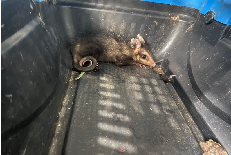
(42602) – Gambá-de-orelha-preta, encontrado em via pública. Vindo de Bragança Paulista no dia 09-02-2023.