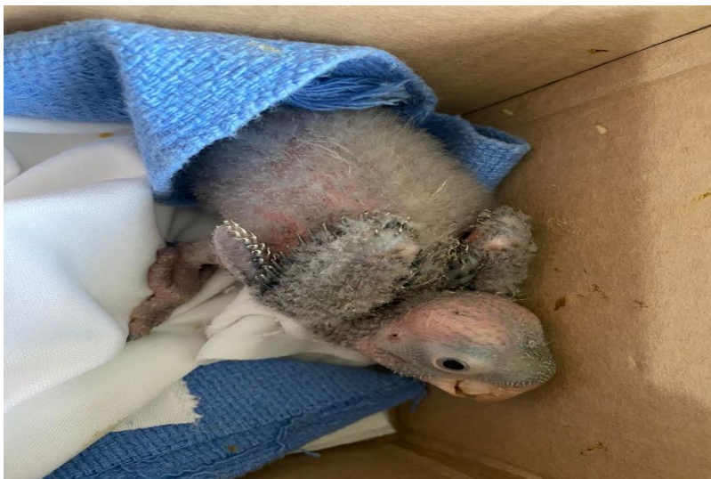
(42738) - Maritaca, filhote. Vindo de Bragança Paulista no dia 15-02-2023.