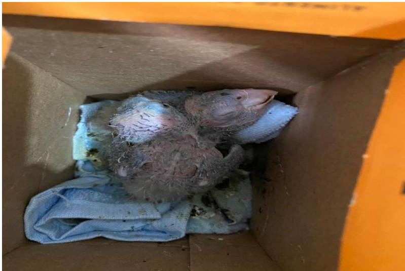
(42753 e 42754) - Maritacas, filhotes, encontradas caídas em via pública. Vindos de Bragança Paulista no dia 16-02-2023.