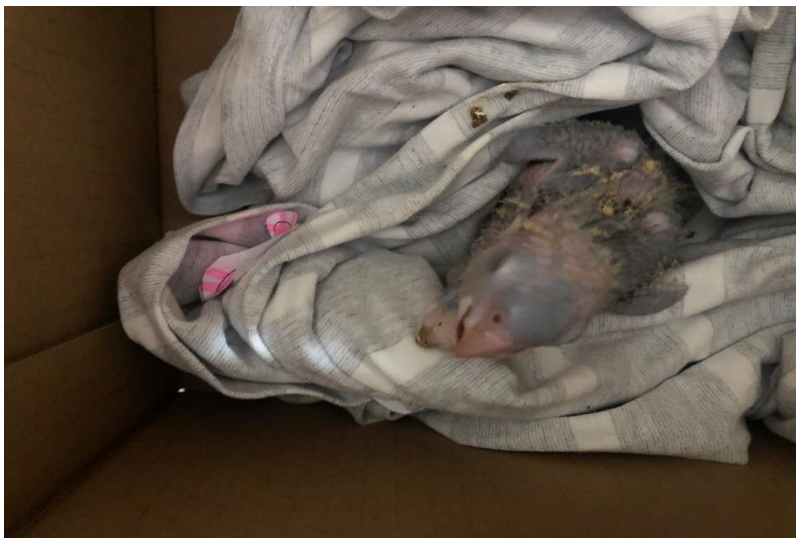
(42559 e 42560) - Maritacas, filhotes. Vindos de Bragança Paulista no dia 07-02-2023.