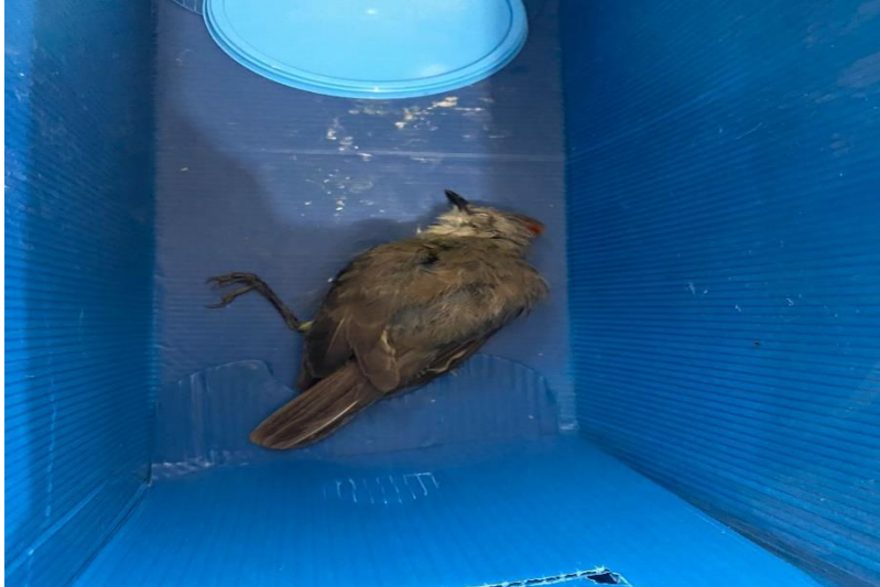
(42739) - Suiriri, com membro pélvico direito com fratura cominutiva de fêmur e fratura exposta de tibiotarso com osso necrosado, chegou em óbito. Vindo de Bragança Paulista no dia 15-02-2023.