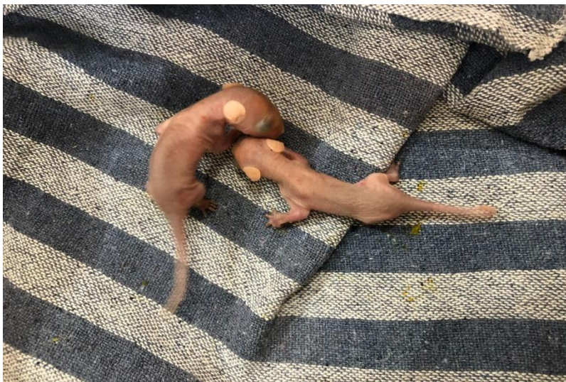
(42839 e 42840) - Gambás, filhotes, subdesenvolvidos, encontrados em frente ao canil municipal. Vindos de Bragança Paulista no dia 23-02-2023.