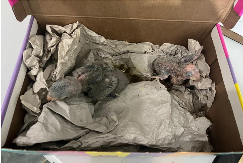
(42831 e 42832) - Maritacas, filhotes. Vindos de Bragança Paulista no dia 22-02-2023.