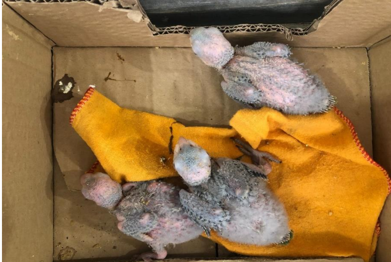
(42561 a 42563) - Maritacas, filhotes. Vindos de Bragança Paulista no dia 07-02-2023.