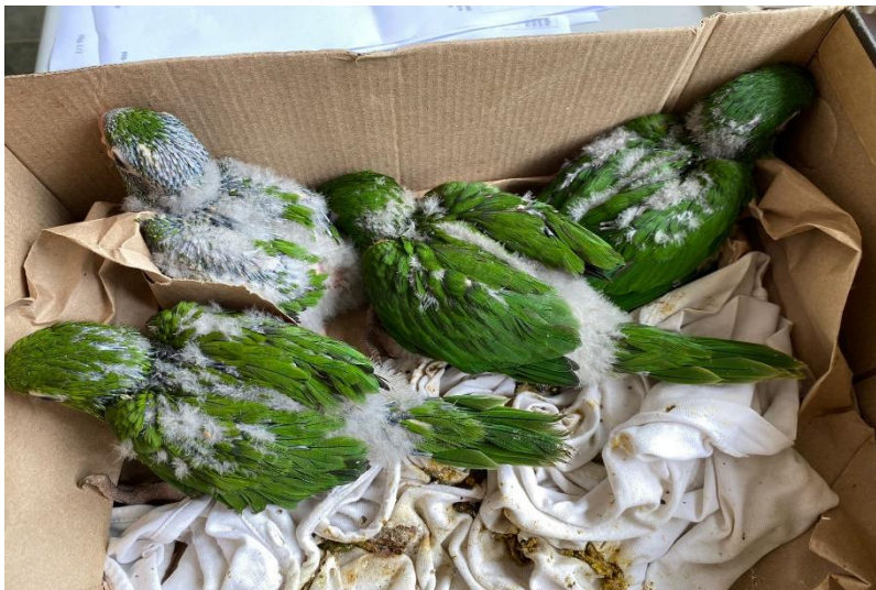
(42874 a 42878) - Maritacas, filhotes. Vindos de Bragança Paulista no dia 26-02-2023.