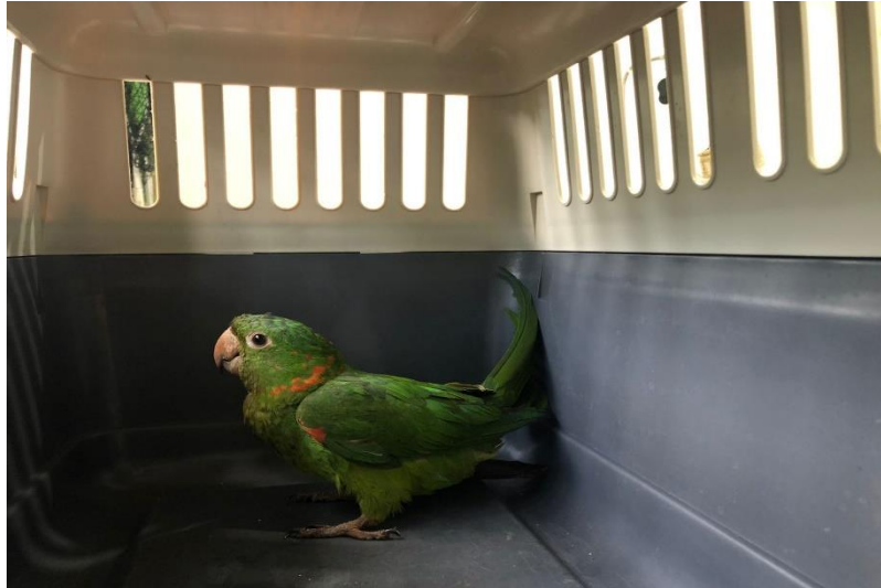
(42587) - Maritaca, caiu no quintal, apresenta fratura exposta em asa direita. Vindo de Bragança Paulista no dia 08-02-2023.