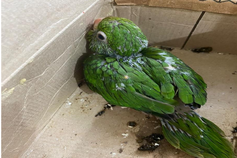
(42737) - Maritaca, filhote. Vindo de Bragança Paulista no dia 15-02-2023.