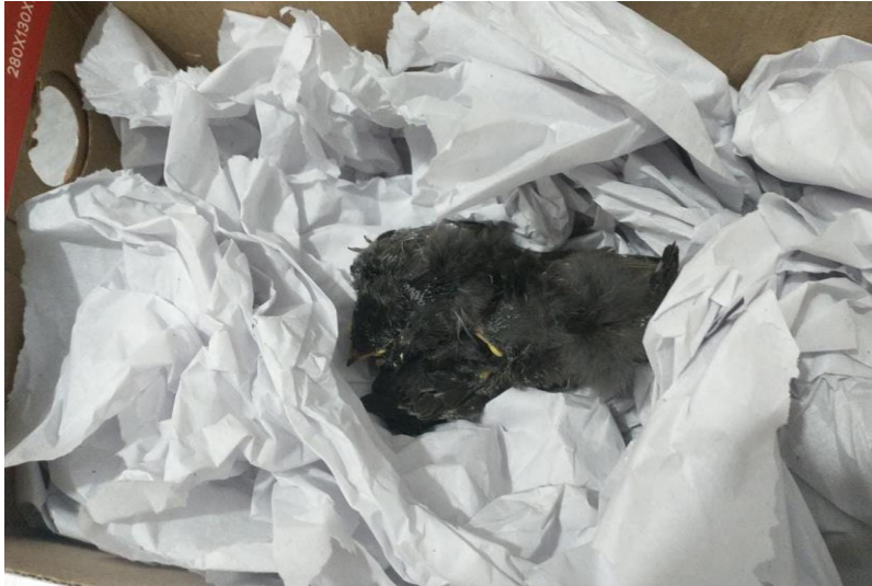
(42810 a 42812) - Andorinhas-pequenas-de-casa, filhotes, órfãos. Vindos de Bragança Paulista no dia 20-02-2023.