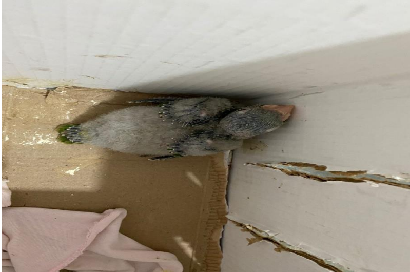
(42713) - Maritaca, filhote. Vindo de Bragança Paulista no dia 14-02-2023.