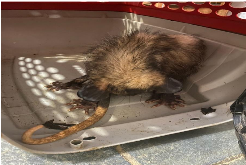
(42476) – Gambá-de-orelha-preta, idoso, magro, com cegueira e confusão mental, encontrada desorientado em via pública. Vindo de Bragança Paulista no dia 02-02-2023.