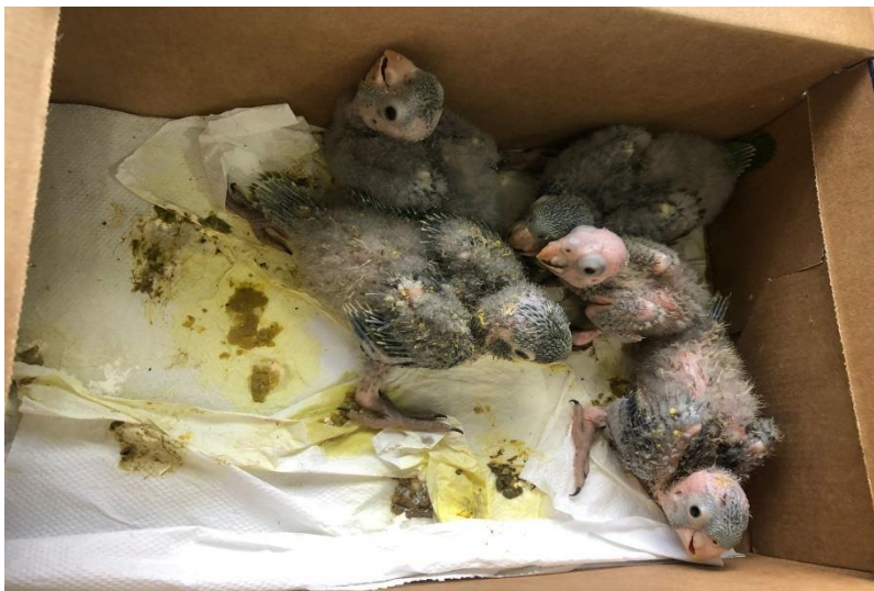
(42582 a 42586) - Maritacas, filhotes. Vindos de Bragança Paulista no dia 08-02-2023.