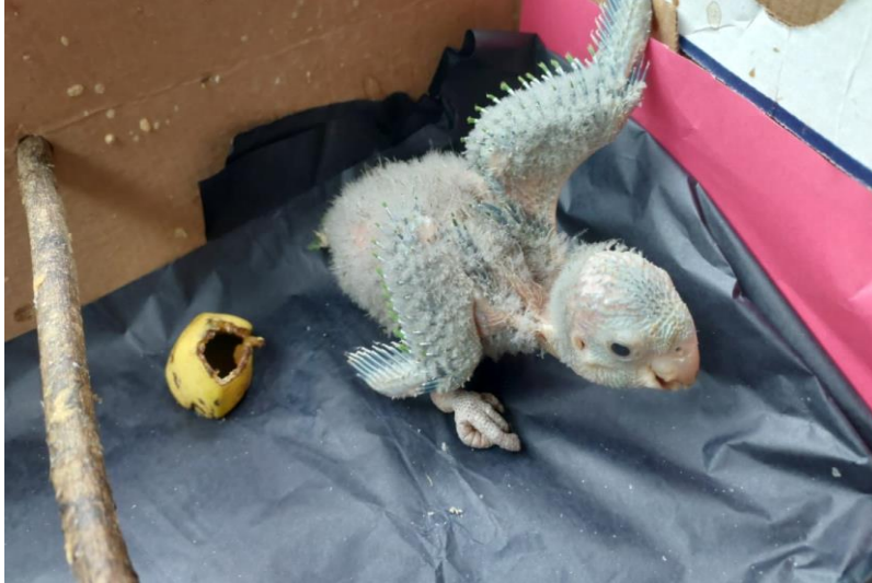
(42545) - Maritaca, órfão. Vindo de Bragança Paulista no dia 06-02-2023.