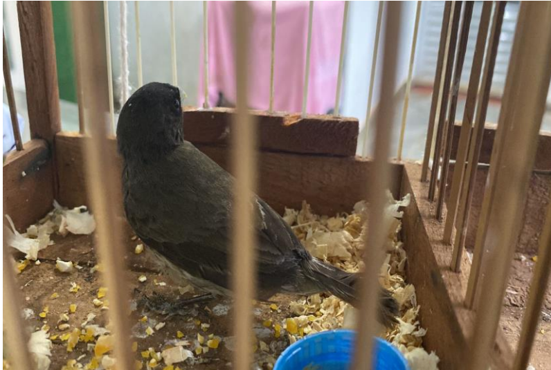
(42866) - Papa-capim, encontrado em rodovia próximo à caminhão. Vindo de Bragança Paulista no dia 24-02-2023.