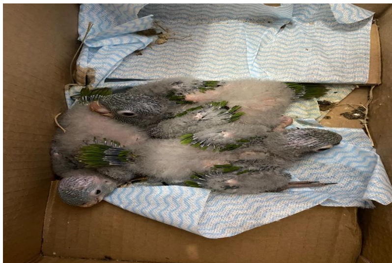
(42599 a 42601) - Maritacas, filhotes. Vindos de Bragança Paulista no dia 09-02-2023.