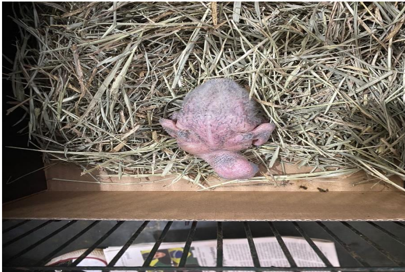
(42475) - Maritaca, caiu do ninho. Vindo de Bragança Paulista no dia 02-02-2023.