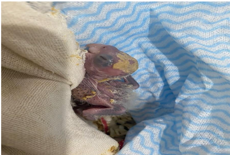
(42865) - Maritaca, filhote, caiu do ninho. Vindo de Bragança Paulista no dia 24-02-2023.