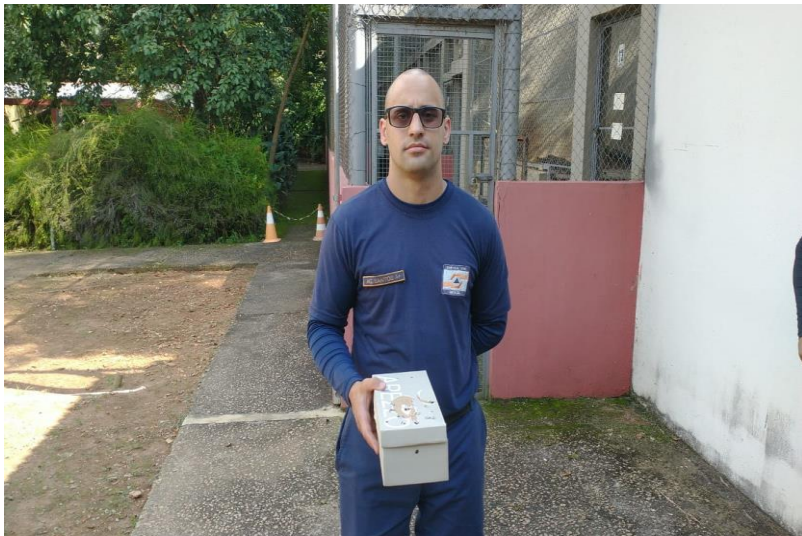
(42248) - Pardal, filhote, encontrado em quintal. Entregue pela Defesa Civil de Campo Limpo Paulista no dia 18-01-23.