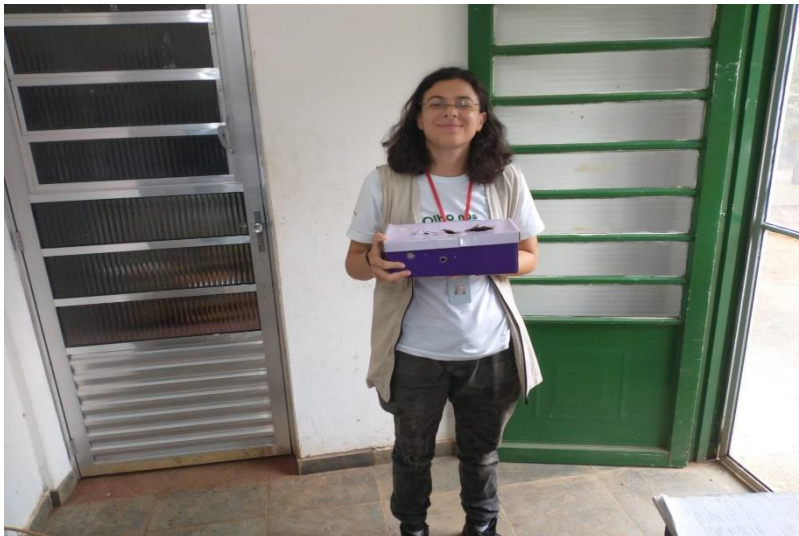
(42273) – Corruíra, vítima de ataque de animal doméstico. Entrega por munícipe de Campo Limpo Paulista no dia 21-01-23.