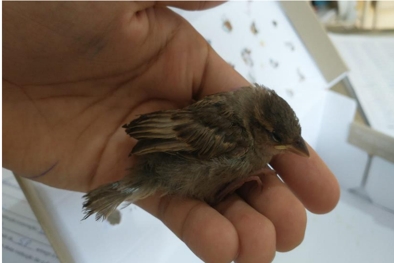
(42248) – Pardal.