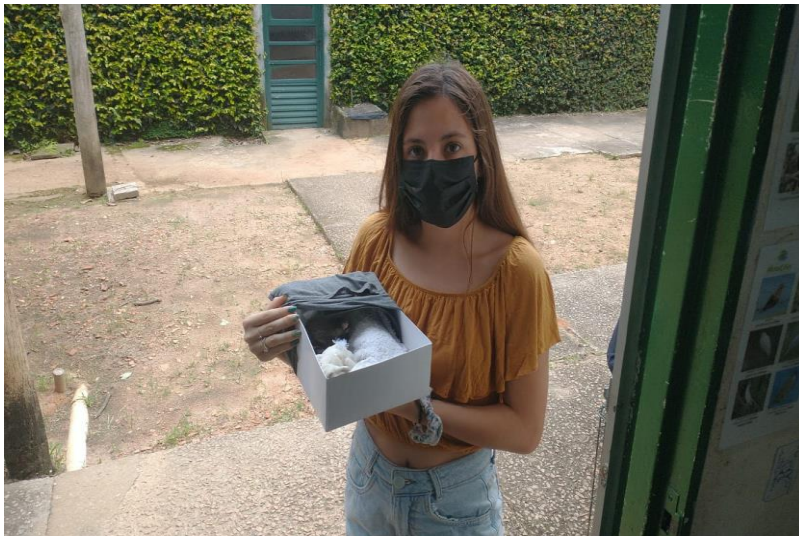
(42324) – Gambá, filhote, encontrado em quintal. Entregue por munícipe de Campo Limpo Paulista no dia 23-01-23.