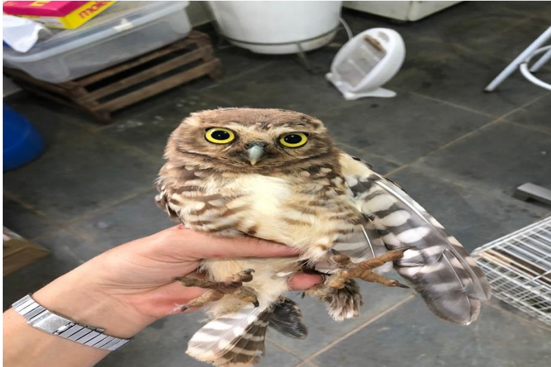
(42223) - Coruja-buraqueira.