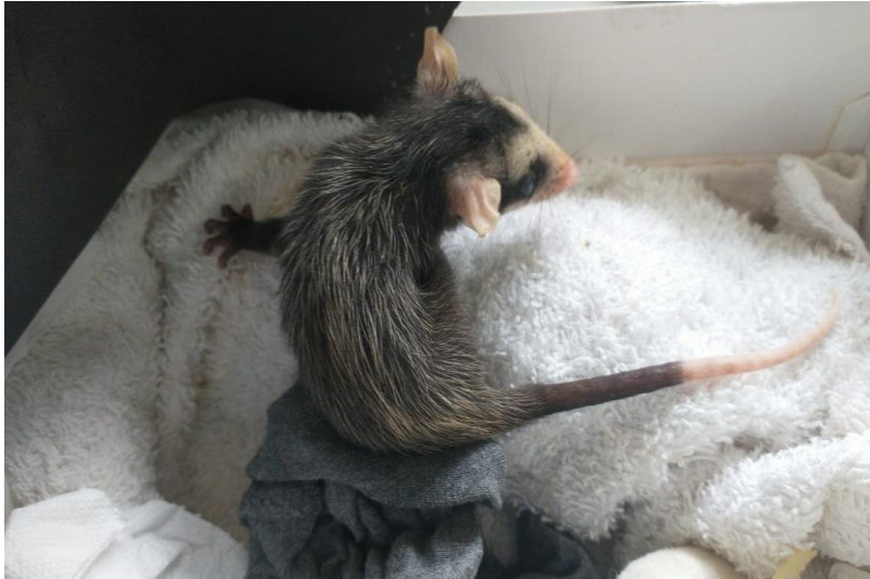
(42324) – Gambá.