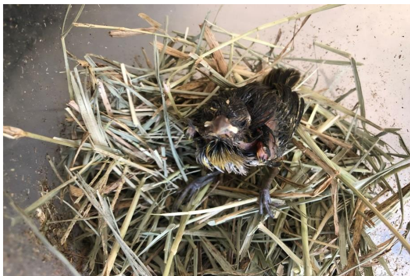
(42424) – Canarinho-da-terra.