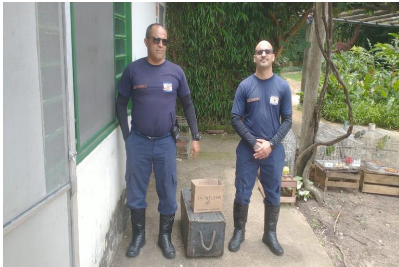
(41969 a 41972) – Gambás-de-orelha-preta, encontrados em via pública. Entregues pela Defesa Civil de Campo Limpo Paulista no dia 03-01-23.