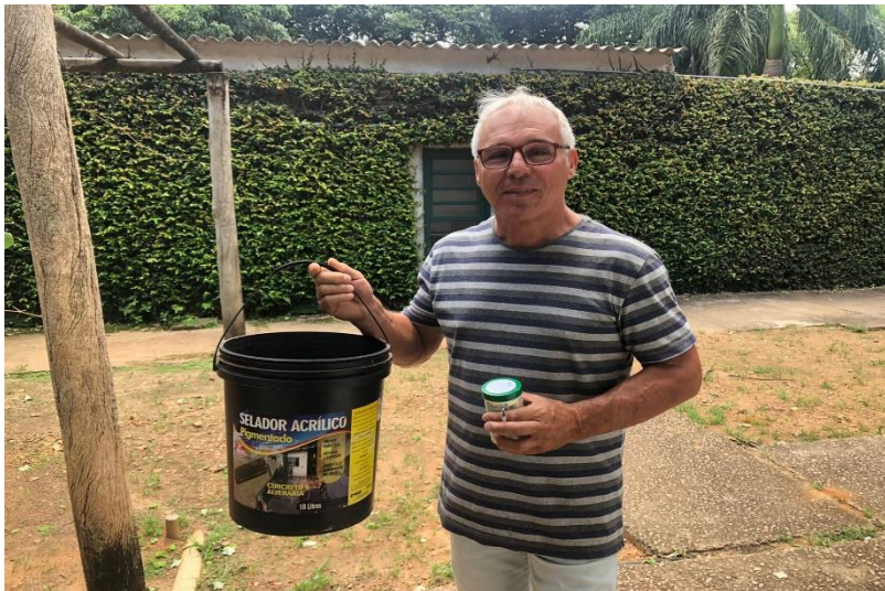
(42424) – Canarinho-da-terra, filhote, encontrado em residência. Entregue por município de Campo Limpo Paulista no dia 29-01-23.