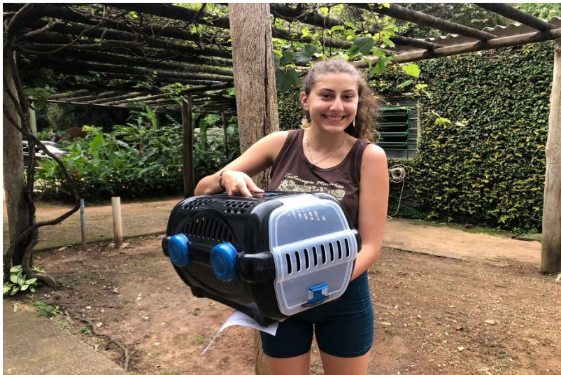
(42223) - Coruja-buraqueira, encontrada em quintal, sem lesões. Entregue por município de Campo Limpo Paulista no dia 17-01-23.