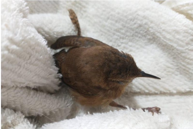
(42273) – Corruíra.