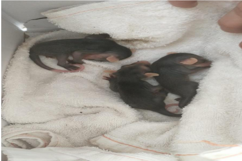
(41970 a 41972) – Gambás-de-orelha-preta, filhotes.