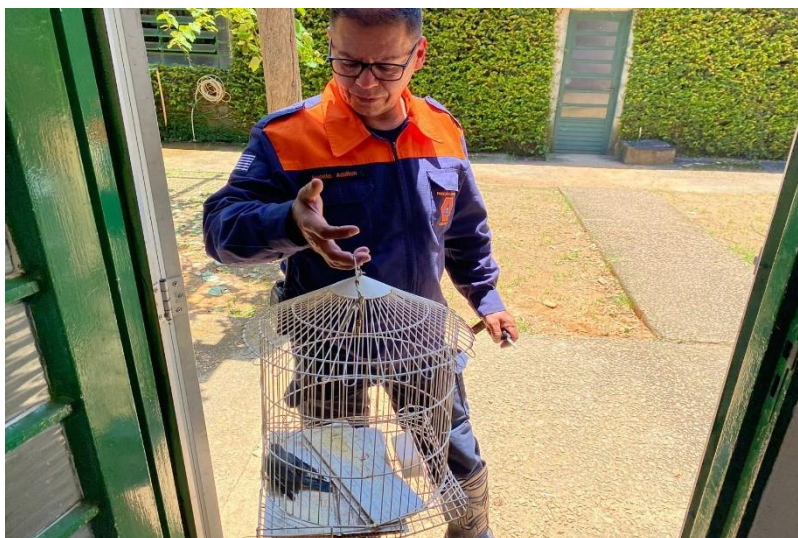
(42391) – Sanhaço-cinzento, adulto, vítima de ataque de animal doméstico. Entregue pela Prefeitura de Cabreúva no dia 27-01-23.