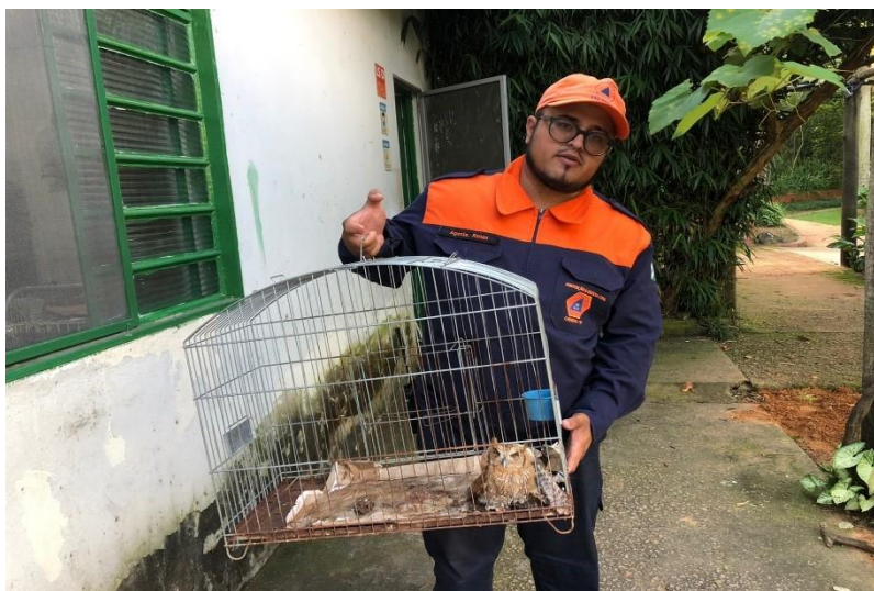
(42384) – Corujinha-do-mato, caiu da árvore e apresenta fratura em região próxima a úmero esquerdo. Entregue pela Defesa Civil de Cabreúva no dia 25-01-23.