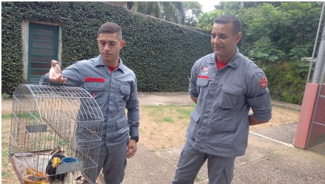
(42078) – Tucano-toco, filhote, encontrado próximo a residência de munícipe. Entregue pelos bombeiros de Cabreúva no dia 09-01-23.