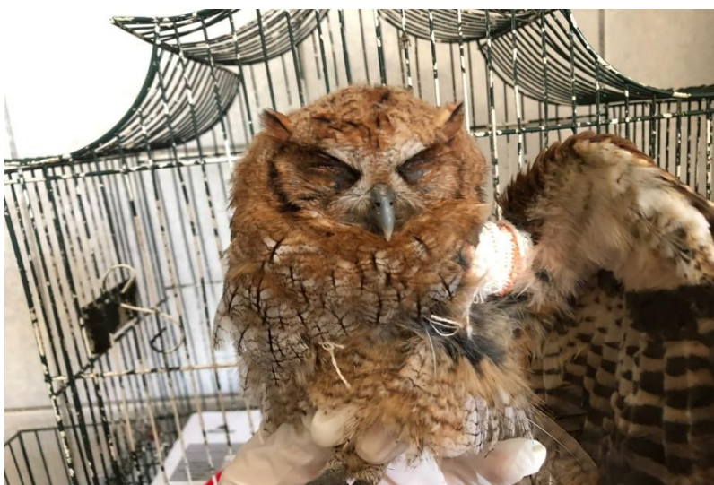
(42384) – Corujinha-do-mato.