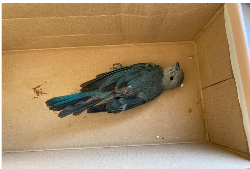
(42391) – Sanhaço-cinzento.