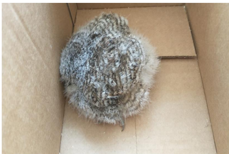
(40996) – Coruja-do-mato.