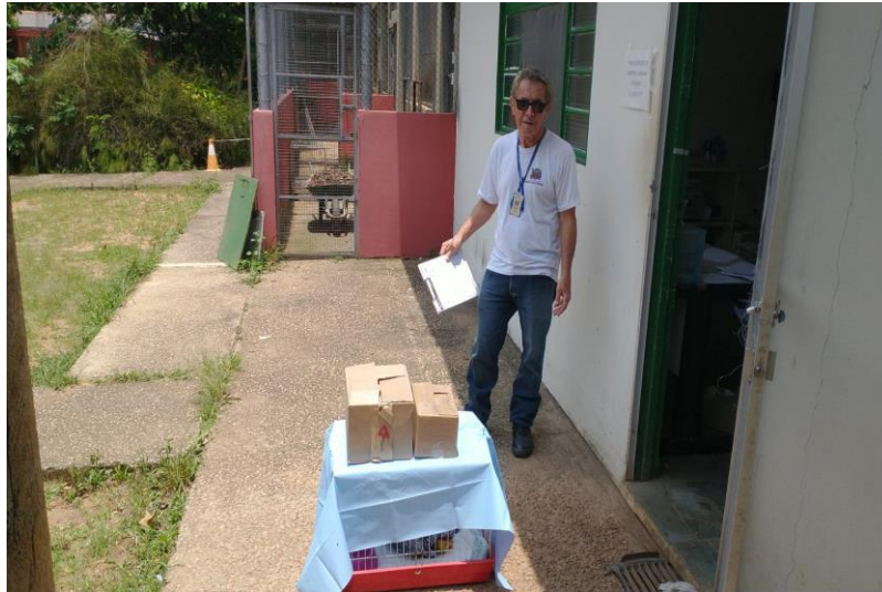
(40994) - Sagui-da-serra-escura e (40995 e 40996) Corujas-do-mato, filhotes. Entregues pela Prefeitura de Mogi das Cruzes no dia 11-11-22.