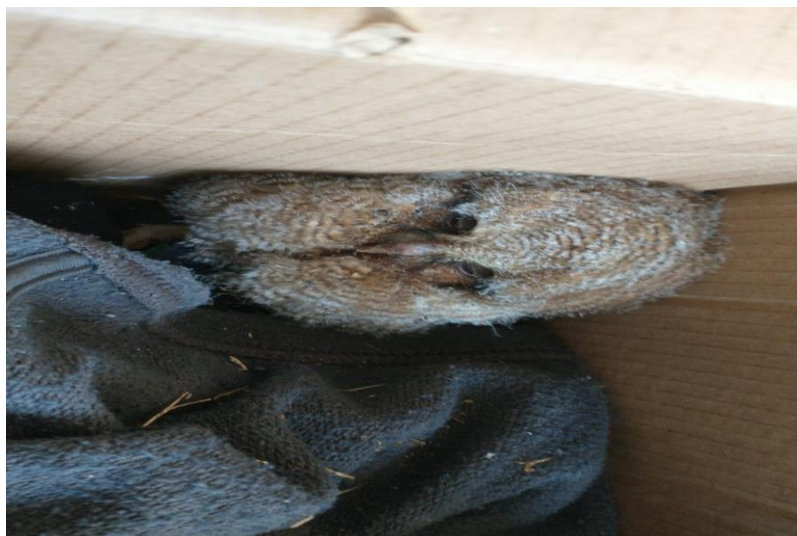
(40995) – Coruja-do-mato.