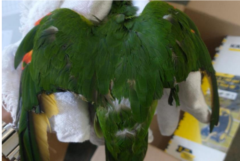
(41669) – Maritaca.