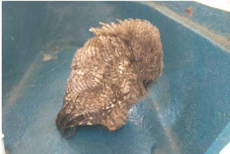
(41802) – Coruja-do-mato.