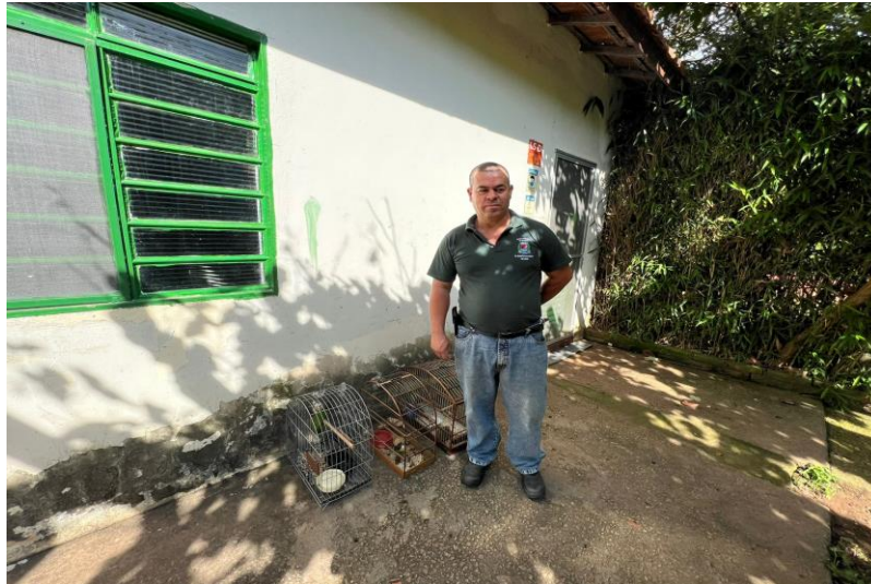
(41464) - Maritaca, caiu de árvore; (41465) - Bem-te-vi, caiu de árvore; e (41466) - Corujinha-do-mato, encontrada na rua. Todos entregues pela Prefeitura de Indaiatuba no dia 02-12-22.