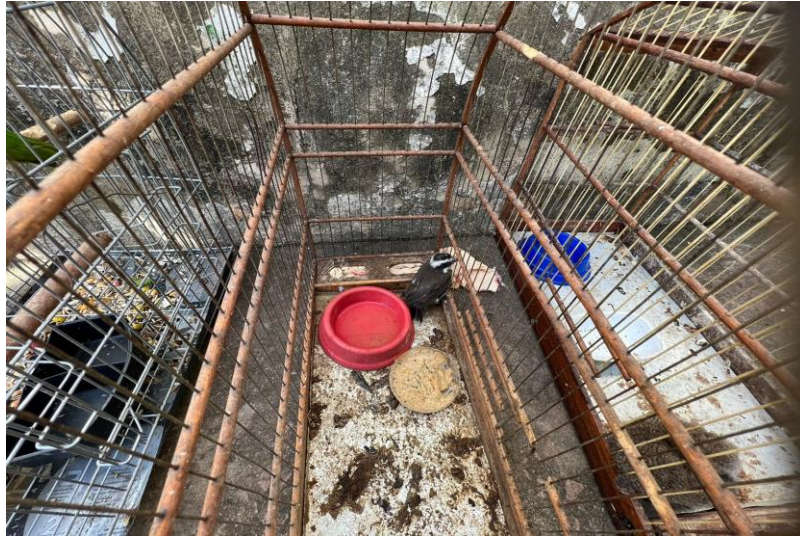
(41465) - Bem-te-vi.