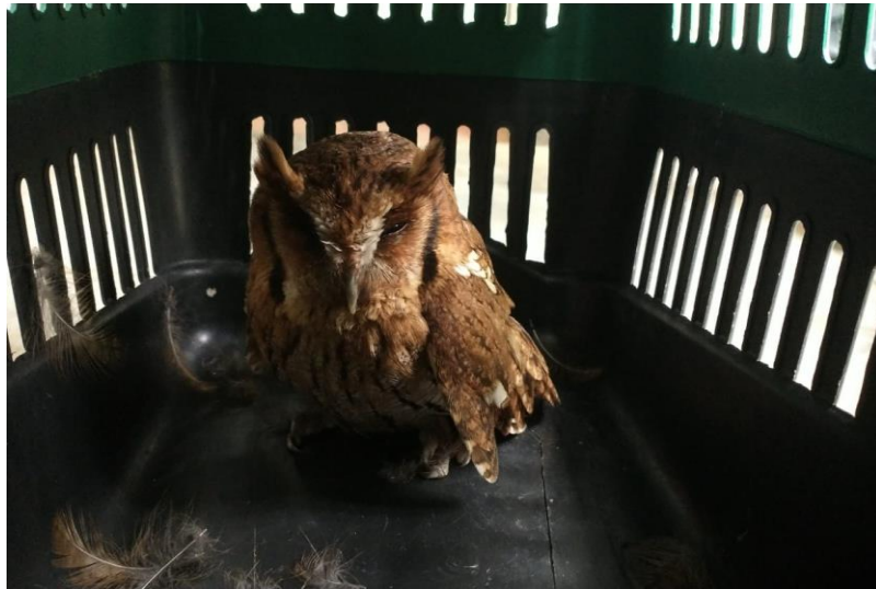
(41549) – Corujinha-do-mato.