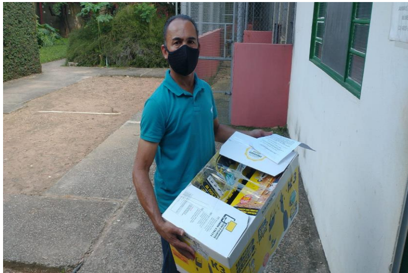
(41669) – Maritaca, sem histórico, apresenta as asas cortadas. Entregue pela Prefeitura de Indaiatuba no dia 16-12-22.