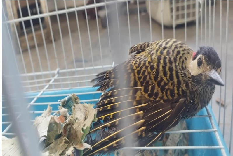
(41710) - Pica-pau-verde-do-barrado.