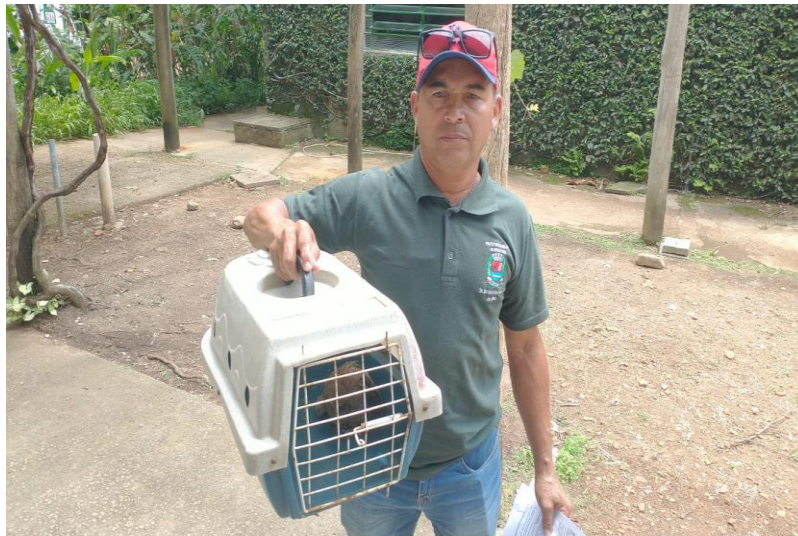
(41802) – Coruja-do-mato, encontrada ferida e entregue pela Prefeitura de Indaiatuba no dia 26-12-22.