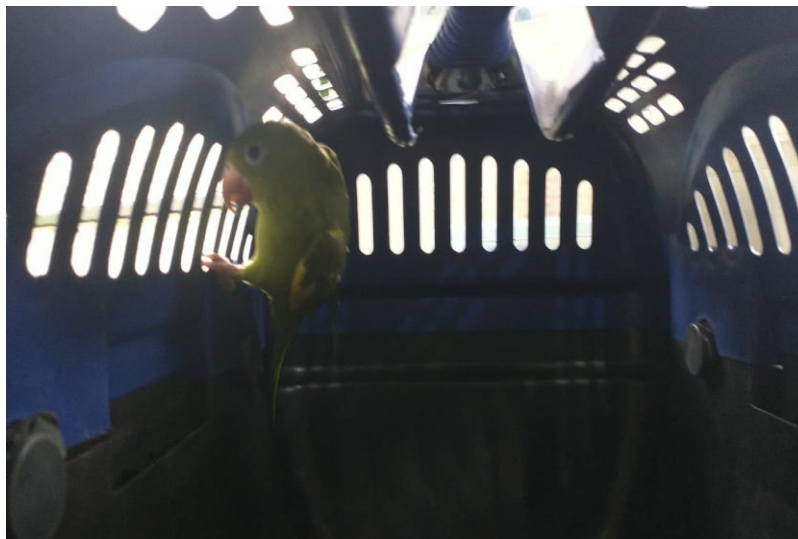
(41548) – Periquito-do-encontro-amarelo.