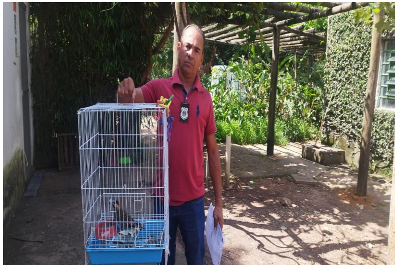
(41710) - Pica-pau-verde-do-barrado, encontrado caído em praça e entregue pela Secretaria de Gestão Ambiental de Indaiatuba no dia 20-12-22.