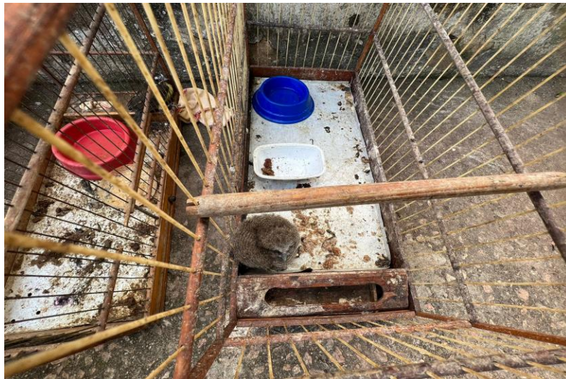
(41466) - Corujinha-do-mato.