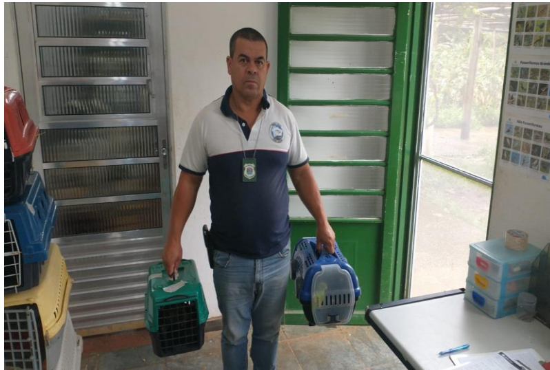
(41548) – Periquito-do-encontro-amarelo, com asas cortadas; e (41549) – Corujinha-do-mato, com fratura exposta em asa esquerda. Ambos entregues pela Prefeitura de Indaiatuba no dia 07-12-22.