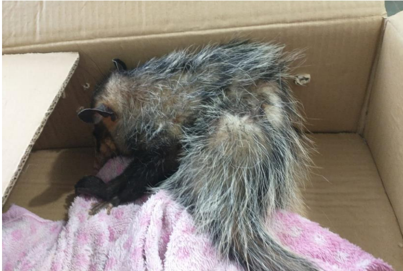
(41511) – Gambá-de-orelha-preta, com coluna fraturada, vindo de Bragança Paulista no dia 04-12-22.