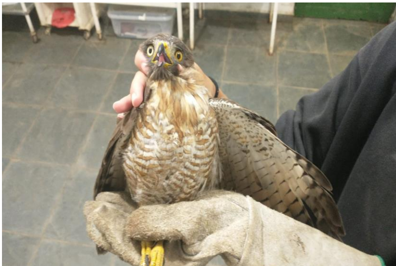
(41791) – Gavião-carijó, vindo de Bragança Paulista no dia 24-12-22.