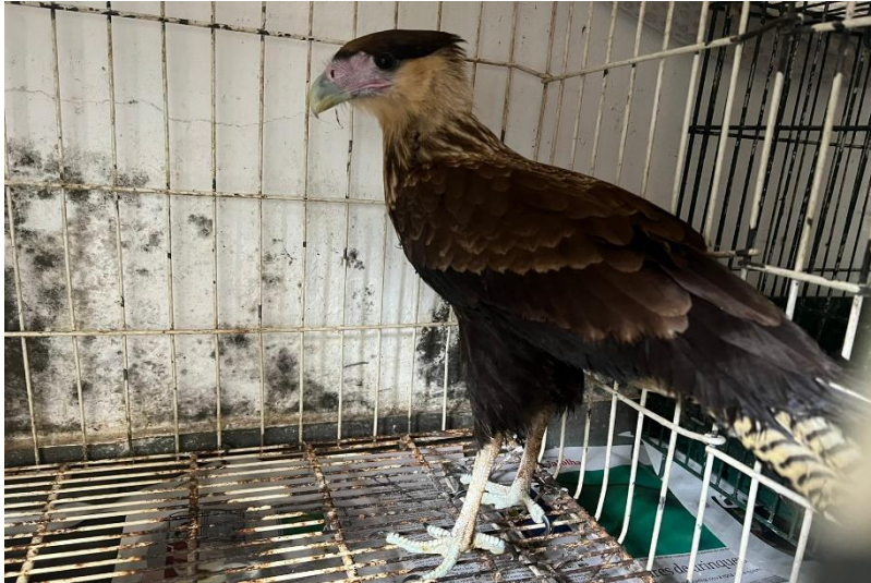
(41685) – Carcará, vindo de Bragança Paulista no dia 18-12-22.