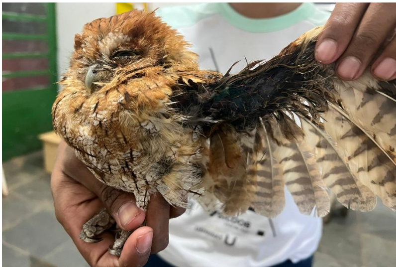
(41684) – Coruja-do-mato, vinda de Bragança Paulista no dia 18-12-22.