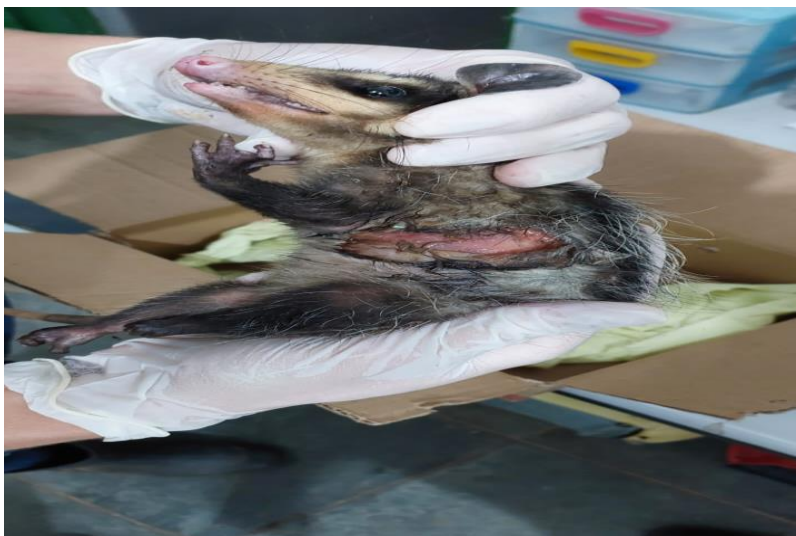
(41485) – Gambá-de-orelha-preta, ferido, vindo de Bragança Paulista no dia 02-12-22.