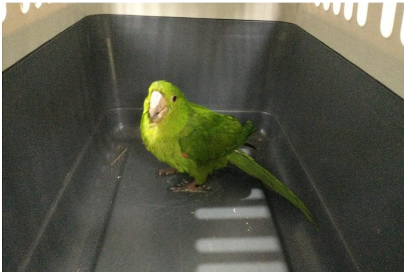
(41515) – Maritaca, colidiu com vidro, vinda de Bragança Paulista no dia 05-12-22.