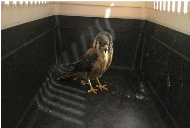
(41512) – Quiri-quiri, com asas cortadas, vindo de Bragança Paulista no dia 04-12-22.