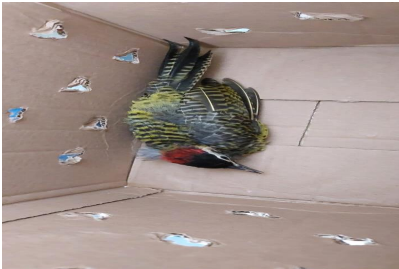
(41484) – Pica-pau-verde-do-barrado, vindo de Bragança Paulista no dia 02-12-22.