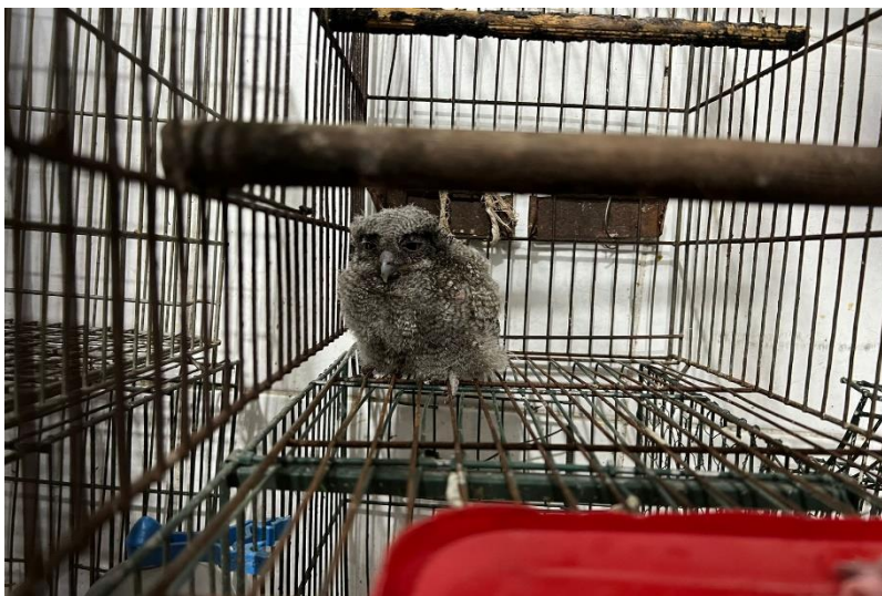
(41607) – Coruja-do-mato, vinda de Bragança Paulista no dia 12-12-22.