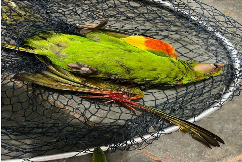
(41608) – Maritaca.