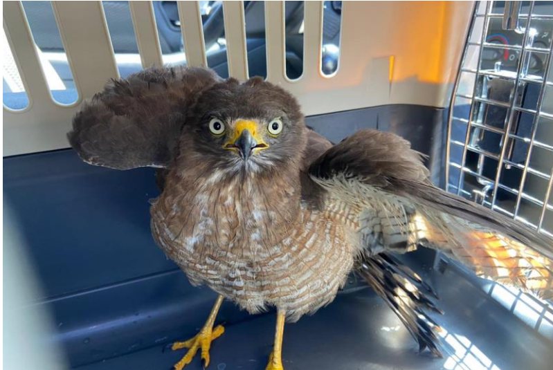
(41557) – Gavião-carijó, vindo de Bragança Paulista no dia 08-12-22.