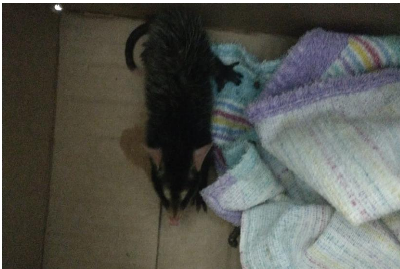
(41792) – Gambá, filhote, vindo de Bragança Paulista no dia 24-12-22.