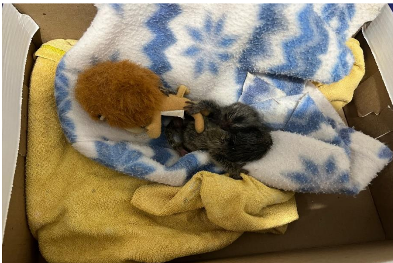
(41714 e 41715) – Saguis, vindos de Bragança Paulista no dia 20-12-22.