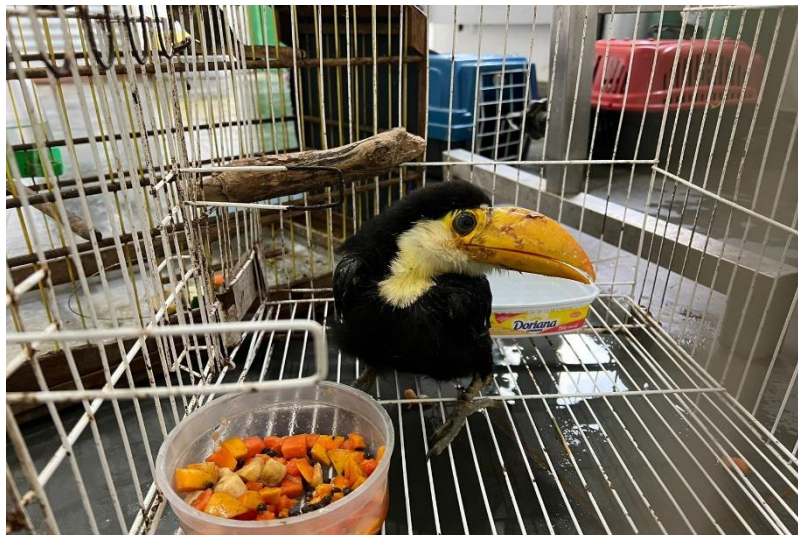
(41477) – Tucano-toco, filhote, vindo de Bragança Paulista no dia 02-12-22.