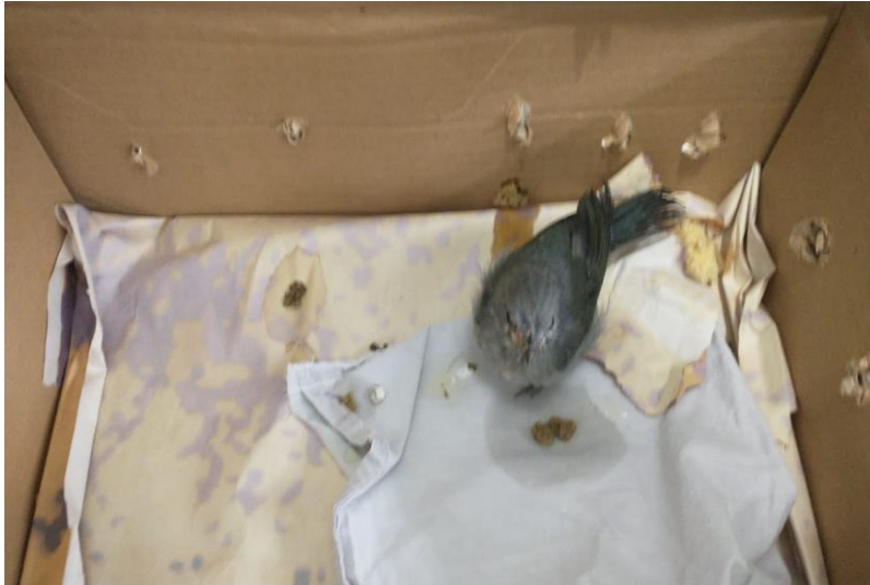
(41520) – Sanhaço-cinzento, sem voar, vindo de Bragança Paulista no dia 05-12-22.