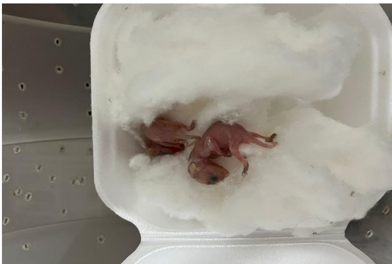
(41604 e 41605) – Gambás, órfãos, vindos de Bragança Paulista no dia 12-12-22.