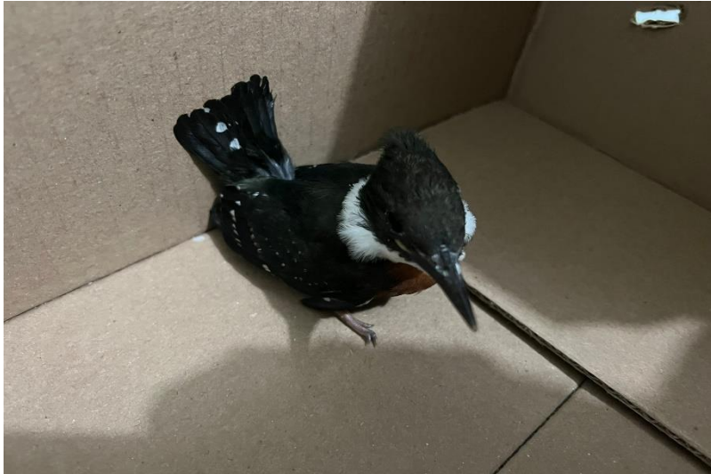
(41716) – Martim-pescador, vindo de Bragança Paulista no dia 20-12-22.