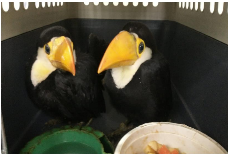
(41521 e 41522) – Tucanos-toco, órfãos, vindos de Bragança Paulista no dia 05-12-22.