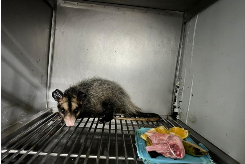
(41606) – Gambá-de-orelha-preta, vindo de Bragança Paulista no dia 12-12-22.