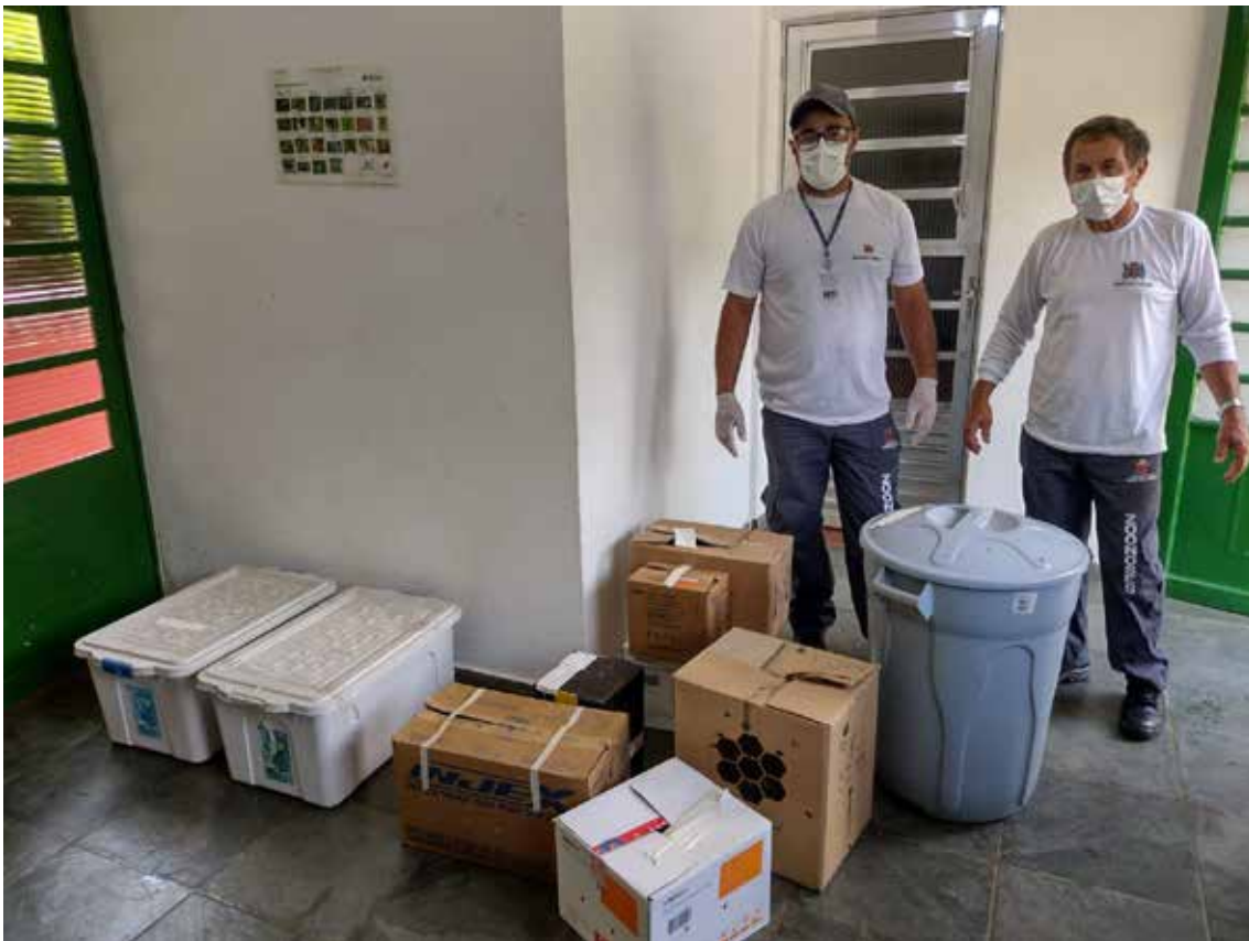
Recebimento de animal silvestre no Cras resgatado por agentes ambientais de Mogi das Cruzes.