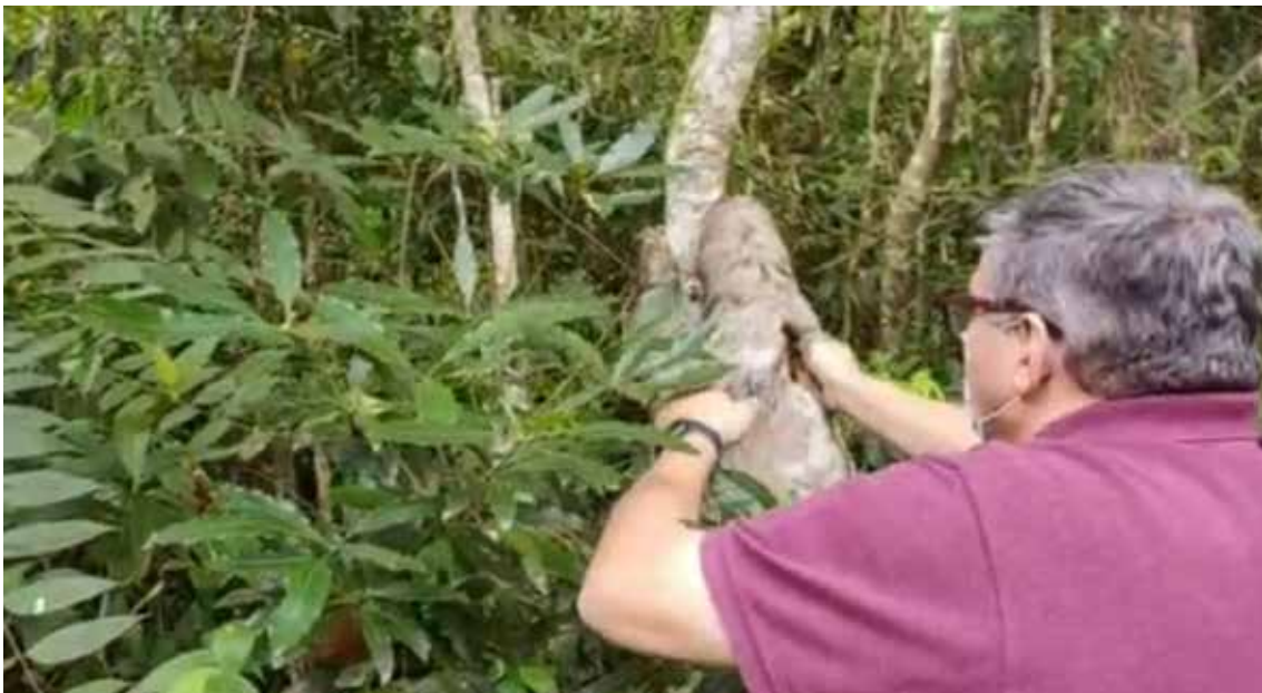
Soltura de bicho-preguiça realizada em Mogi das Cruzes.