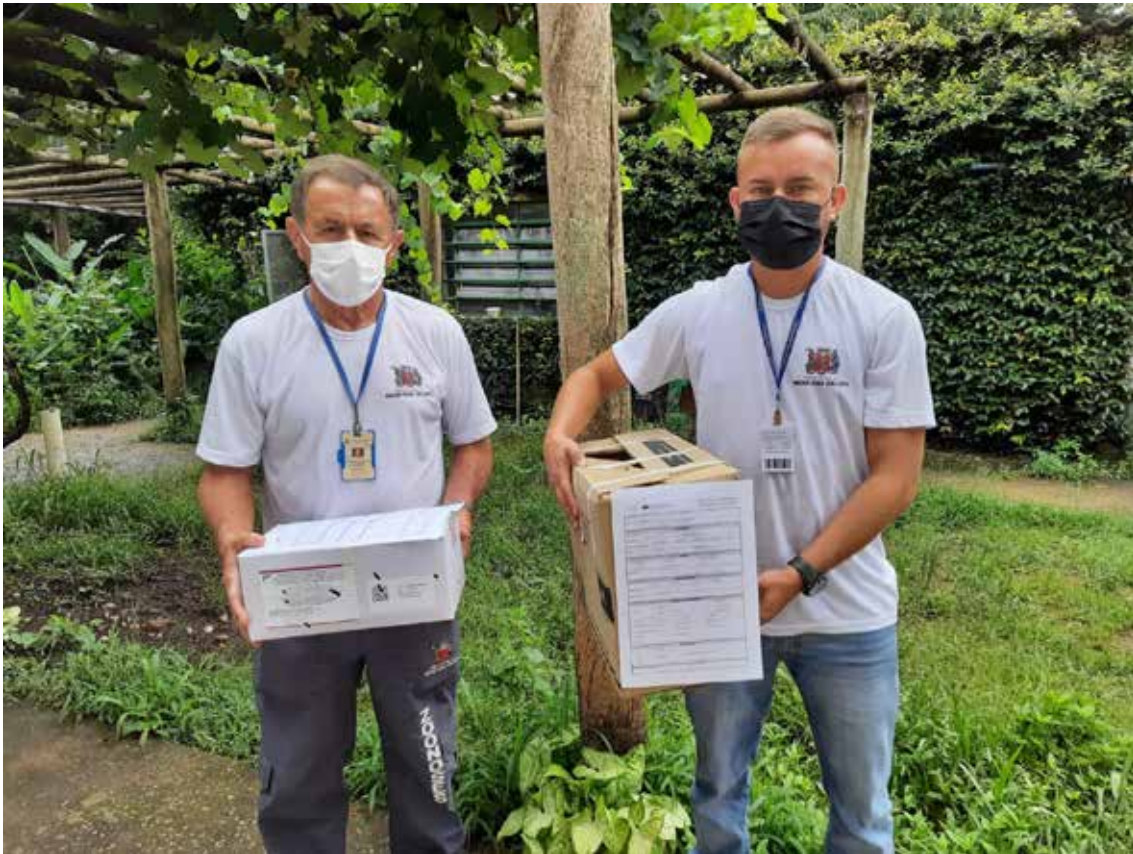
Recebimento de animal silvestre no Cras resgatado por agentes ambientais de Mogi das Cruzes.