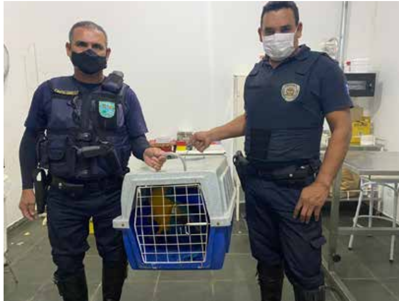
Recebimento de animal silvestre no Cras resgatado por agentes ambientais de Itatiba.