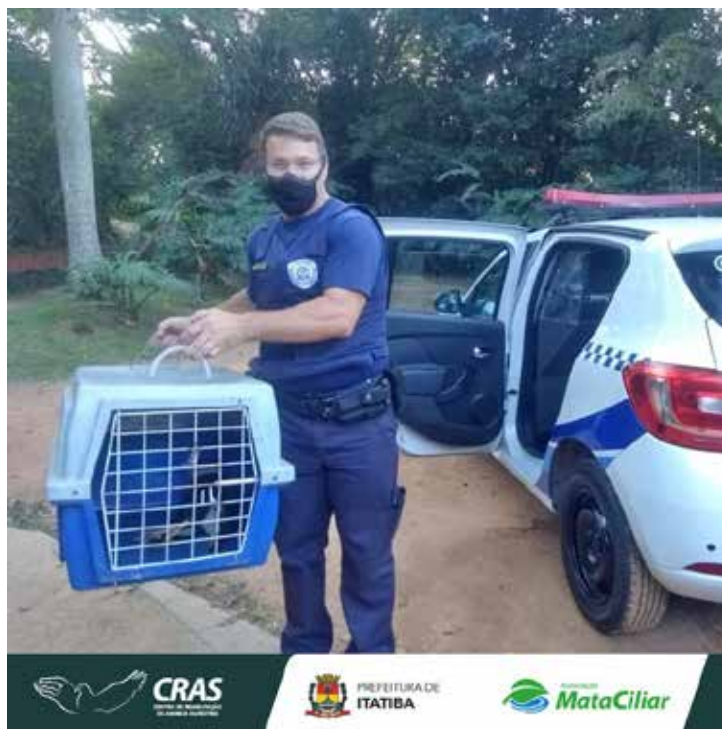
Recebimento de animal silvestre no Cras resgatado por agente ambiental de Itatiba.