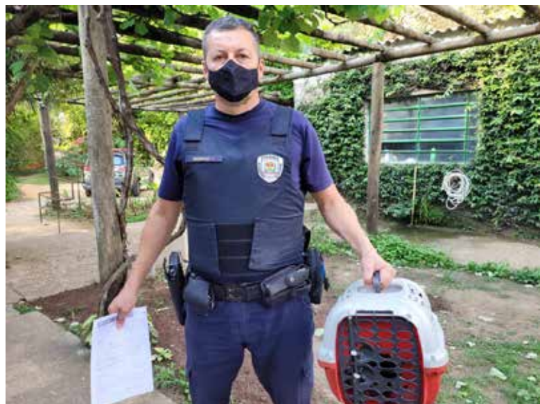
Recebimento de animal silvestre no Cras resgatado por agente ambiental de Itatiba.