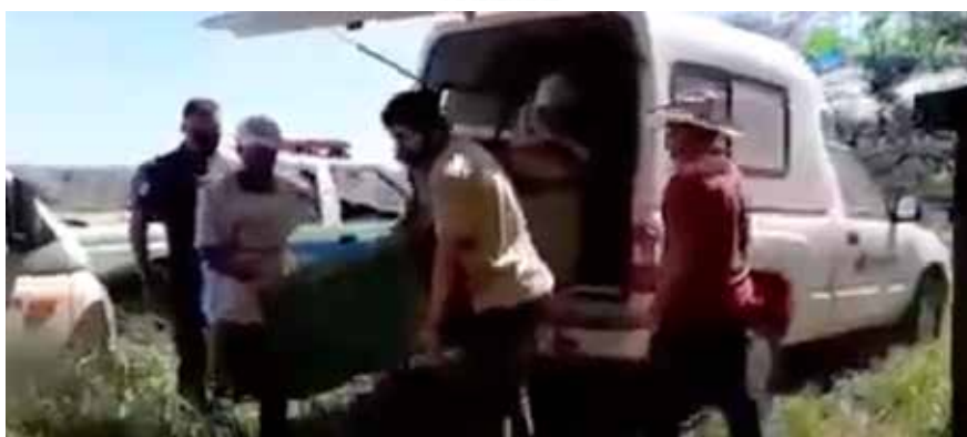
Soltura de cachorros-do-mato com participação dos agentes ambientais de Itatiba.