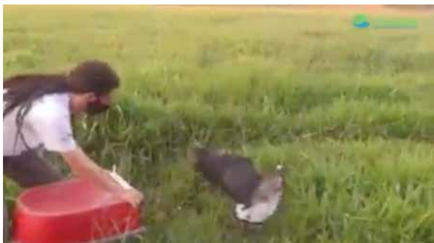
Soltura aves resgatadas em Itatiba.