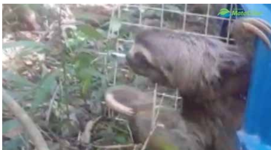
Soltura de bicho-preguiça resgatado em Itatiba.