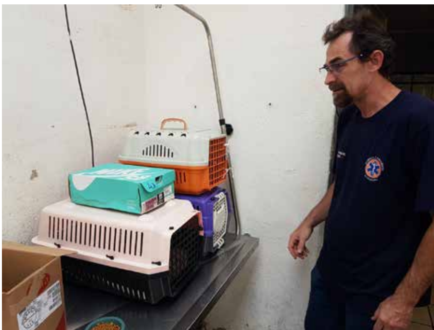
Retirada de animais silvestres recebidos no abrigo e trazidos até o CRAS em Jundiáí.