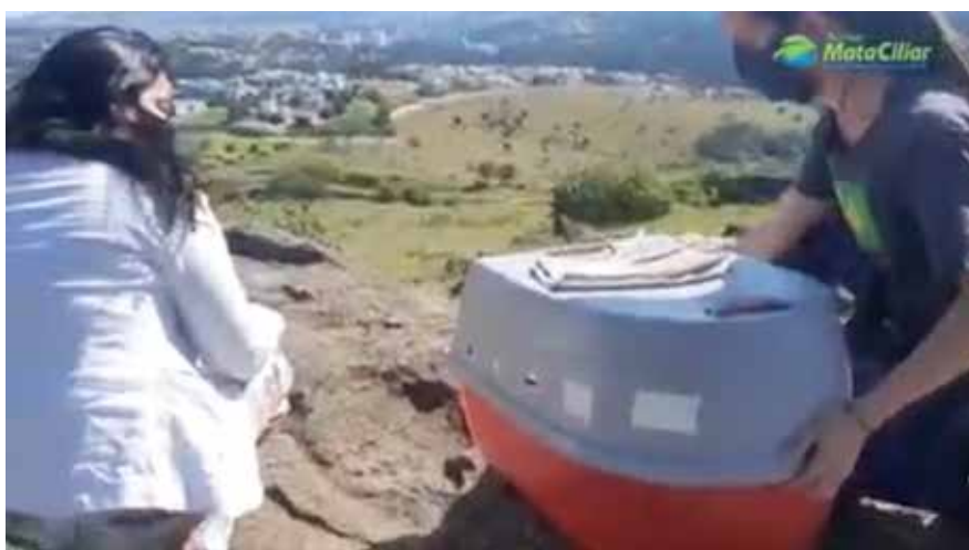
Soltura de ave realizada em parceria com a Secretaria de Meio Ambiente de Bragança Paulista.