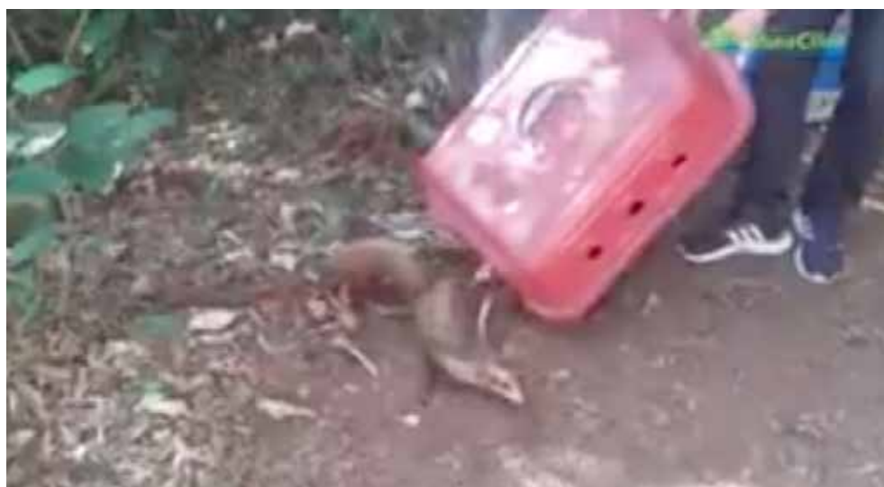
Soltura de gambás realizada em parceria com a Secretaria de Meio Ambiente de Bragança Paulista.