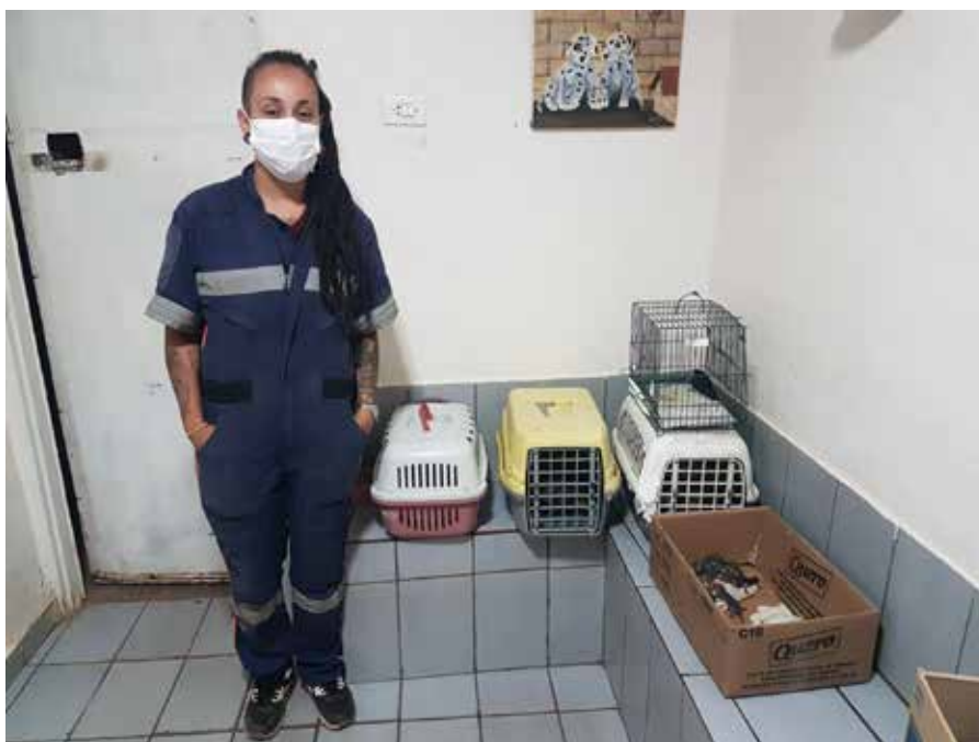
Retirada de animais silvestres recebidos no abrigo e trazidos até o CRASs em Jundiáí.