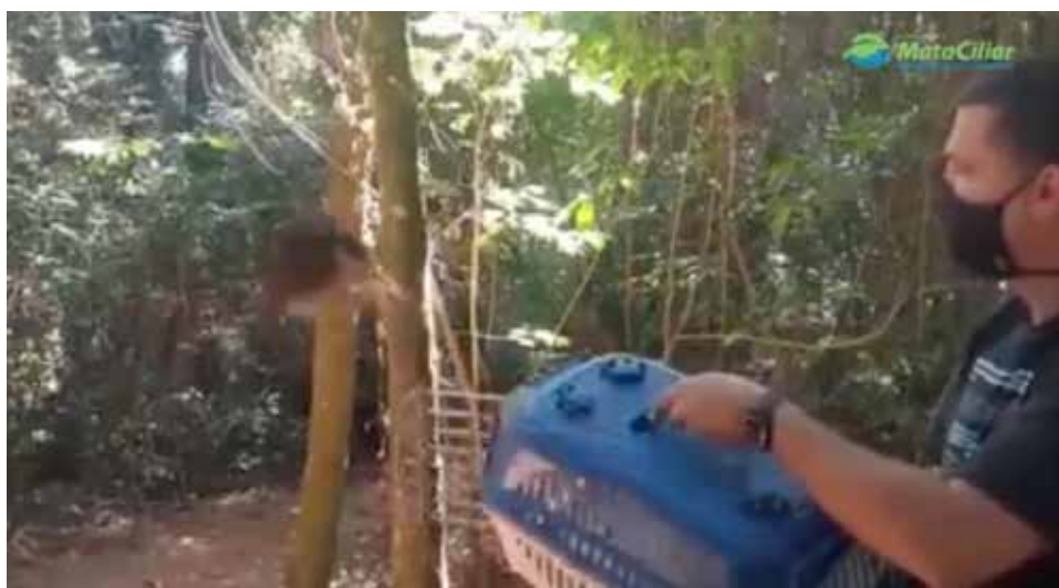
Soltura de ave realizada em parceria com a Secretaria de Meio Ambiente de Bragança Paulista.