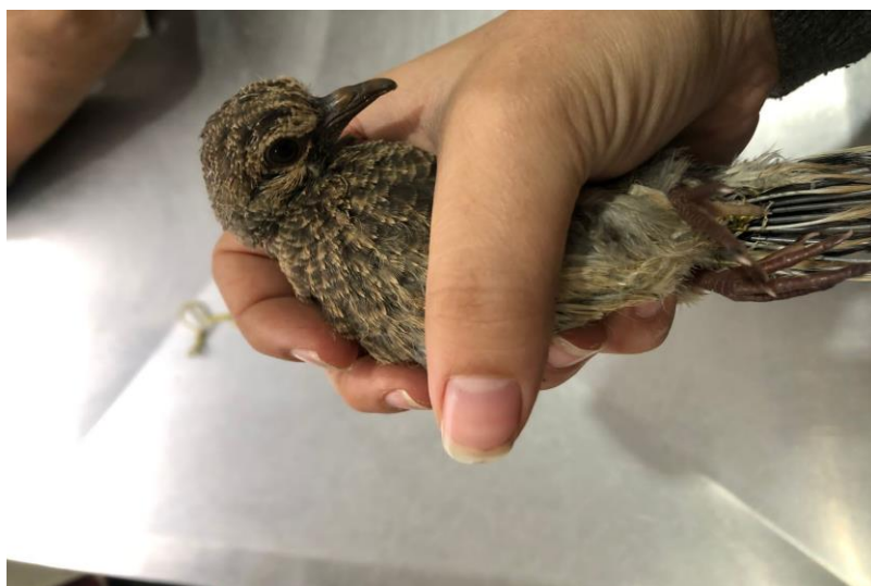
(44016) – Avoante.