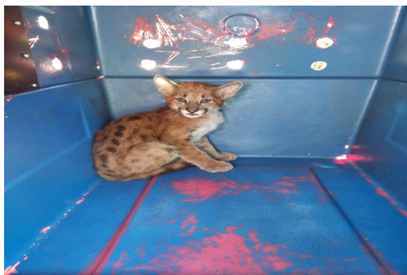
(44029) - Onça-parda.