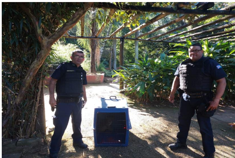
(44029) - Onça-parda, filhote, atacado por cão. Entregue pela Guarda Municipal de Itupeva no dia 18-06-2023.