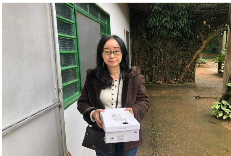
(44016) - Avoante, encontrada em condomínio. Entregue por município de Itupeva no dia 16-06-2023.