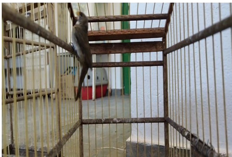
(43915) – Coleirinho.