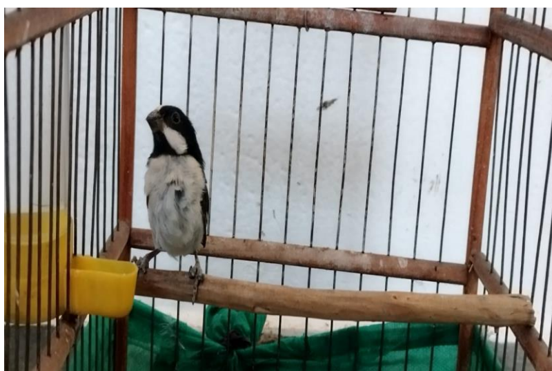
(43914) – Bigodinho.

(43914) – Bigodinho; (43915) – Coleirinho; e (43916) - Trinca-ferro. Todos vindos de apreendidos em Itupeva e entregues pela Polícia Militar Ambiental no dia 02-06-2023.