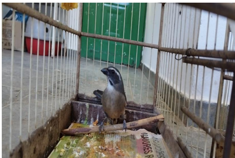
(43916) - Trinca-ferro.