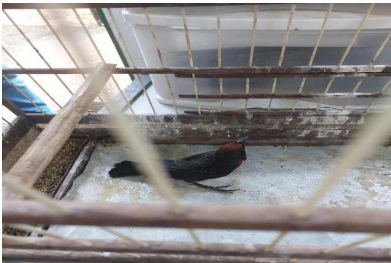
(43218) – Garibaldi.