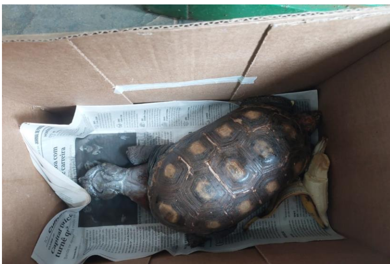
(43219) – Jabuti.