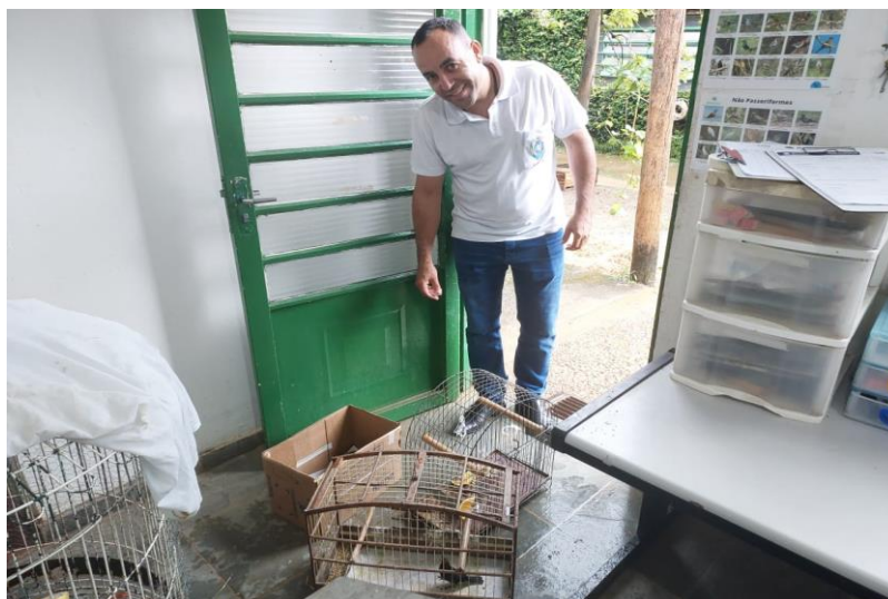
(43217) - Galo-da-campina; (43218) - Garibaldi, apresenta crescimento excessivo de unhas; e (43219) - Jabuti, apresenta prolapso peniano. Entregues pela Prefeitura de Piracicaba no dia 14-03-2023.