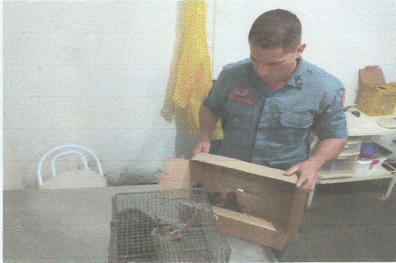
(40240 a 40244) – Gambás-de-orelha-branca, mãe com filhotes retirados de fundo de quintal, entregues por bombeiros de Várzea Paulista no dia 07-10-2022.