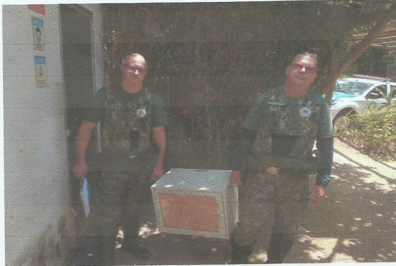
(40655) – Urubu, encontrado em residência. Entregue pela GM de Várzea Paulista no dia 24-10-2022.