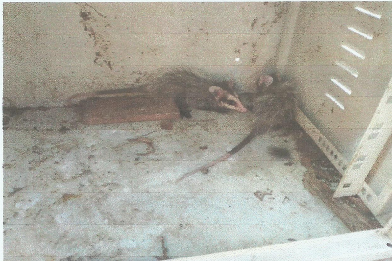
(40691 e 40692) – Gambás-de-orelha-branca, encontrados sozinhos. Entregues pela GM de Várzea Paulista no dia 25-10-2022.