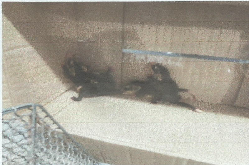
(40241 a 40244) – Gambás-de-orelha-branca, filhotes, entregues por bombeiros de Várzea Paulista no dia 07-10-2022.