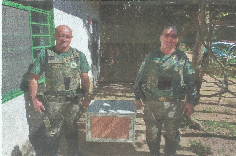
(40691 e 40692) – Gambás-de-orelha-branca, encontrados sozinhos. Entregues pela GM de Várzea Paulista no dia 25-10-2022.