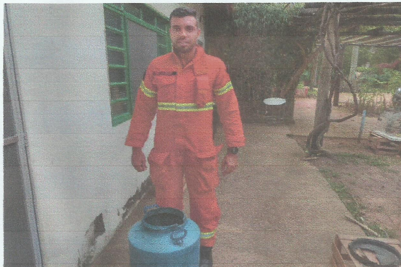
(40515) – Gambá-de-orelha-preta, atacado por cão, entregue pela Defesa Civil de Várzea Paulista no dia 17-10-2022.