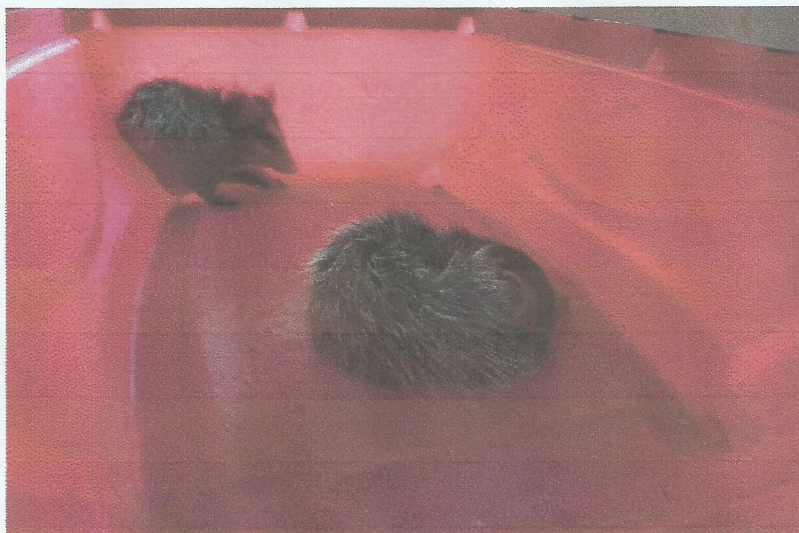
(40645 e 40646) – Gambás-de-orelha-branca, filhotes. Entregues pela GM de Várzea Paulista no dia 24-10-2022.