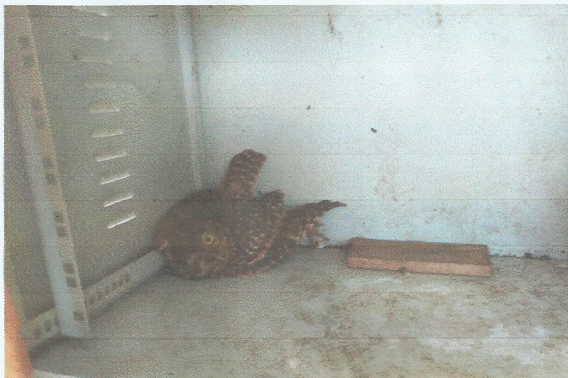
(40718) – Coruja-buraqueira, encontrada ferida em garagem. Entregue pela GM de Várzea Paulista no dia 27-10-2022.