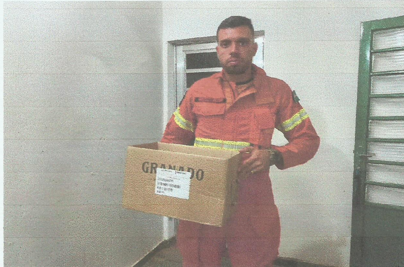
(40357 e 40358) – Gambás-de-orelha-branca, prostrados e com larvas, entregues pela Defesa Civil de Várzea Paulista no dia 10-10-2022.