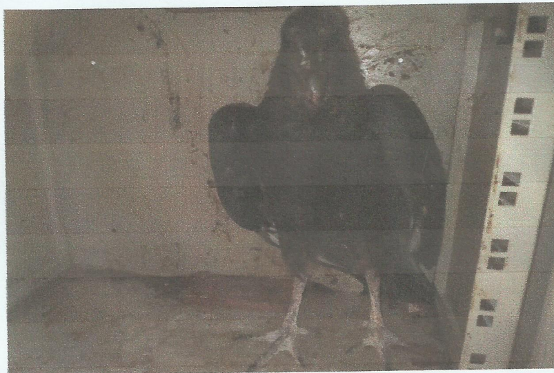
(40655) – Urubu, encontrado em residência. Entregue pela GM de Várzea Paulista no dia 24-10-2022.

A handwritten signature in blue ink, located in the lower right quadrant of the page.