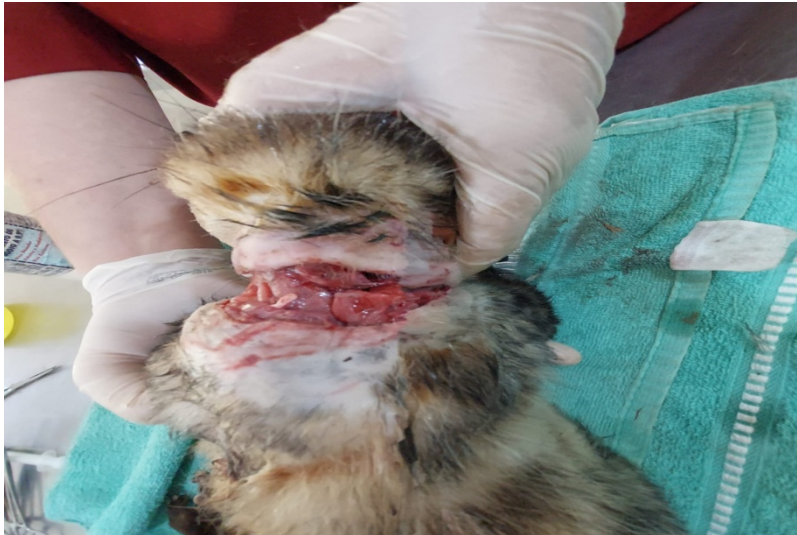
(39299) - Gambá-de-orelha-branca vítima de ataque de cão, trazido pela GM de Jundiá no dia 23-08-22.