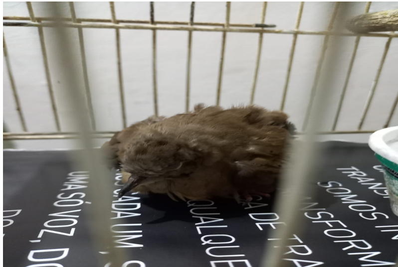
(39174) - Rolinha-caldinho-de-feijão jovem atacada por cão com lesão em dorso, trazida pela GM de Jundiaí no dia 01-08-22.