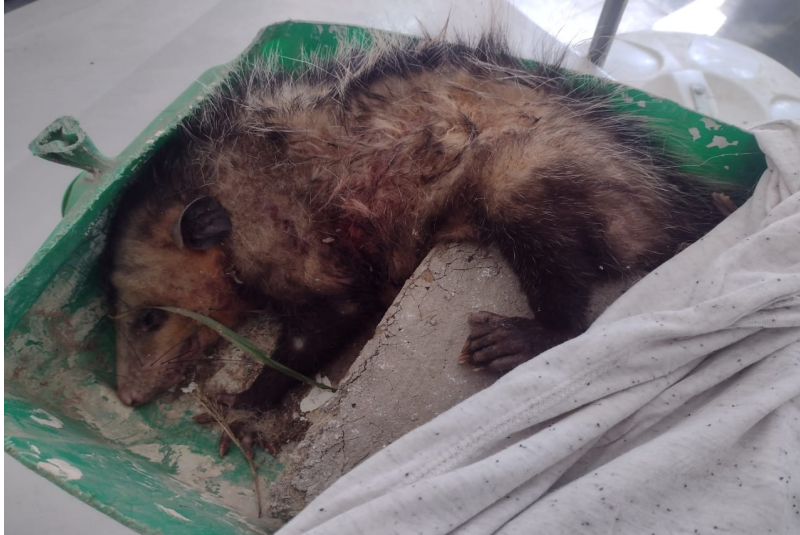
(39205) - Gambá-de-orelha-preta atacado por cão, trazido por munícipe de Jundiaí no dia 06-08-22.