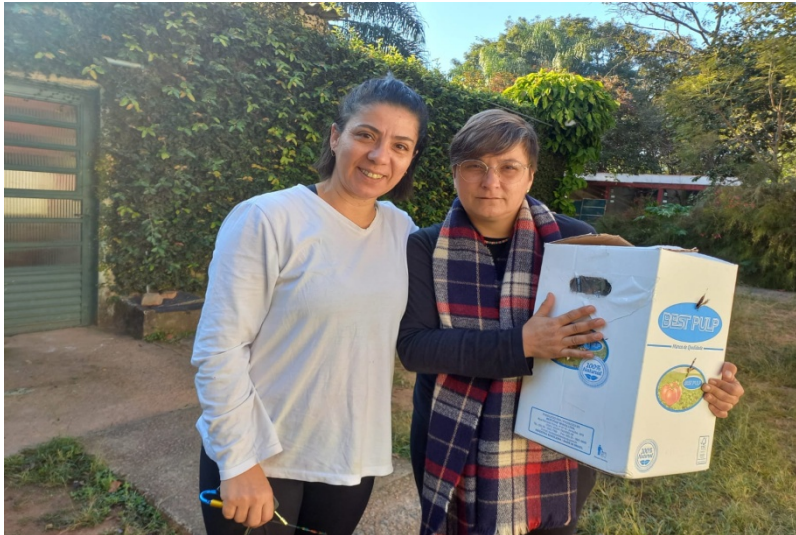
(39175) - Maritaca com penas cortadas trazida por munícipe de Jundiáí no dia 02-08-22.