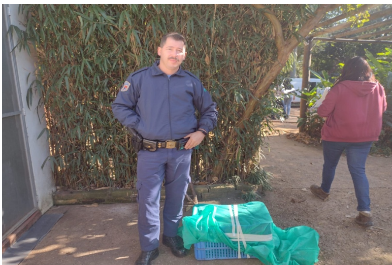
(39187) - Tucano-toco caído em estrada de Jundiáí trazido por PM no dia 03-08-22.