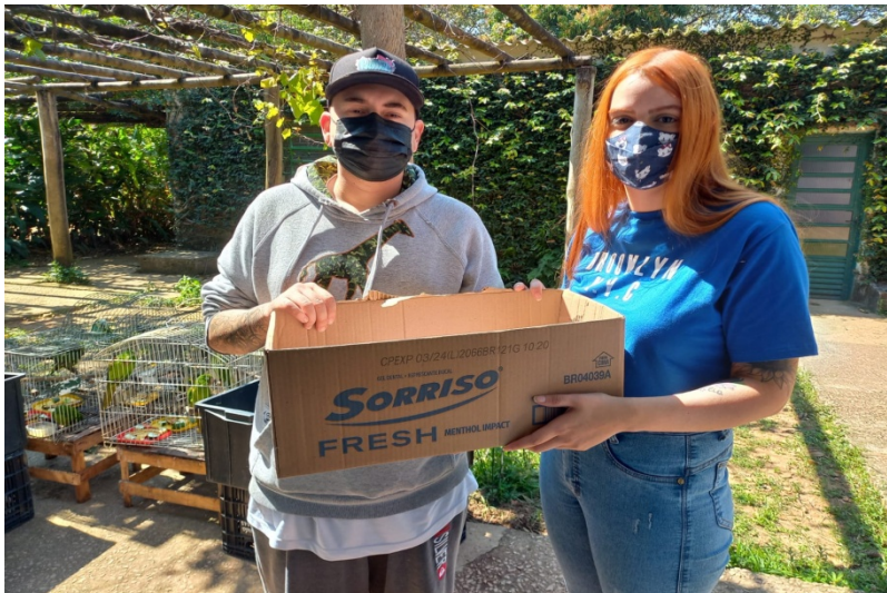
(39296) – Rolinha-roxa filhote, com lesão em membro pélvico, encontrada por munícipes de Jundiá que a viram cair de uma árvore no dia 22-08-22.