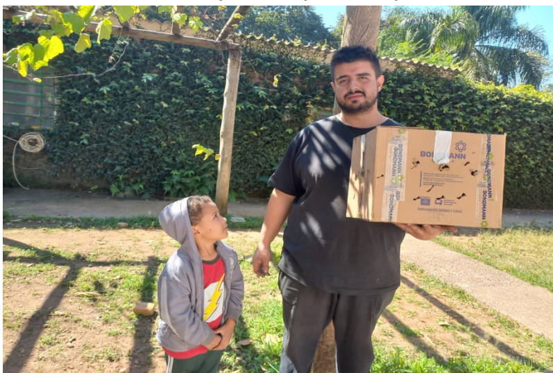
(39176) - Maitaca com lesão de cabeça trazida por munícipe de Jundiáí no dia 02-08-22.