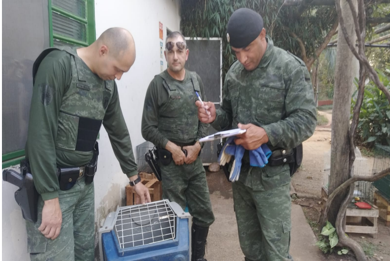
(39181 - 39182) - Ouriços-cacheiros encontrados em escola trazido pela GM de Jundiáí no dia 02-08-22.