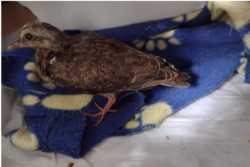
(39172) - Rolinha encontrada caída no chão trazida por munícipe de Jundiaí no dia 01-08-22.