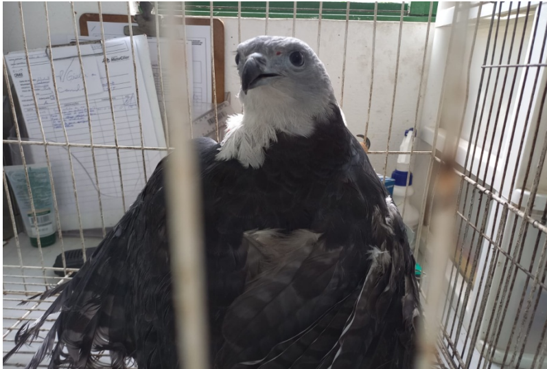
(39214) - Gavião-de-cabeça-cinza, trazido pela GM de Jundiaí, por transferência do Bosque dos Jequitibás no dia 08-08-22.