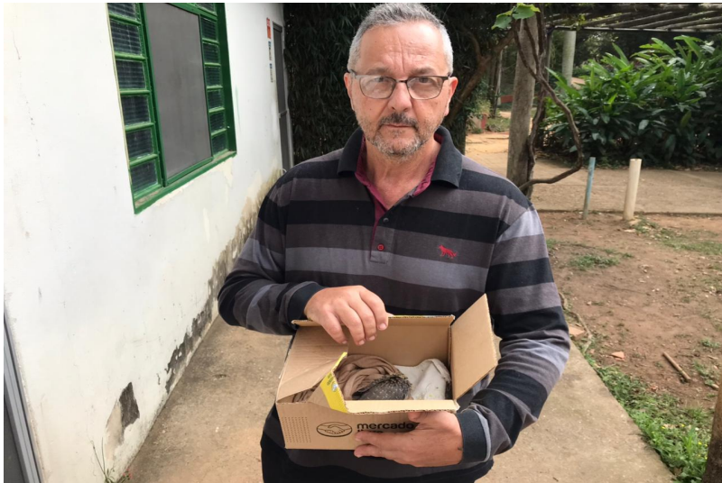
(39210) - Rolinha atacada por gato trazida por munícipe de Jundiaí no dia 07-08-22.