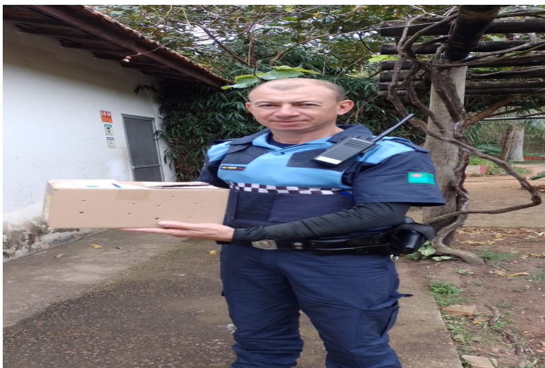
(39270 - 39271) - Corujinhas-do-mato encontradas em Jundiaí trazidas pela GM no dia 17-08-22.