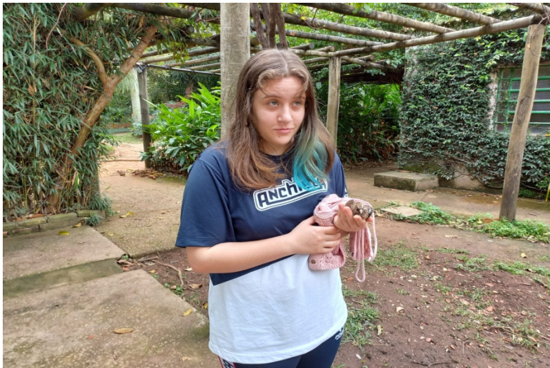
(39219) - Rolinha-roxa, órfão, caiu do ninho, trazida por munícipe de Jundiaí no dia 09-08-22.