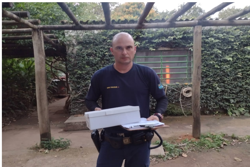
(39174) - Rolinha-caldinho-de-feijão jovem atacada por cão com lesão em dorso, trazida pela GM de Jundiaí no dia 01-08-22.