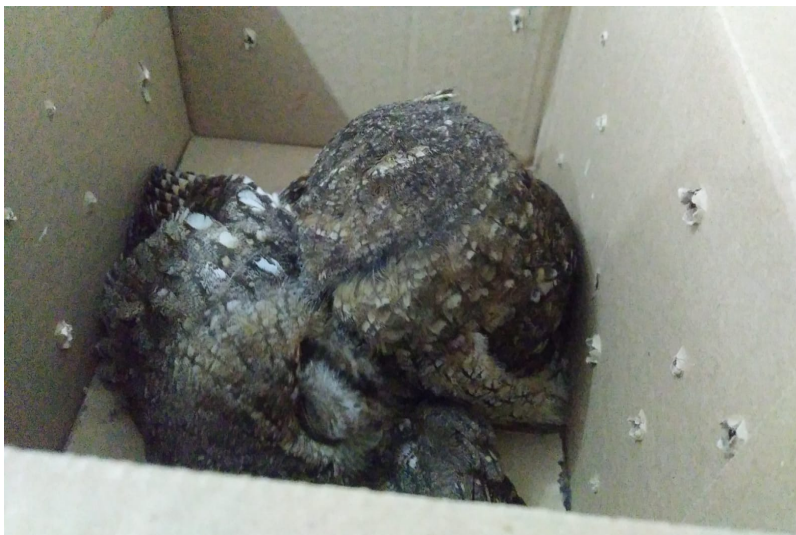
(39270 - 39271) - Corujinhas-do-mato encontradas em Jundiaí trazidas pela GM no dia 17-08-22.