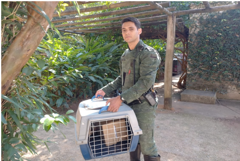
(39299) - Gambá-de-orelha-branca vítima de ataque de cão, trazido pela GM de Jundiaí no dia 23-08-22.