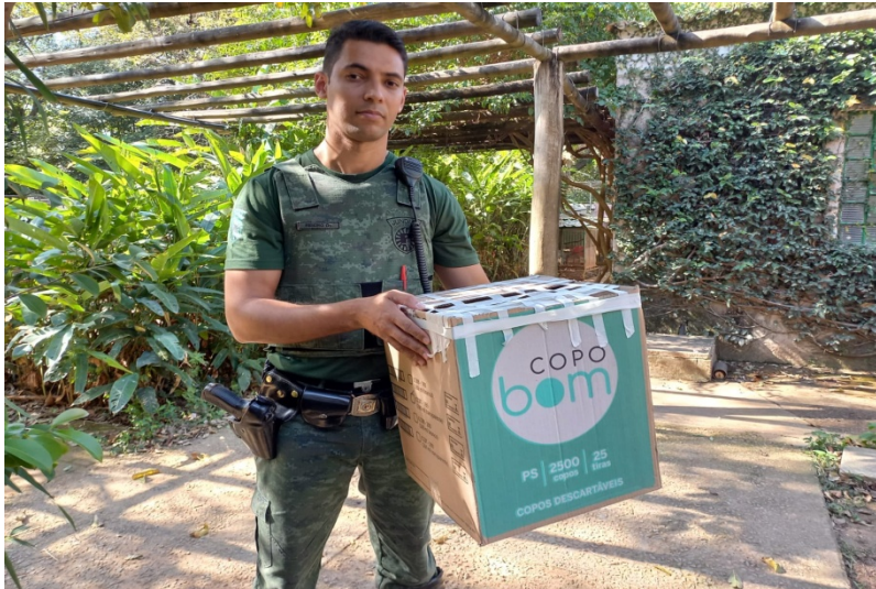
(39259) - Biguá trazido por GM de Jundiaí no dia 15-08-22.