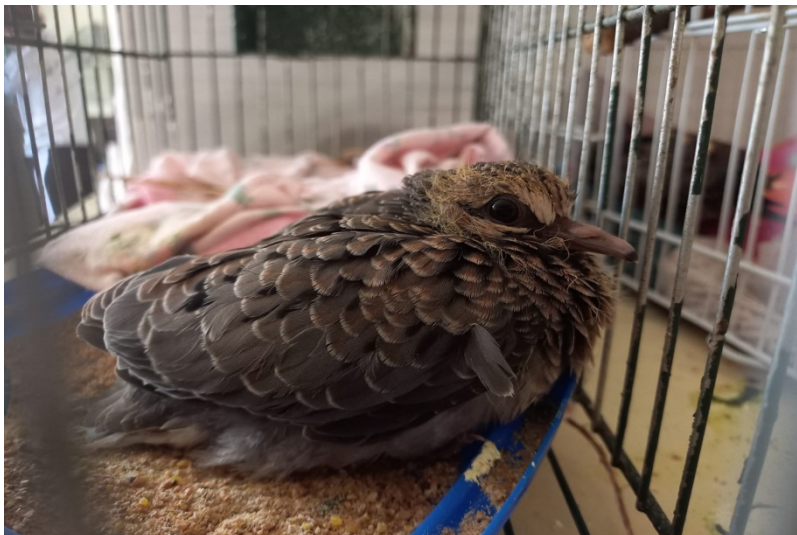
(39296) – Rolinha-roxa filhote, com lesão em membro pélvico, encontrada por munícipes de