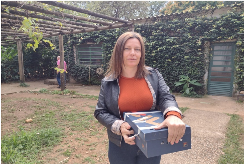
(39172) - Rolinha encontrada caída no chão trazida por munícipe de Jundiaí no dia 01-08-22.