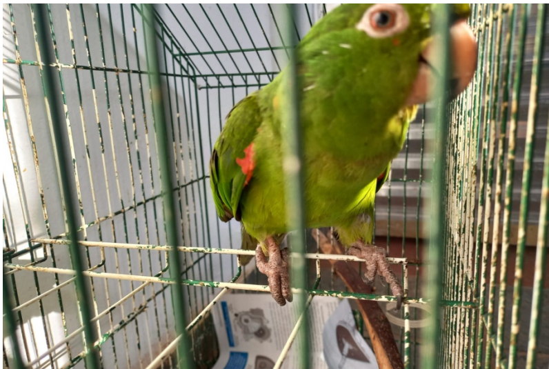
(39175) - Maritaca com penas cortadas trazida por munícipe de Jundiáí no dia 02-08-22.