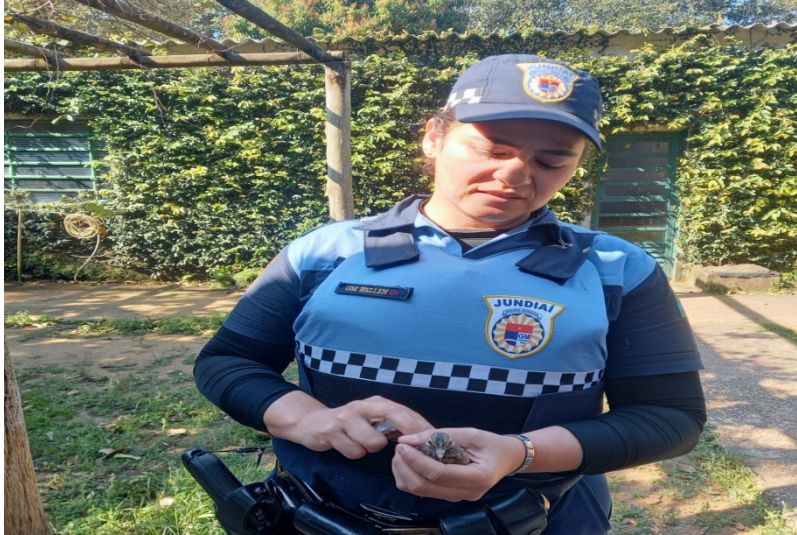
(39296) - Rolinha filhote encontrada caída no chão por munícipe e trazida pela GM de Jundiaí no dia 22-08-22.