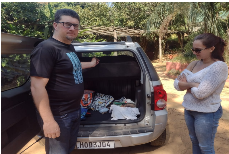
(39205) - Gambá-de-orelha-preta atacado por cão, trazido por munícipe de Jundiá no dia 06-08-22.