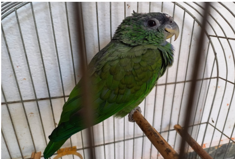
(39176) - Maitaca com lesão de cabeça trazida por munícipe de Jundiáí no dia 02-08-22.