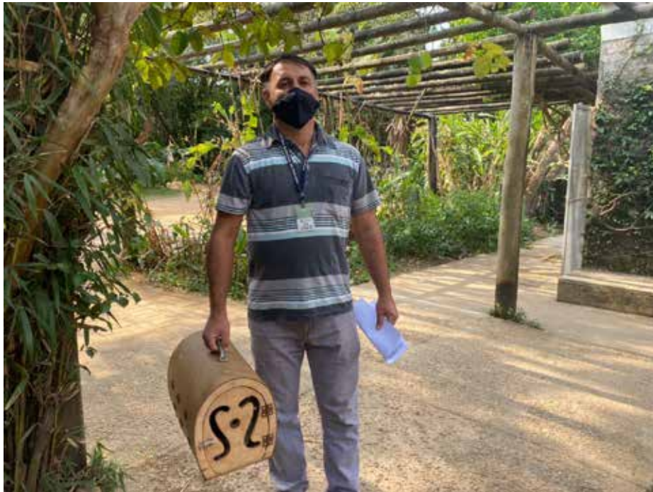
Recebimento de animal silvestre no Cras resgatado por agente ambiental de Paulínia.