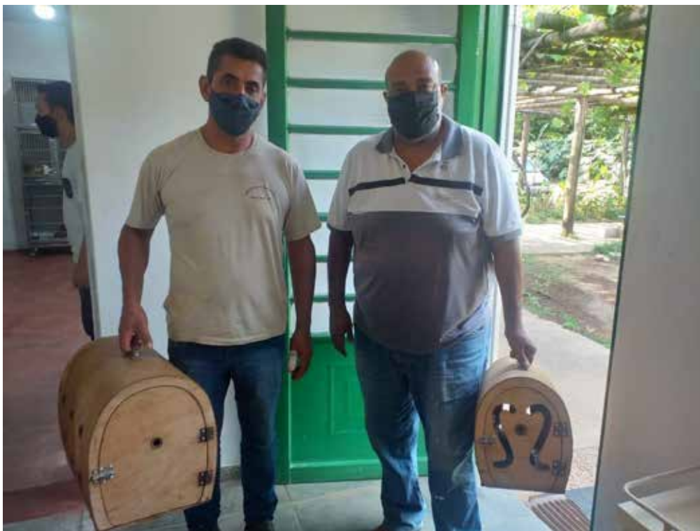
Recebimento de animal silvestre no Cras resgatado por agente ambiental de Paulínia.