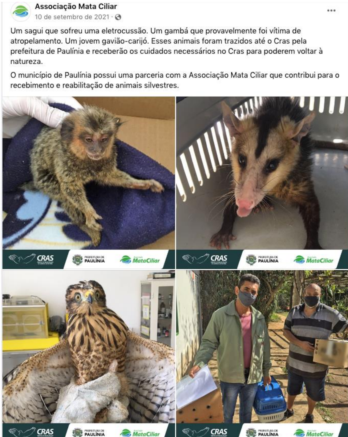
Exemplo de umas das postagens publicadas nas redes sociais da Associação Mata Ciliar evidenciando a parceria com o município de Paulínia.