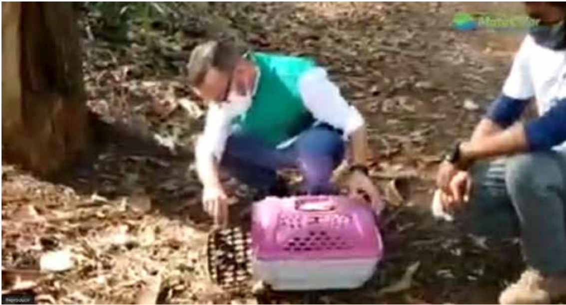
Soltura animais com a participação de agentes ambientais e do Secretário de Meio Ambiente de Paulínia.