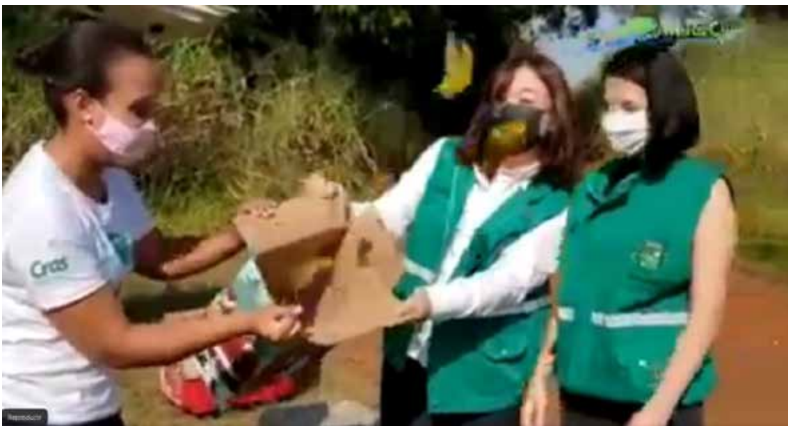
Soltura animais com a participação de agentes ambientais de Paulínia.