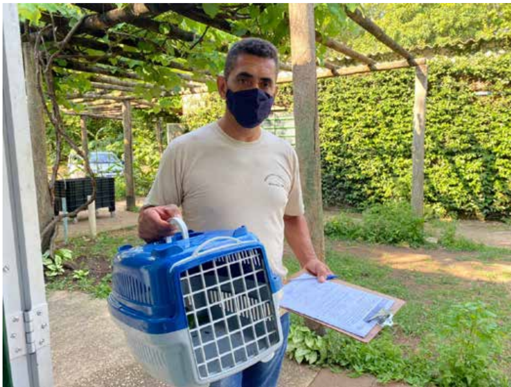
Recebimento de animal silvestre no Cras resgatado por agente ambiental de Paulínia.