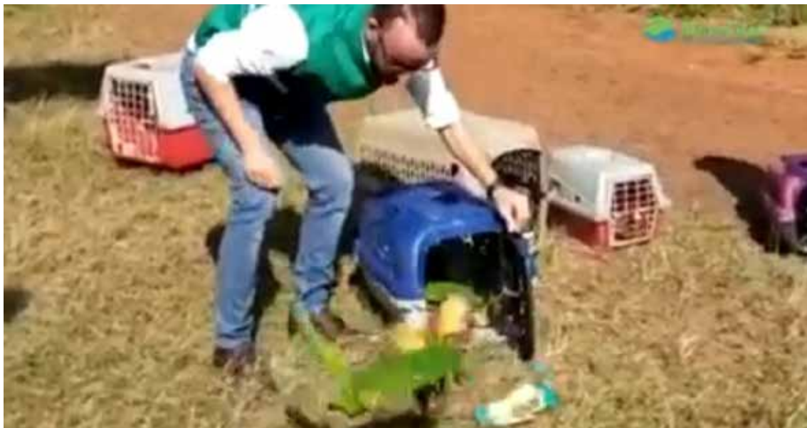
Soltura de animais com a participação de agentes ambientais e do Secretário de Meio Ambiente de Paulínia.