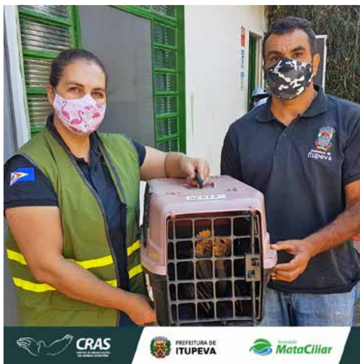
Recebimento de animal silvestre no Cras resgatado por agentes ambientais de Itupeva.