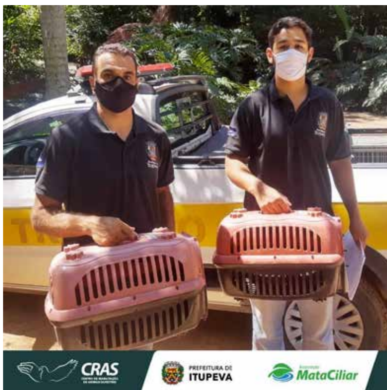
Recebimento de animal silvestre no Cras resgatado por agentes ambientais de Itupeva.