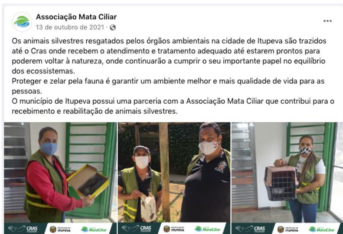
Exemplo de umas das postagens publicadas nas redes sociais da Associação Mata Ciliar evidenciando a parceria com o município de Itupeva.