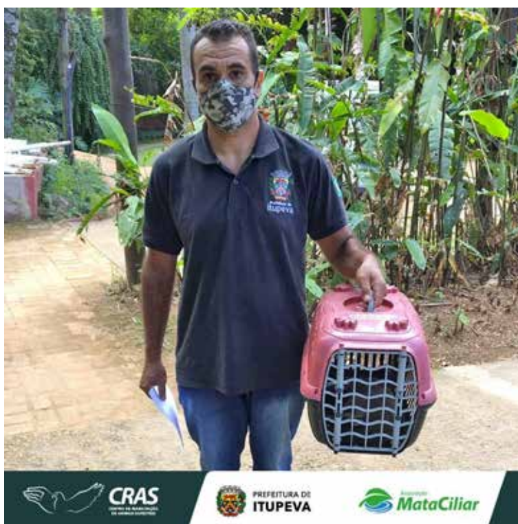
Recebimento de animal silvestre no Cras resgatado por agentes ambientais de Itupeva.