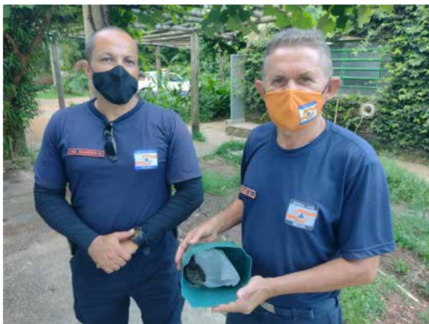
Recebimento de animal silvestre no Cras resgatado pela Guarda Municipal de Campo Limpo Paulista.