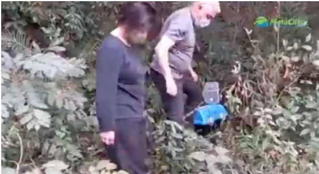
Soltura de um gambá com a participação do veterinário da Secretaria de Meio Ambiente de Campo Limpo Paulista.