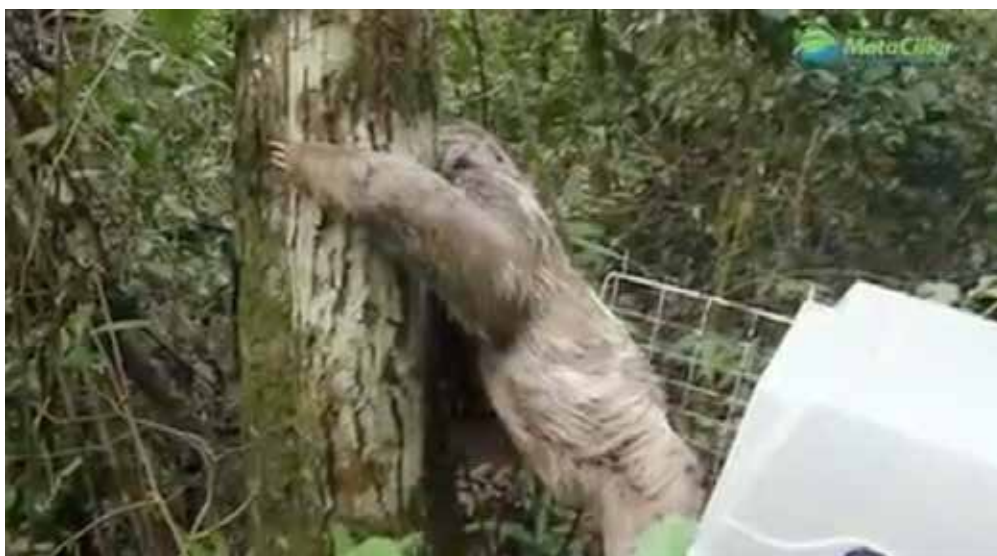
Soltura de bicho-preguiça resgatado as margens de uma rodovia em Campo Limpo Paulista.