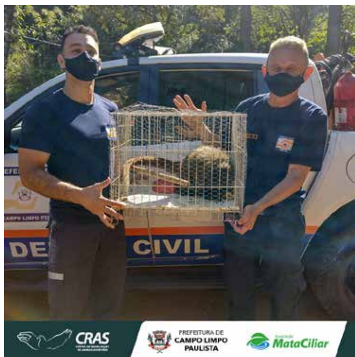
Recebimento de animal silvestre no Cras resgatado pela Guarda Municipal de Campo Limpo Paulista.