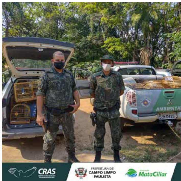
Recebimento de animal silvestre no Cras resgatado pela Guarda Municipal de Campo Limpo Paulista.