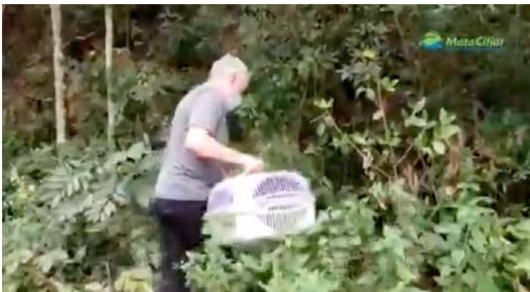
Soltura de um ouriço com a participação do veterinário da Secretaria de Meio Ambiente de Campo Limpo Paulista.